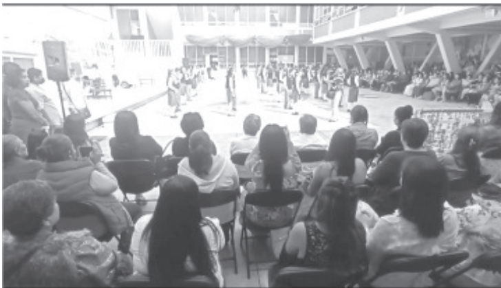
Luego de la pandemia de covid-19 que afectó las actividades cotidianas de todos los sectores, este año en las escuelas de todos los niveles, volvieron los festivales del Día de la Madre y se adelantaron un día antes de la fecha.

Entre las participaciones artísticas estuvieron la danza de los viejitos, la boda del cuitlacoche, tablas rítmicas, bailables regionales y las tradicionales mañanitas.