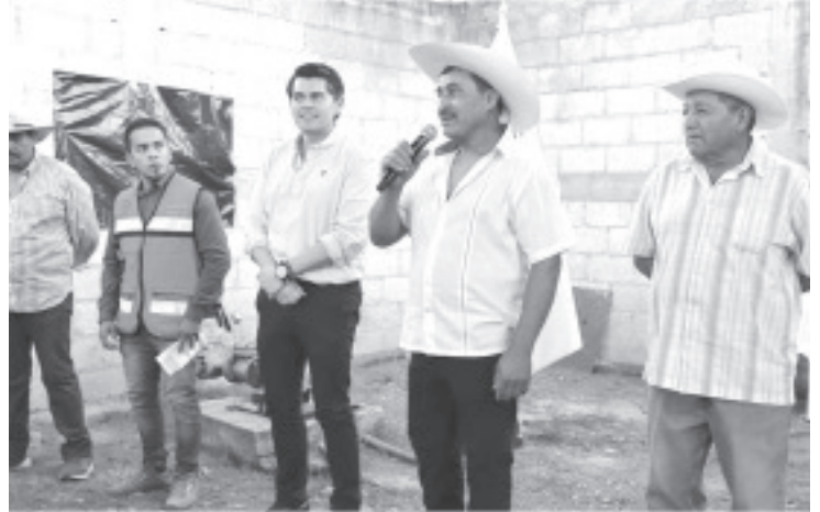
Una de las prioridades del gobierno de Toño Ixtláhuac es cercar servicios básicos, no solo en colonias, sino también en la zona rural, principalmente con tecnificación, como lo es en la comunidad de Ocurio, donde Toño Ixtláhuac puso en marcha la ampliación de una extensa red de agua potable.