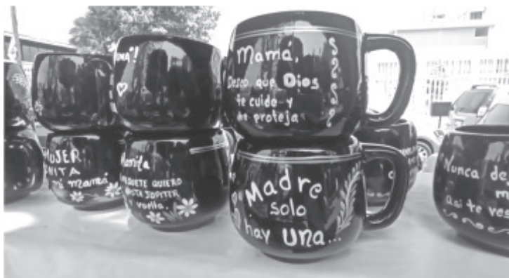
Artesanos locales de varias comunidades del municipio, se sumaron a la venta de regalos para el Día de las madres.