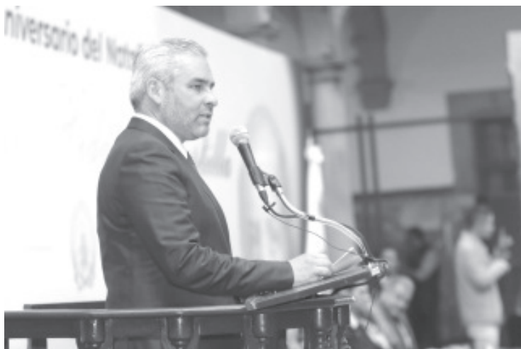
El gobernador Alfredo Ramírez Bedolla reiteró su respaldo para que la Universidad Michoacana de San Nicolás de Hidalgo (UMSNH), alcance el reconocimiento de institución nacional y con ello, presupuesto suficiente para su operatividad y desarrollo.

Morelia, Michoacán, 8 de mayo de 2023.- El gobernador Alfredo Ramírez Bedolla reiteró su respaldo para que la Universidad Michoacana de San Nicolás de Hidalgo (UMSNH), alcance el reconocimiento de institución nacional y con ello, presupuesto suficiente para su operatividad y desarrollo.