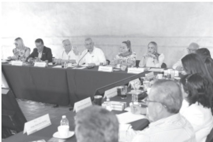
El gobernador Alfredo Ramírez Bedolla, buscará que la aerolínea Mexicana de Aviación amplíe su cobertura a Michoacán con vuelos directos a Lázaro Cárdenas y Uruapan.

El secretario de Turismo federal, coincidió en mantener el trabajo conjunto con el estado para promover, entre otros, productos y servicios turísticos de sus lugares emblemáticos, tradicionales e históricos de Michoacán.