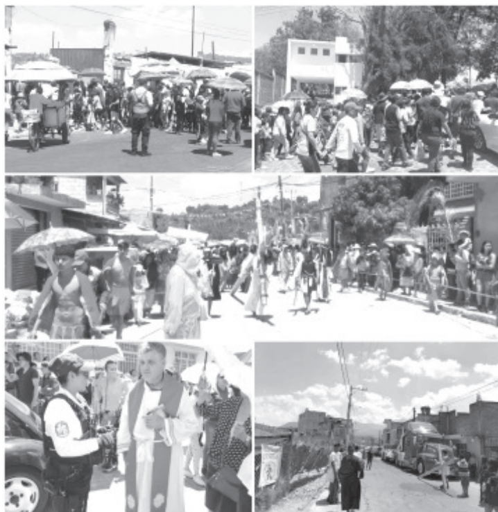
Después de culminar la gran afluencia de visitantes en los diversos puntos turísticos de Zitácuaro, el Secretario de Seguridad Pública Municipal informó que el operativo de Semana Santa Segura 2023, tuvo como resultado un saldo blanco.

El Secretario de Seguridad Pública Municipal resaltó que durante los cuatro días santos no se presentó ningún incidente grave que lamentar, mencionando que se llevaron a cabo recorridos por todos los centros recreativos, los viacrucis, así como en los eventos realizados durante el "Presa Fest Zitácuaro 2023".