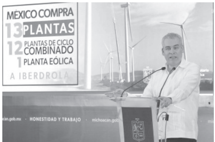
El gobernador Alfredo Ramírez Bedolla, informó en conferencia de prensa que la reciente adquisición de las 13 plantas de Iberdrola, no generará endeudamiento para las y los mexicanos.

Ramírez Bedolla indicó también que la CFE tenía un 39.6 por ciento de la producción de energía eléctrica y con la adquisición de las plantas pasará a un 55.5 por ciento, teniendo la mayor participación de energía eléctrica y garantizando el no aumento en el precio a los consumidores.