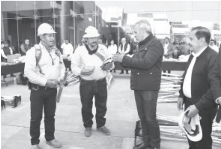
El gobernador Alfredo Ramírez Bedolla informó que, por decreto de contingencia ambiental ante la temporada de sequía, los helicópteros oficiales disponibles para sofocar incendios forestales, podrán utilizar cualquier almacenamiento de agua incluidos los del sector aguacatero de Michoacán.

*Morelia, Michoacán, 5 de abril 2023.- * El gobernador Alfredo Ramírez Bedolla informó que, por decreto de contingencia ambiental ante la temporada de sequía, los helicópteros oficiales disponibles para sofocar incendios forestales, podrán utilizar cualquier almacenamiento de agua incluidos los del sector aguacatero de Michoacán.