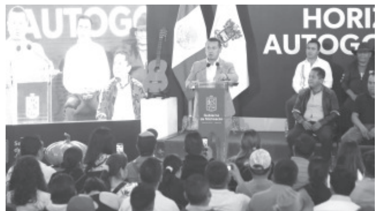
El legado de esta administración que encabeza Alfredo Ramírez Bedolla a Michoacán y al país, es el reconocimiento y respaldo a los autogobiernos como el cuarto nivel de gobierno.

“Estamos transformando la realidad y vamos a trascender en la historia como quienes establecimos este nuevo modelo basado en la justicia”, concluyó.