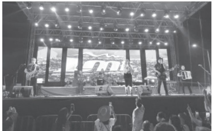
LMT, antes Límite, fue otro de los invitados estelares en el Presa Fest edición 2023 e hicieron bailar y disfrutar a cientos de familias con sus grandes éxitos.