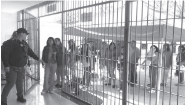
La Coordinación del Sistema Penitenciario informa que a partir de este miércoles se reactivaron las visitas familiares para los internos del Centro Penitenciario "David Franco Rodríguez".

Con estas acciones, el Gobierno de Michoacán refrenda su compromiso de reforzar las tareas encaminadas a mantener la unidad familiar y garantizar los derechos de todos los sectores de la sociedad.