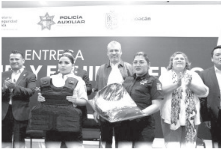
El gobernador Alfredo Ramírez Bedolla entregó uniformes, equipo y armamento a elementos de la Policía Auxiliar como parte de la estrategia de fortalecimiento a las acciones de seguridad pública.

Morelia, Michoacán, 29 de marzo de 2023.- El gobernador Alfredo Ramírez Bedolla entregó uniformes, equipo y armamento a elementos de la Policía Auxiliar como parte de la estrategia de fortalecimiento a las acciones de seguridad pública. El mandatario refrendó el compromiso de su administración para que la Policía Auxiliar