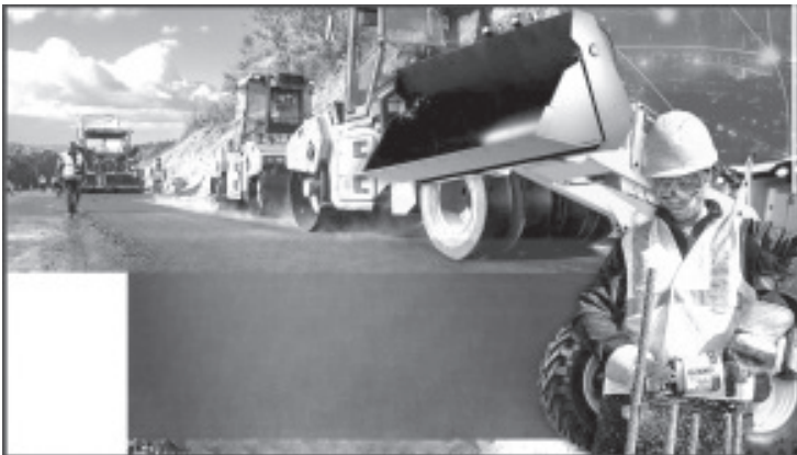
El secretario de Comunicaciones y Obras Públicas (SCOP) Rogelio Zarazúa Sánchez, presentó los principales avances en materia de infraestructura de esta administración estatal al Consejo Michoacano de Negocios, durante una reunión encabezada por el gobernador Alfredo Ramírez Bedolla.

El funcionario expuso también la información relativa a la obra pública multianual, la aplicación de recursos del Fondo de Aportación Múltiple (FAM) para las escuelas, la recuperación de espacios públicos en zonas de atención prioritaria, así como la digitalización del trámite de inscripción al padrón de contratistas del estado, entre otros rubros de acción.