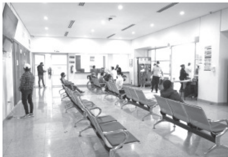
Para garantizar la atención médica oportuna de la población sin seguridad social, la Secretaría de Salud de Michoacán (SSM) mantendrá abiertos los 364 centros de salud del estado durante el periodo vacacional de Semana Santa.

Con estas acciones, la Secretaría de Salud refrenda su compromiso de brindar servicios médicos gratuitos y de calidad a la población los 365 días del año.