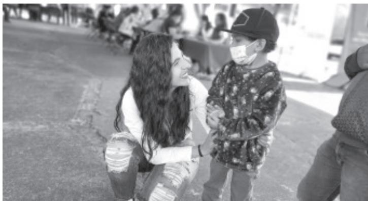
La Secretaría del Bienestar de Michoacán (Sedebi) entregó recursos económicos por más de 1.5 millones de pesos para 378 hogares beneficiarios del Programa para Familias Cuidadoras de Niñas y Niños con Cáncer de cero a 17 años 11 meses, de 101 municipios del estado.

"Estamos convencidos que debemos de actuar a tiempo para proteger la vida de las y los infantes michoacanos, porque representan el presente y futuro de nuestro estado", concluyó.