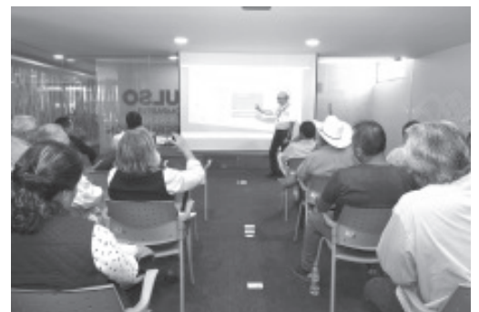
Para acercar opciones de financiamiento a productores acuícolas de diversas regiones del estado, la Secretaría de Desarrollo Económico (Sedeco), la Comisión de Pesca (Compesca) y el Sistema Integral de Financiamiento para el Desarrollo de Michoacán (Sí Financia), ofrecieron segunda reunión informativa.

En el encuentro, convocado por la Dirección de Gestión de