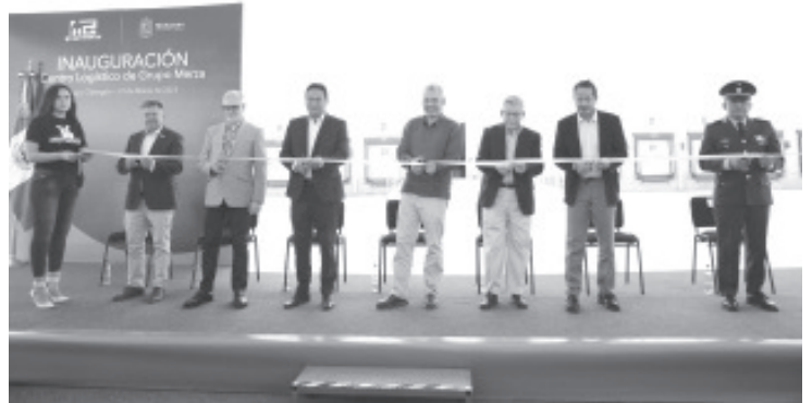
El gobernador Alfredo Ramírez Bedolla, inauguró el Centro Logístico de Grupo Merza en el municipio de Álvaro Obregón, proyecto único en el sector empresarial en Michoacán.

"Se construye la mejor versión de Michoacán, y de manera histórica, se fortalece la inversión con nuevos complejos y parques industriales como éste y el que se desarrolla en Tarimbaro por la iniciativa privada, lo que representa una oportunidad de crecimiento económico para toda la región", comentó.