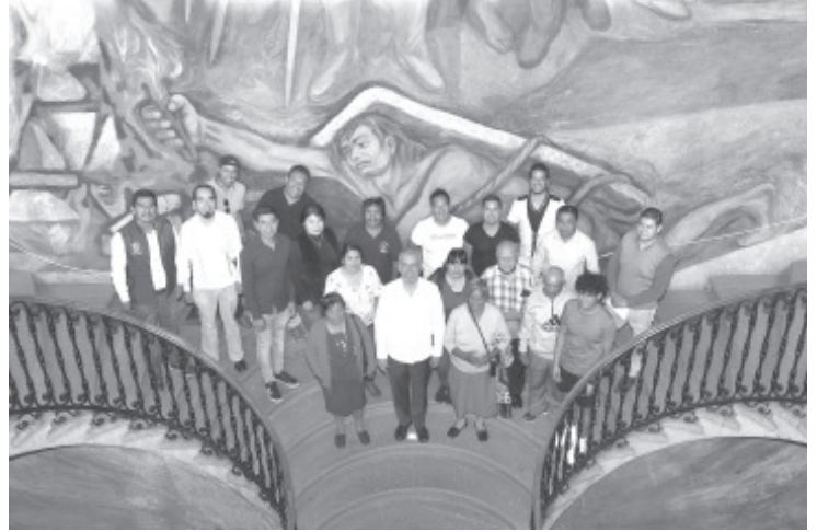
El gobernador Alfredo Ramírez Bedolla enfatizó que no se debe litigar contra el pueblo, por el contrario, se debe respetar su voluntad libre y democrática de ir hacia el autogobierno