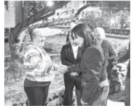
El programa Arropando con Amor que impulsa la diputada Gloria Tapia Reyes, vicecoordinadora del Grupo Parlamentario del Partido Revolucionario Institucional en la LXXV Legislatura del Congreso del Estado, se puso en marcha en La Joya de Zitácuaro, gracias al cual se beneficiaron a las familias de la localidad.

Finalmente, reiteró su agradecimiento a las y los habitantes del distrito de Zitácuaro, para quienes siempre estará de puertas abiertas para seguir colaborando en equipo para el bienestar de las familias de la región y las localidades.