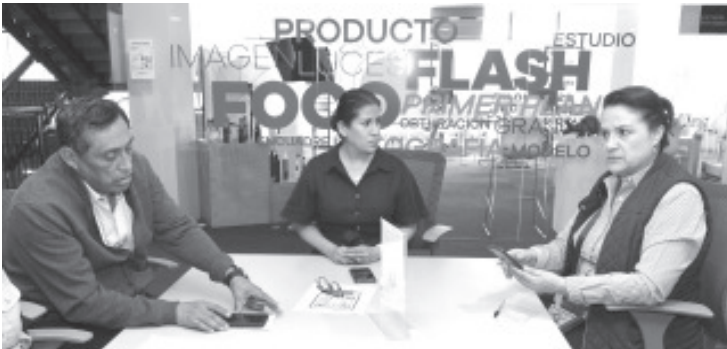
En coordinación con el organismo federal, la Sedeco Michoacán busca impulsar los registros de marca, aviso o nombre comercial de las Mipymes, así como de personas físicas con actividad empresarial.

- La convocatoria para pedir un descuento del 90% se encuentra abierta hasta el 28 de marzo