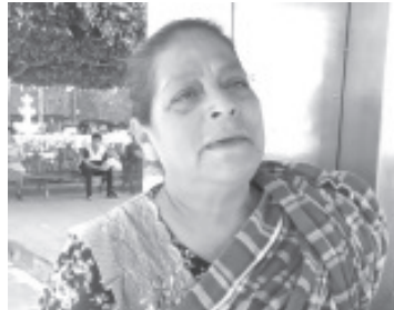
Los artesanos de Zitácuaro están listos para recibir a los visitantes durante la Semana Santa y ofrecerles los artículos que elaboran.

Invitó a zitacuarenses y visitantes a estar pendientes de la fecha en que se instalan y el lugar para que acudan y conozcan todo lo que ellos elaboran, seguramente alguno les gustará.