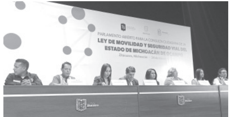
Representantes de todos los sectores de la sociedad aportaron ideas y opiniones para la construcción de la Ley Estatal de Movilidad y Seguridad Vial.