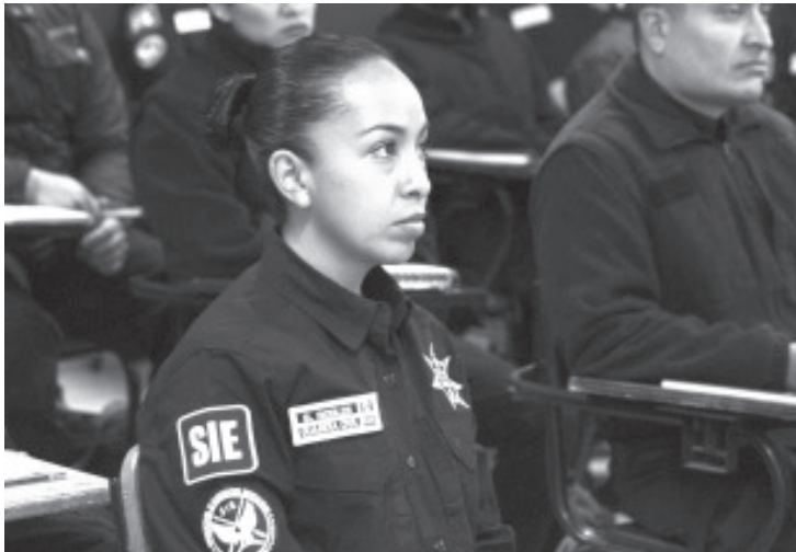
Como parte del compromiso de trabajo interinstitucional para brindar mejor atención a las tareas de seguridad y procuración de justicia, la Fiscalía General del Estado de Michoacán (FGE) dio inicio a las jornadas de trabajo enmarcadas en la "Especialización para Policías con Capacidades para Procesar".

La FGE refrenda su compromiso de coadyuvar en acciones y estrategias que fortalezcan los protocolos de actuación para garantizar a la ciudadanía certeza en el ejercicio de sus derechos..