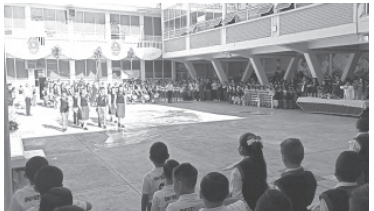
Al grito de "Yo amo a la 18 de marzo" esta escuela primaria en su turno matutino celebró el 84 aniversario de su fundación en esta ciudad.