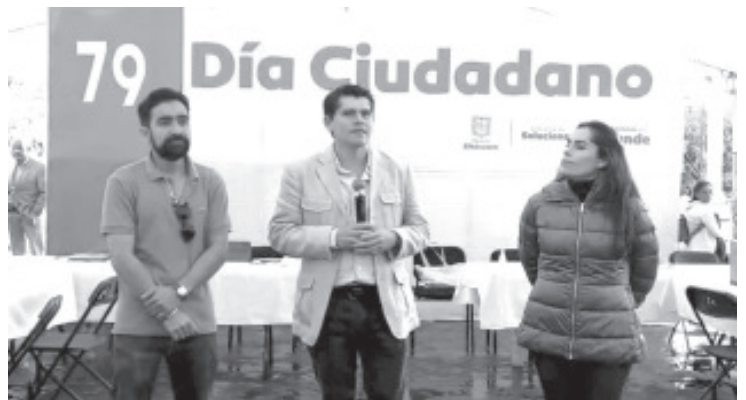
Como un esfuerzo por acercar la música y las artes a los zitacuarenses, el Gobierno Municipal firmará convenio de colaboración con el conservatorio de Las Rosas. Esto permitirá acercar la música y las artes al municipio.