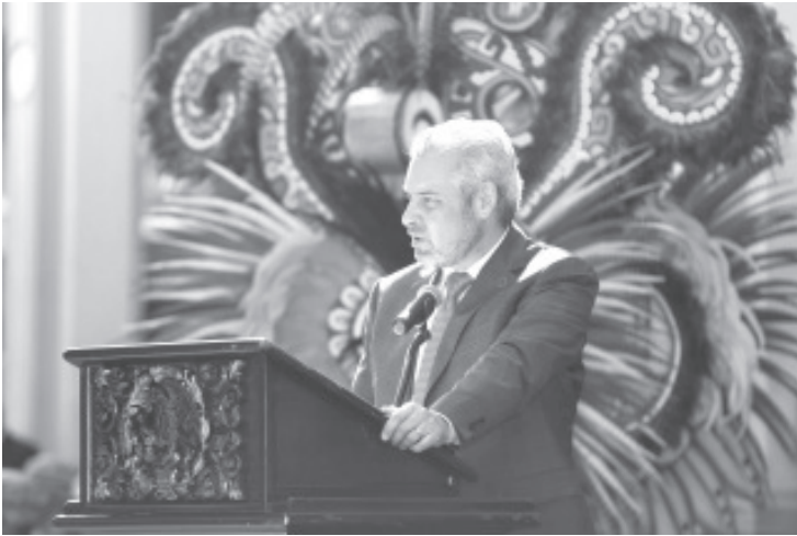
Al encabezar el acto del 198 aniversario de la municipalización de Sahuayo, el gobernador Alfredo Ramírez Bedolla, destacó que los cambios que se construyen en México tienen como base la transformación del bienestar del pueblo y de las comunidades.

- Se concentra en resolver las prolongadas deudas históricas con las regiones del estado.