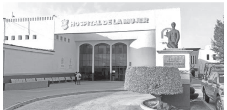
Detección temprana de cáncer de endometrio y tratamientos de miomas, realiza el Hospital de la Mujer, a través del área de ginecología endoscópica.

Este aparato tiene mucha nitidez, por consiguiente una excelente visualización, permitiéndole al médico operar con más precisión y mejores resultados en la paciente, ahorra tiempo quirúrgico e incremento de atención y procedimientos en el número de pacientes