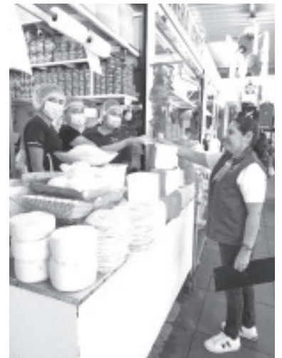
La Secretaría de Salud de Michoacán (SSM) invita a la población a consumir quesos frescos que hayan sido elaborados con leche pasteurizada o hervida, de lo contrario, pueden contener microorganismos causantes de padecimientos como la brucelosis.

Es importante también que la persona que despache al cliente tenga apariencia limpia, que use guantes desechables y cubrebocas a la hora de atender. Para ello se imparten cursos a productores y fabricantes de queso artesanal, todos relacionados con la importancia de la pasteurización y las buenas prácticas de higiene.