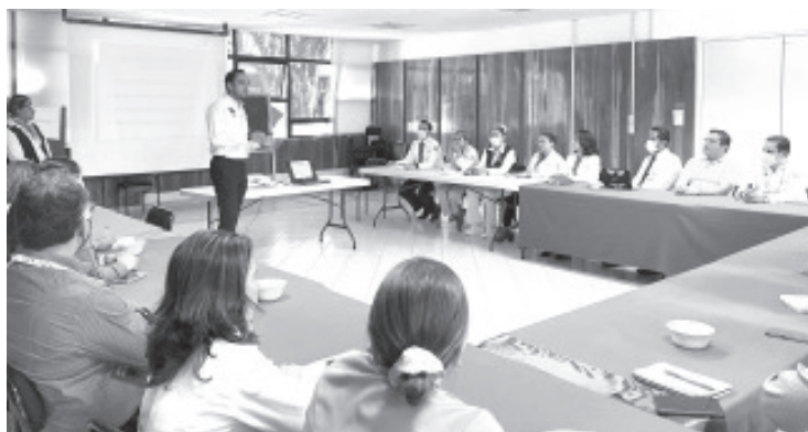
La Fiscalía General del Estado de Michoacán (FGE), a través de la Unidad Especializada de Combate al Secuestro (UECS), capacita al personal del Instituto Mexicano del Seguro Social (IMSS), para no ser víctima de estos delitos.