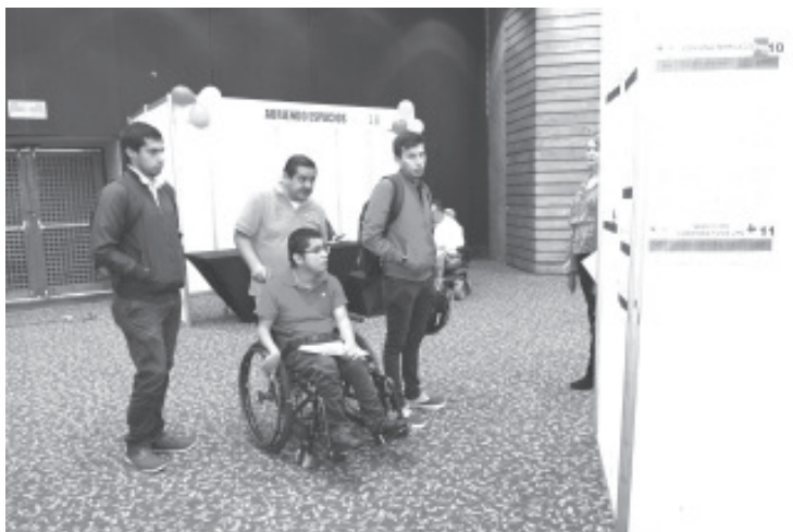
Durante 2023, la Secretaría de Desarrollo Económico (Sedeco) del Gobierno de Michoacán y el Servicio Nacional de Empleo (SNE), tienen como meta brindar atención a 2 mil 225 buscadores de empleo que enfrentan barreras para colocarse en un puesto de trabajo.

Beltrán Pacheco destacó que la estrategia opera a través de la identificación de perfiles integrales y orientación ocupacional, mediante la aplicación de instrumentos de evaluación especializados, entre los que destaca el Sistema de Muestras de Trabajo Valpar, cuyos resultados permiten orientar a las personas hacia su mejor opción y realizar actividades que faciliten su empleabilidad.