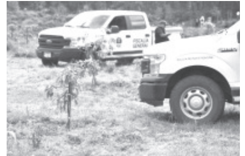
En el marco de las acciones que ha emprendido la Fiscalía General del Estado de Michoacán (FGE), en la investigación y persecución de delitos que atentan contra el medio ambiente, en lo que va del año la Fiscalía Especializada en Combate a los Delitos contra el Ambiente y la Fauna, ha asegurado siete predios relacionados en plantación ilegal de aguacate.

Morelia, Michoacán, a 15 de marzo de 2023.- En el marco de las acciones que ha emprendido la Fiscalía General del Estado de Michoacán (FGE), en la investigación y persecución de delitos que atentan contra el medio ambiente, en lo que va del año la Fiscalía Especializada en Combate a los Delitos contra el Ambiente y la Fauna, ha asegurado siete predios relacionados en plantación ilegal de aguacate.