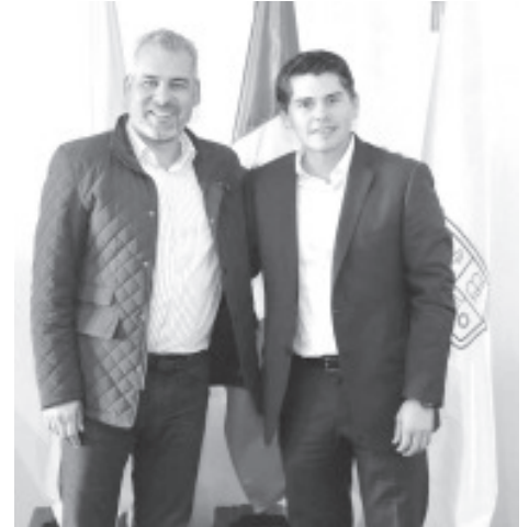
Este viernes en la capital michoacana, el gobernador Alfredo Ramírez Bedolla y el alcalde Toño Ixtláhuac, acordaron poner en marcha la inversión pública y privada más grande de la historia para Zitácuaro, con un recurso superior a los 10 mil millones de pesos.

Toño Ixtláhuac señaló que con el titular del ejecutivo estatal, acordaron fortalecer esta coordinación para generar mejores condiciones y continuar