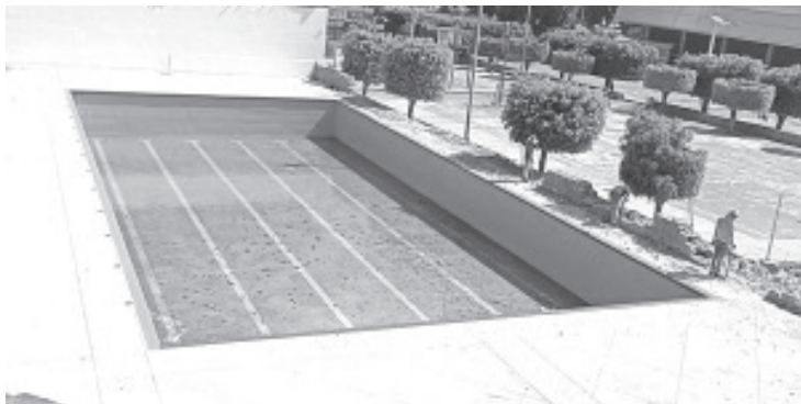
En menos de un mes, estará terminada la alberca semi olímpica que se construye en estos momentos en la Unidad Deportiva Siglo XXI, únicamente le faltan unas gradas así como la instalación del panel solar para mantener en buena temperatura el agua.