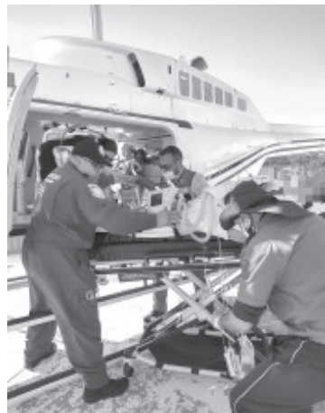
En atención oportuna a un llamado de emergencia, personal de la Secretaría de Seguridad Pública (SSP), trasladó vía aérea a una persona del sexo femenino con complicaciones de salud, del municipio de Huetamo a la ciudad de Morelia.

En caso de encontrarse en alguna situación de urgencia o si es víctima de algún ilícito, llame a los teléfonos de emergencias 911 y 089, donde el personal capacitado de la Guardia Civil atenderá con eficiencia y prontitud a sus necesidades.