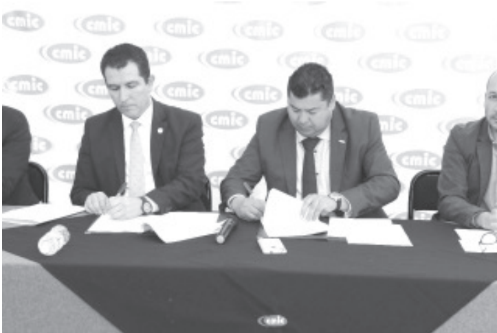
La Fiscalía Especializada en Combate a la Corrupción (FECC) firmó un convenio de colaboración con la Cámara Mexicana de la Industria de la Construcción (CMIC).

Morelia, Michoacán, a 23 de febrero de 2023.- Con el objetivo de establecer mecanismos de colaboración y coordinación institucional, para inhibir y prevenir los actos que pueden ser constitutivos de un delito por hechos de corrupción, la Fiscalía Especializada en Combate a la Corrupción (FECC) firmó un convenio de colaboración con la Cámara Mexicana de la Industria de la Construcción (CMIC).