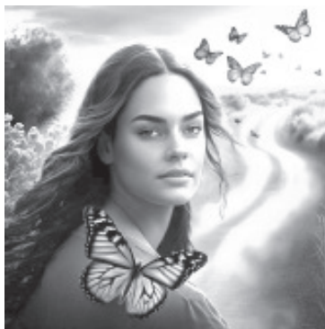
Para autoridades y profesionales del turismo colombiano, los santuarios de la Monarca son tema recurrente y motivo de hermandad con Michoacán, porque esa nación centroamericana está muy familiarizada con la materia, al ser el hogar de miles de especies de mariposas.

Con algunas variantes en El Rosario, Sierra Chincua y Senguio, las acciones comprendieron principalmente pintura, trabajos de electricidad, plomería, reparaciones en general, sustitución y/o mejoras de mobiliario en las diversas áreas comprendidas en cada parador turístico: restaurante, sanitarios, sala audiovisual, anexo, estacionamiento, dormitorios, etc.