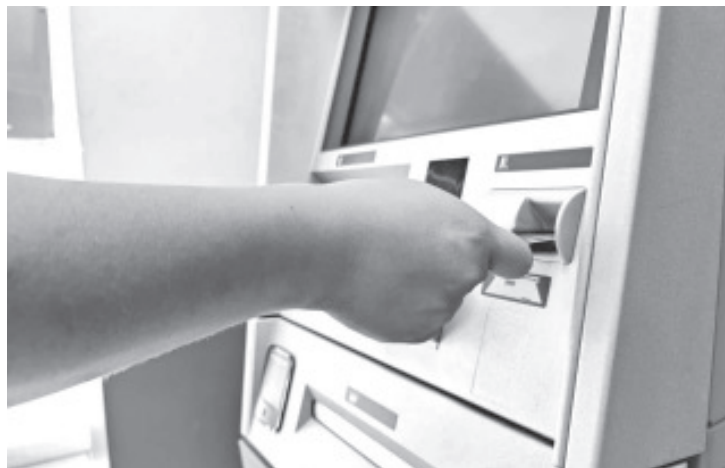
A lo largo de esta última quincena, la Secretaría de Educación del Estado (SEE) ha entregado más de 2 mil 500 tarjetas a maestras y maestros de diversas regiones que cambiaron su modalidad de cobro a la vía electrónica, para dejar atrás la opacidad en el manejo de la nómina magisterial.

Se invita a las y los docentes a consultar la página https://bit.ly/31ykQTF , donde con su CURP podrán conocer lugar, fecha y hora en la que tendrán que ir a recoger su tarjeta bancaria.