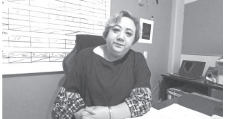
Como parte del operativo de Cuaresma de este año, la Coordinación de Protección Contra Riesgos Sanitarios (COEPRIS), mantendrá una estrecha vigilancia a la venta y consumo de todo tipo de productos de mar.