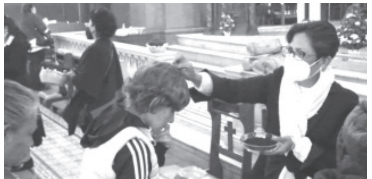
Las iglesias católicas del municipio el día de hoy llevaron a cabo la imposición de la ceniza, con lo que dieron inicio al periodo de Cuaresma.

Hay que mencionar que durante la pandemia de covid-19, para continuar con la tradición de la imposición de ceniza y perpetuar la fé, algunas parroquias idearon medidas y protocolos de seguridad, incluso colocaron en pequeñas bolsitas la ceniza, esto para motivar que grupos vulnerables se mantuvieran en casa.