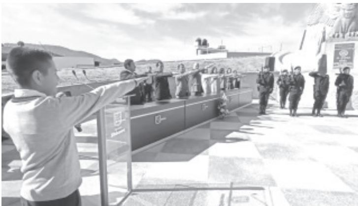
En la conmemoración a la Bandera este 24 de febrero, autoridades municipales y estudiantes de distintas escuelas honraron a este símbolo patrio con el izamiento a toda asta y un acto cívico; refrendando con ello el amor por la patria y todo lo que la representa.

acciones, con la firme convicción de que ésta, es el reflejo de una sociedad que anhela vivir en paz, armonía y seguridad", expresó.