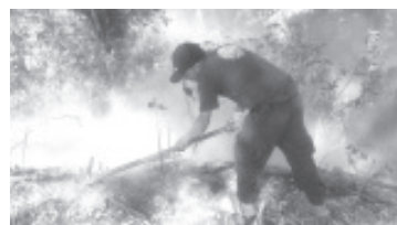
En estos últimos días se han registrado 4 incendios de pastizales, de los cuales 2 han sido en Pueblo Nuevo, El Naranjo y otro rumbo al basurero. Éstos han sido atendidos por el Cuerpo de Bomberos.

“Con la temporada se esperan temperaturas muy altas y esto reseca más el pasto y otros materiales combustibles, por lo que es importante reducir el peligro, está es una tarea de todos”, explicó.