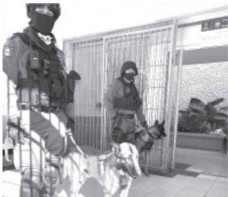
En el marco de la convocatoria de reclutamiento 2023, se cuenta con vacantes en los 11 centros penitenciarios ubicados en Morelia, Zamora, Sahuayo, La Piedad, Zitácuaro, Maravatío, Uruapan, Tacámbaro, Apatzingán y Lázaro Cárdenas.