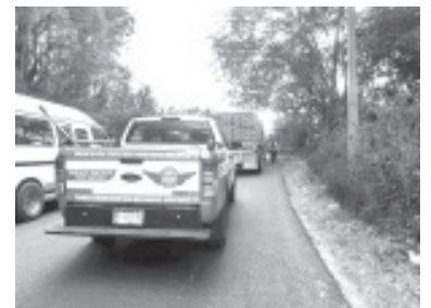
Desde la implementación del programa de apoyo mecánico de emergencias "Ángeles del Camino", este se ha convertido en un respaldo para turistas y para toda la población que transita las carreteras y caminos de esta ciudad y que por diferentes circunstancias se ven afectados con fallas mecánicas en sus vehículos.

Agregó que en caso de requerir el servicio de Angeles del Camino, se deben comunicat al número de la Secretaría de Seguridad Pública Municipal al 7151168123.