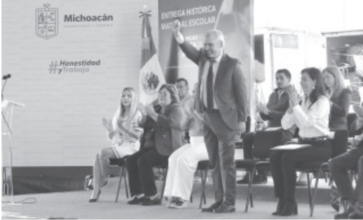
En un acto sin precedentes en Michoacán, el Gobierno del Estado hace una inversión histórica de 242 millones de pesos en materiales escolares, dio a conocer este viernes el gobernador Alfredo Ramírez Bedolla.

- La mejor versión de Michoacán es con inversión en educación para transformar, destacó el gobernador.