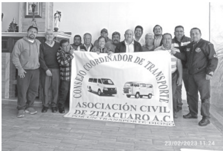
Integrado por 14 rutas que representan el 60% de todo el transporte, se conformó el Consejo Coordinador del Transporte en Zitácuaro Asociación Civil, el cual velará por mejorar el sector para beneficio de los usuarios y además atender los problemas existentes.

A esta asociación civil se pueden unir las rutas que así lo deseen, siempre y cuando estén decididos a trabajar de la mano y unir esfuerzos.