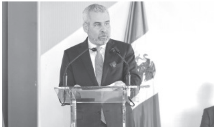
Tras celebrar la aprobación de la iniciativa de reforma al Código Penal para el combate de la extorsión en Michoacán, el gobernador Alfredo Ramírez Bedolla afirmó que la entidad se pone a la vanguardia en la ampliación del tipo penal por este delito.