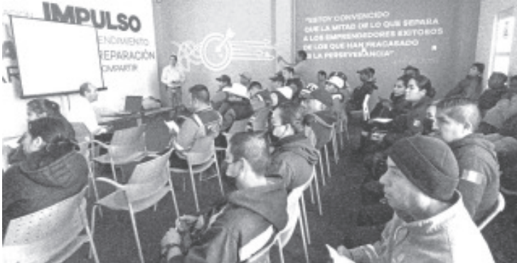
Integrantes de corporaciones de auxilio así como habitantes de comunidades, fueron capacitados por personal de la Comisión Nacional Forestal (CONAFOR) sobre el manejo del fuego. Esto como parte de las acciones enfocadas a la prevención de incendios forestales.

Invitó a toda la población en general a extremar precauciones para no generar ningún incendio, esto es posible si no se hacen quemadas agrícolas o en caso que se hagan, que sea bajo supervisión y en los horarios establecidos; también si se acude al bosque no hacer fogatas o apagarlas en su totalidad. Cualquier fuego que se detecte en el bosque se debe reportar al 911 para que se logre apagar de inmediato y no se generen grandes afectaciones.