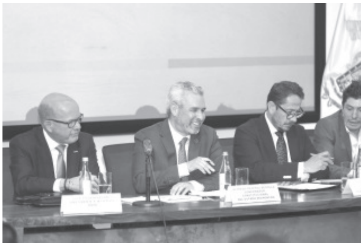
Integrantes de la Asociación Mexicana de la Industria Automotriz A.C. (AMIA), reconocieron el liderazgo del gobernador Alfredo Ramírez Bedolla para generar condiciones de seguridad, competitividad y desarrollo para la inversión en Michoacán.

Ciudad de México, 22 de febrero del 2023.- Integrantes de la Asociación Mexicana de la Industria Automotriz A.C. (AMIA), reconocieron el liderazgo del gobernador Alfredo Ramírez Bedolla para generar condiciones de seguridad,