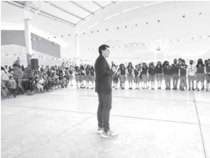
La Telesecundaria Javier Mina, de la Palma de Cedano y la primaria Francisco I. Madero, de la colonia El Moral, fueron beneficiadas por el gobierno de Toño Ixtláhuac, con infraestructura en beneficio de sus comunidades educativas.

-En gira de trabajo, el alcalde inauguró infraestructura en escuelas de educación básica de Zitácuaro.