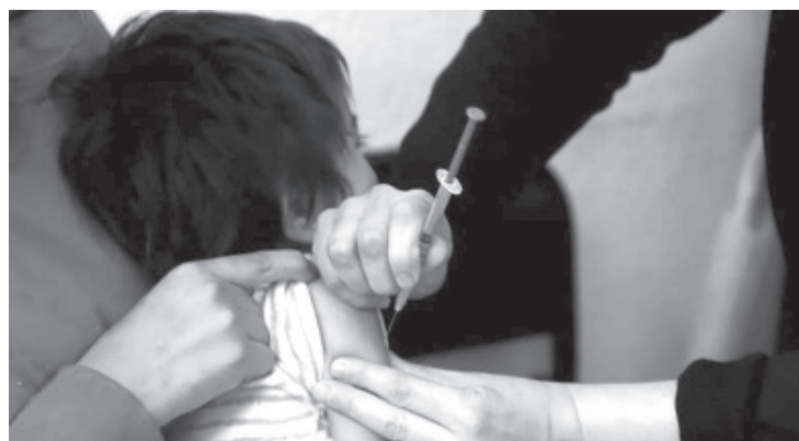
La Secretaría de Salud de Michoacán (SSM) invita a la población a llevar a vacunar a los niños menores de 5 años, a su centro de salud más cercano para aplicarles los biológicos marcados en la Cartilla Nacional de Salud.

Para solicitar las vacunas no es necesario realizar cita, solo presentarse a su unidad más cercana, con su cartilla de salud y si no cuenta con ella la puede tramitar en el lugar.