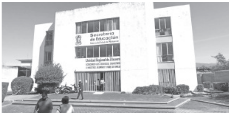
La Dirección de Servicios Regionales Educativos buscará que jóvenes de nivel medio superior y superior, realicen su servicio social en escuelas de nivel básico para que fomenten la lectura en los alumnos.

Como titular de Servicios Regionales Educativos, manifestó que la meta es que los niños sean lectores de cuentos, de historias y de novelas; que poco a poco por su cuenta lean y no les aburra.