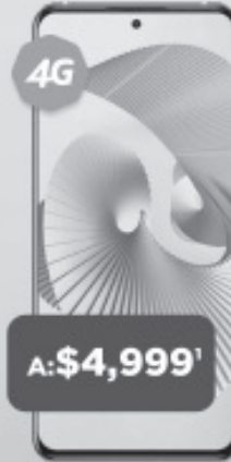
ZTE Axon 30