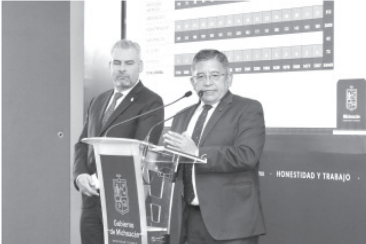
Como parte de los resultados de la estrategia de coordinación interinstitucional en materia de seguridad, Michoacán presenta una tendencia a la baja en el delito de homicidio doloso con una reducción del 10.9 por ciento durante el mes de enero.

Michoacán, 1 de febrero del 2023.-* Como parte de los resultados de la estrategia de coordinación interinstitucional en materia de seguridad, Michoacán presenta una tendencia a la baja en el delito de homicidio doloso con una reducción del 10.9 por ciento durante el mes de enero.