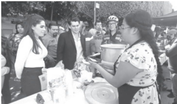
Con gran aceptación de la población, comenzó la Feria del Tamal, en el pasillo del jardín central que se encuentra sobre la calle 5 de mayo.