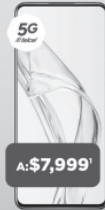
ZTE Axon 30 5G