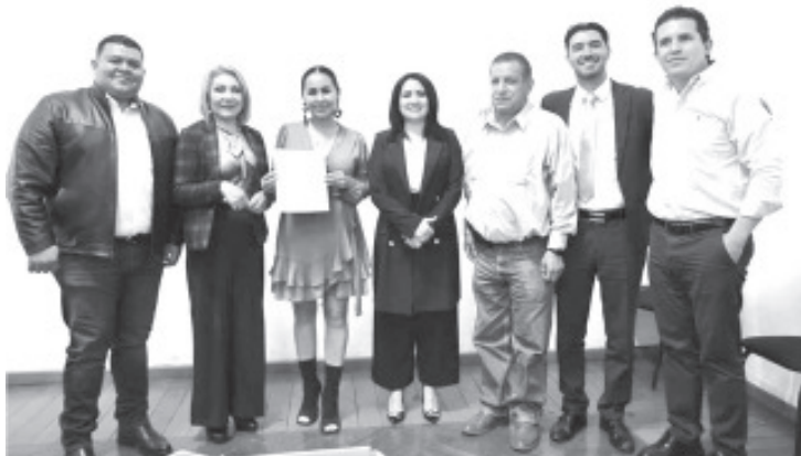
La diputada por el Distrito de Zitácuaro refrendó su compromiso y de la comisión de coadyuvar con la población y municipios, para la solución de conflictos territoriales, por lo que continuarán dando puntal revisión a los casos que se tienen en la entidad.

“El que las y los normalistas tengan aulas y espacios dignos, nos ayudará a que el día de mañana nuestras niñas y niños tengan a docentes con las capacidades necesarias para brindar un mejor servicio, concluyó.