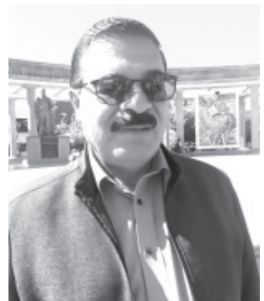
Con el objetivo de contribuir a la economía familiar, el Sistema de Agua Potable y Alcantarillado (SAPA) decidió ampliar hasta el 28 de febrero el programa del pago anual.

Los usuarios del SAPA pueden llevar a cabo su pago en las oficinas centrales del organismo que están en la Calzada Melchor Ocampo, en Presidencia y además en Espacio Emprendedor, a espaldas del teatro Juárez.