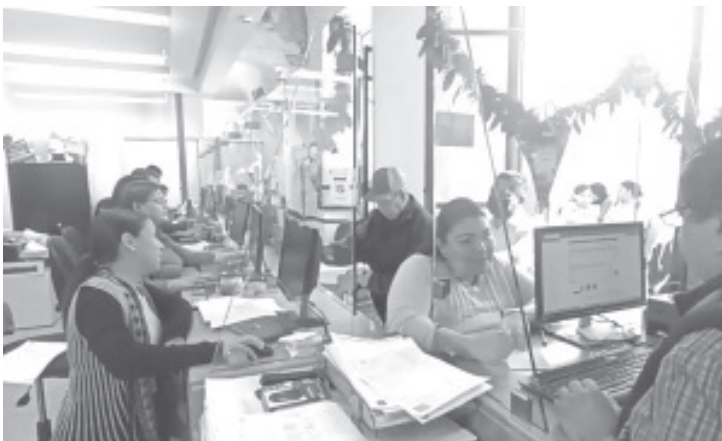
Hasta el momento el 41% de los ciudadanos que tienen una propiedad han pagado su impuesto predial correspondiente al 2023.

Invitó a los ciudadanos a cumplir con el pago de sus impuestos, tales como el predial, licencias, perpetuidades del panteón entre otros. Además de las cajas de Ingresos Municipales, existen otras opciones de pago, entre ellas está la opción de hacerlo en línea, en los puntos de gobierno y en Espacio Emprendedor.