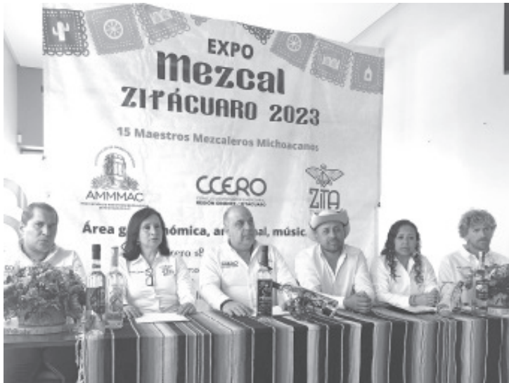
El próximo 18 y 19 de febrero se llevará a cabo la Expo Mezcal en la que participarán 15 productores de diferentes puntos de la entidad. La actividad será en el rancho San Cayetano

- Participarán 15 productores de diferentes puntos de Michoacán