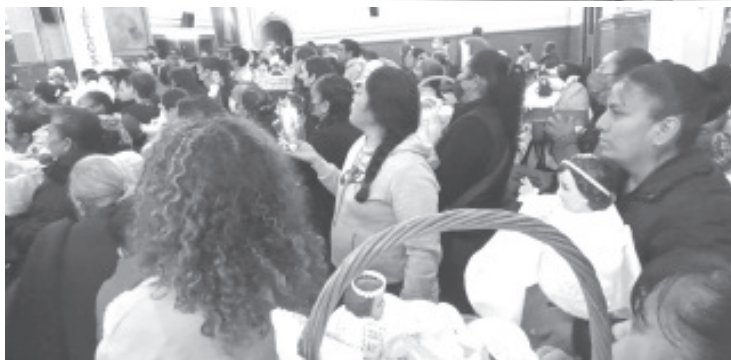
La costumbre data del siglo VI una vez que se comenzó a celebrar la fiesta de Purificación de la Virgen María y la presentación del niño Dios en la iglesia. Además de consumir tamales en las reuniones del 2 de febrero después de acudir a la iglesia se acostumbra a servir variedades de atole.