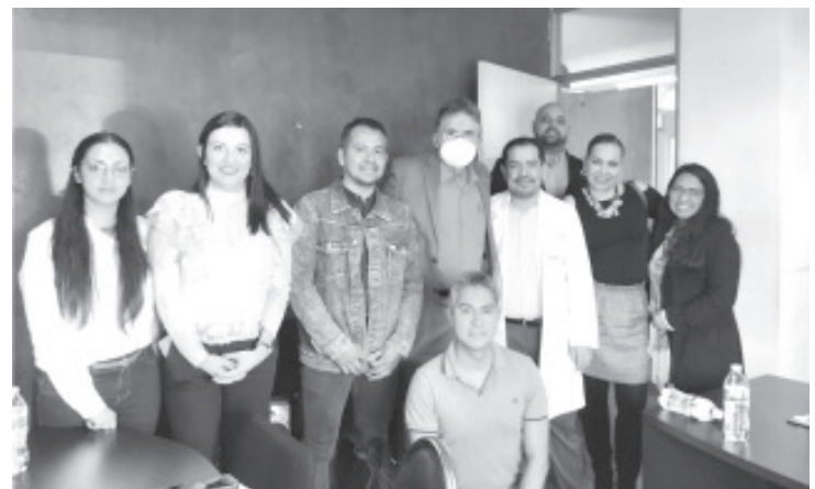
Avanza la organización para llevar a cabo la firma de convenio entre la Secretaría del Bienestar de Michoacán (Sedebi) y la Secretaría de Salud (SSM) para poner en marcha el Programa para Mujeres con Cáncer de Mama o Cervicouterino Cuidadoras de Menores.

Es importante destacar que las personas que quieran conocer los lineamientos del Programa del Bienestar, pueden solicitar más información al teléfono 443 688 2539, de 9 a 16 horas.