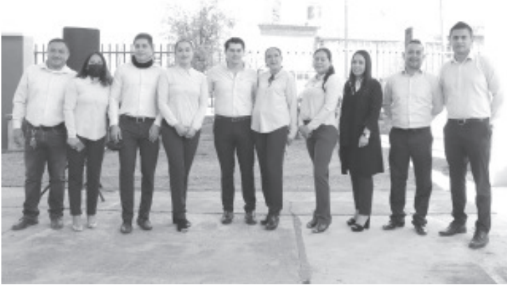
En su mensaje, el presidente municipal resaltó que el objetivo primordial de esta acción, es que los estudiantes no padezcan más de las inclemencias del tiempo y, por ende, se dignifica su plantel.

"En el #GobiernoDeSoluciones seguimos trabajando para que nuestras niñas y niños, tengan mejores espacios educativos", agregó el edil.