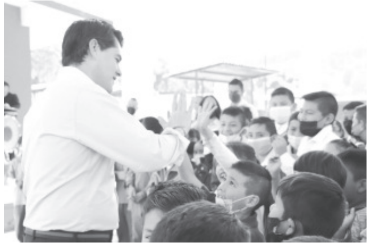
"En el #GobiernoDeSoluciones seguimos trabajando para que nuestras niñas y niños, tengan mejores espacios educativos", agregó el edil.