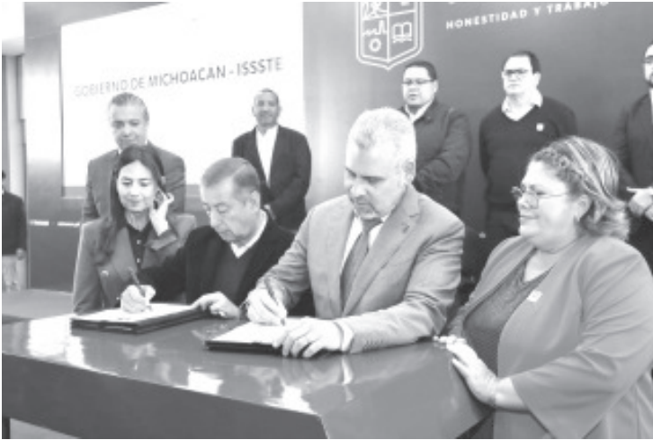
El Gobierno de Michoacán y el Instituto de Seguridad y Servicios Sociales de los Trabajadores del Estado (ISSSTE) firmaron este martes un convenio a favor de alrededor de 5 mil 300 maestras y maestros estatales pensionados, quienes podrán acceder a servicios de salud.

El gobernador y el director del Instituto firman convenio en beneficio de maestras y maestros pensionados