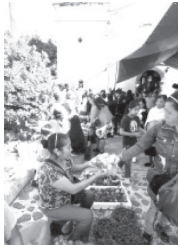
Con gran aceptación de niños, jóvenes y adultos; habitantes de la tenencia de San Felipe los Alzati llevan a cabo el “trueque” para intercambiar productos sin la utilización del dinero.