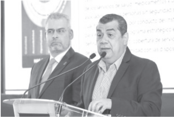
Durante el 2023 y para el beneficio de la población sin seguridad social, el IMSS-Bienestar invertirá 870 millones de pesos en el equipamiento de 22 hospitales y 336 centros de salud en el estado.

- Además, se reforzará la plantilla laboral con mil 393 médicos y enfermeras.