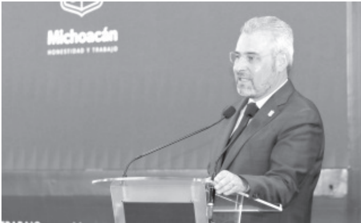
El gobernador Alfredo Ramírez Bedolla reconoció la gran participación de maestras y maestros en el Taller Intensivo de Formación Continua para Docentes y Directivos, que contó con más de 50 mil actores educativos, quienes trabajan para fortalecer la Nueva Escuela Mexicana (NEM) en Michoacán.

- El gobernador destacó la gran participación que hubo en el Taller Intensivo de Formación Continua