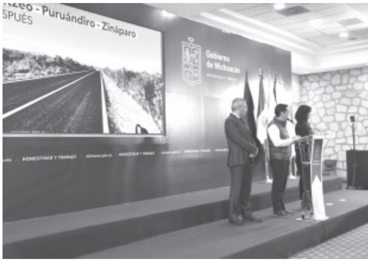
Con una inversión de 602 millones 508 mil 507 pesos, la Secretaría de Comunicaciones y Obras Públicas (SCOP) del Gobierno de Michoacán rehabilitó 806 kilómetros de la red carretera estatal durante el 2022.

Morelia, Michoacán, 25 de enero del 2023.- Con una inversión de 602 millones 508 mil 507 pesos, la Secretaría de Comunicaciones y Obras Públicas (SCOP) del Gobierno de Michoacán rehabilitó 806 kilómetros de la red carretera estatal durante el 2022, se informó en la conferencia semanal del gobernador Alfredo Ramírez Bedolla.