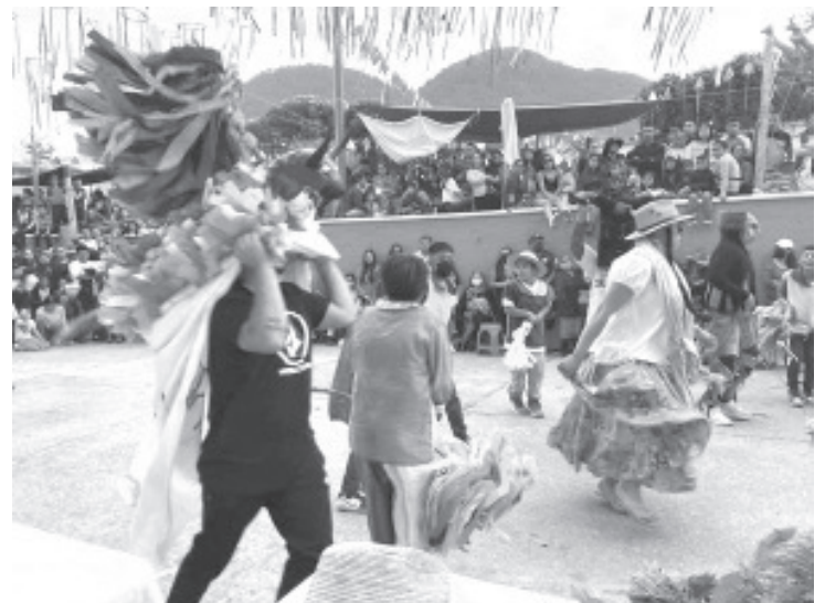
Desde el municipio de Zitácuaro, la Tenencia de Zirahuato de los Bernal, invita a su Carnaval del Torito 2023, que se llevará a cabo del 17 al 20 de febrero próximos.