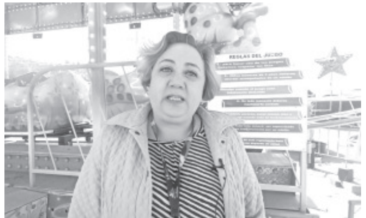
Para cuidar la salud de los visitantes, la COEPRIS realizará operativos permanentes en la feria de Zitácuaro, principalmente en todos los puestos donde se prepara y se vende comida.

Durante la capacitación, los comerciantes refrendaron las medidas de higiene que tienen que extremar durante la feria, además recibieron del personal de la COEPRIS material como cubrebocas, y lo necesario para desinfectar frutas y verduras.