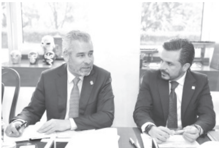
El gobernador Alfredo Ramírez Bedolla informó que ya se encuentra listo el plan de pago para cubrir este mismo año, el adeudo que se tiene con el Instituto Mexicano del Seguro Social (IMSS).

Pérez Bernal, agregó que todos los días atienden de 10 a 15 reportes de diferentes apoyos, esto mantiene todas las unidades ocupadas y en uso, lo que las desgasta en todos los sentidos. Por lo tanto, invitó a los ciudadanos a ayudarlos, si los ven en la calle les den lo poco que pueden, o bien pueden acudir a la base que se encuentra en Avenida Revolución.