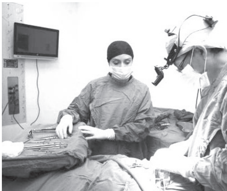
Con el trabajo del Consejo Estatal de Trasplantes (Coetra), se han podido realizar en Michoacán un total de 230 donaciones altruistas de órganos, así como 137 de córnea; ello desde el 2003 en que se implementó este programa en la entidad.

Para solicitar información sobre cómo formar parte de la lista de espera, llama sin costo al 800 201 78 61 y 62, o acude al Coetra que se encuentra en el Hospital General "Dr. Miguel Silva", en Morelia.