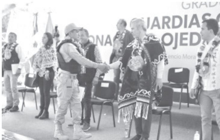
Durante la ceremonia de graduación de la primera generación de guardias comunales de Donaciano Ojeda y Crescencio Morales, del municipio de Zitácuaro, el mandatario expresó que en el proceso de transformación y respeto a los derechos indígenas, la entidad avanza a paso firme para dar justicia social e histórica a este sector.

a los derechos indígenas, la entidad avanza a paso firme para dar justicia social e histórica a este sector.