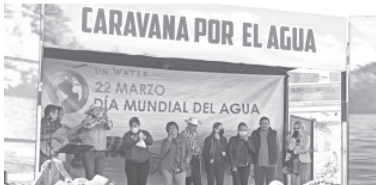
Con el objetivo de hacer conciencia en la población para cuidar el agua y que no falte en los hogares, la estrategia denominada "Caravanas por el Agua", llegaron este martes a Zitácuaro.