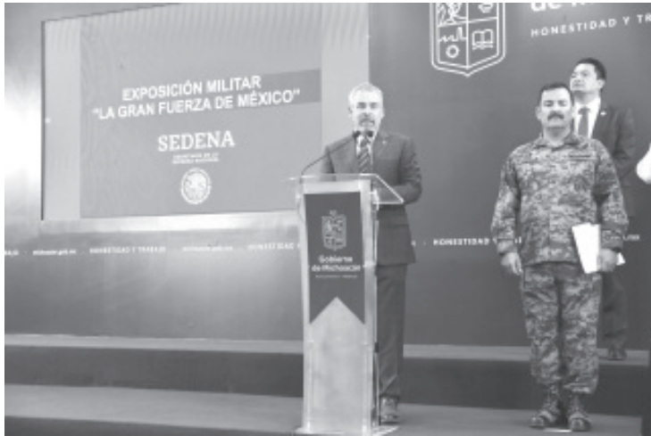
La Secretaría de la Defensa Nacional, a través de la Comandancia de la 21/a. Zona Militar, informó que, en coordinación con el Gobierno de Michoacán, el Ejército y Fuerza Aérea Mexicanos, abrirá sus puertas al público en general la magna exposición “La Gran Fuerza de México” en la ciudad de Morelia.

Morelia, Michoacán, 23 de enero de 2023.- La Secretaría de la Defensa Nacional, a través de la Comandancia de la 21/a. Zona Militar, informó que, en coordinación con el Gobierno de Michoacán, el Ejército y Fuerza Aérea Mexicanos, abrirá sus puertas al público en general la magna exposición “La Gran Fuerza