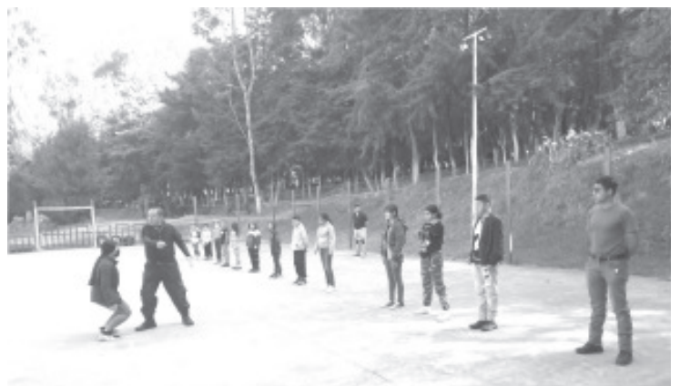
Con la participación de 22 menores de edad, la "Brigada Alfa" dependiente de Seguridad Pública arrancó actividades el pasado sábado.