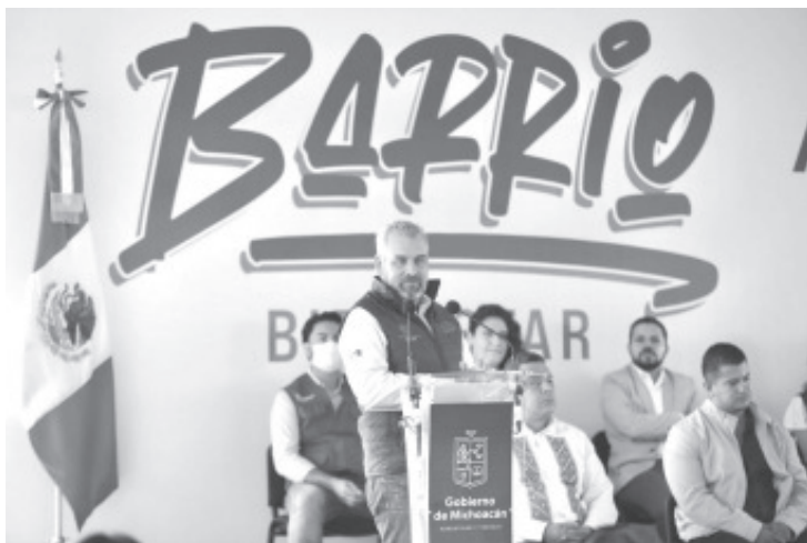
La estrategia Barrio Bienestar de la Secretaría del Bienestar en Michoacán (Sedebi) será una de las líneas para avanzar en la prevalencia de la paz en el estado, a través del Fondo para el Fortalecimiento para la Paz (Fortapaz) 2023.

Se atenderá la violencia de manera focalizada, llegando a las 100 colonias con alto índice delictivo de Michoacán