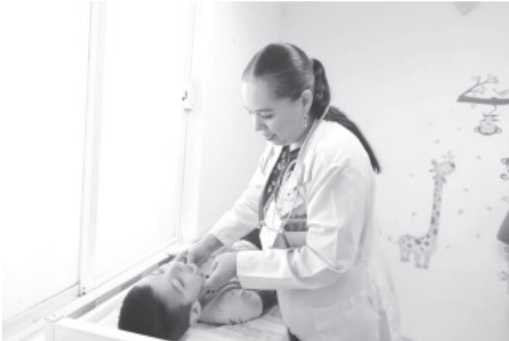
La fiebre, pérdida de peso, la falta de apetito, palidez, fatiga, sangrados o moretones continuos e inexplicables son algunos de los principales síntomas de cáncer infantil que nos pueden ayudar a detectar a tiempo este padecimiento en nuestros menores.

Morelia, Michoacán, 14 de enero del 2023.- La fiebre, pérdida de peso, la falta de apetito, palidez, fatiga, sangrados o moretones continuos e inexplicables son algunos de los principales síntomas de cáncer infantil que nos pueden ayudar a detectar a tiempo este padecimiento en nuestros menores.