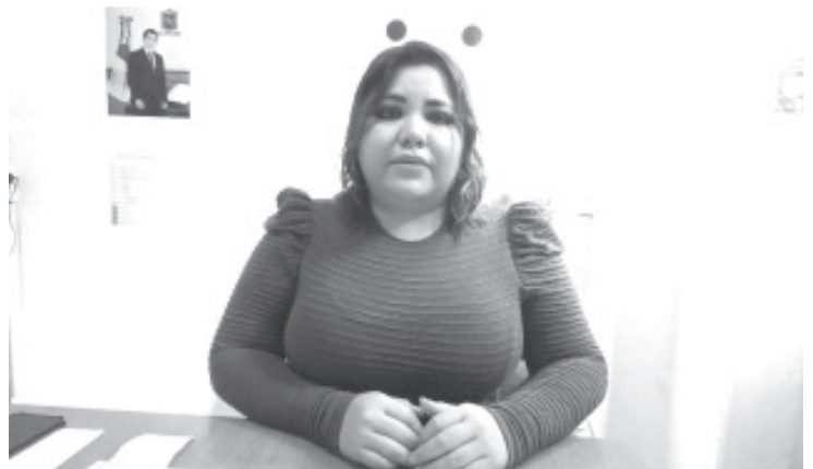
En el mes de marzo de este año, podría inaugurarse lo que será la clínica de hemodiálisis en la colonia La Joya, actualmente presente un avance considerable. Hay que mencionar que el banderazo de los trabajos se realizó en el mes de octubre del 2022, y originalmente se tenía previsto que terminara en el mes de diciembre, pero no fue posible.