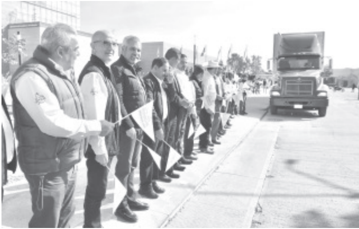
La Asociación de Productores y Empacadores Exportadores de Aguacate de México (APEAM), en compañía del gobernador de Michoacán, Alfredo Ramírez Bedolla, dieron el banderazo de salida a los envíos de las primeras 64 mil 101 toneladas de aguacate rumbo al Super Bowl LVII.

- Salen las primeras 64 mil 101 toneladas al mercado estadounidense