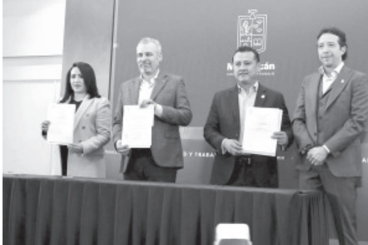
El gobernador Alfredo Ramírez Bedolla anunció el Programa Único de Actualización del Padrón de Concesionarios y del Título de Concesión del Servicio Público de Transporte, hecho que se realizará por primera vez en 20 años.