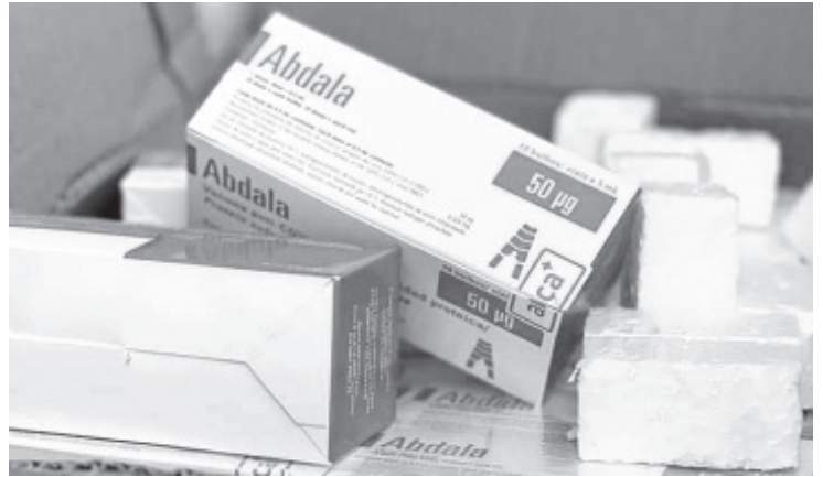
A partir del 5 de enero ya se encuentra disponible en el centro de salud la vacuna contra el covid-19 de procedencia cubana 'Abdala' para los mayores de 18 años. Para el rango de 5 a 11 años de edad, hay en existencia el biológico Pfizer kids. Así lo señala la Delegada Regional de Bienestar, Emma Rivera Camacho.