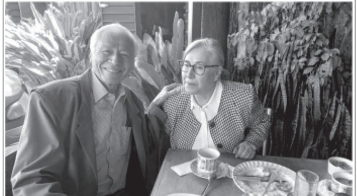
Que recientemente cumplió años y recibió felicitaciones de su esposa y familia.