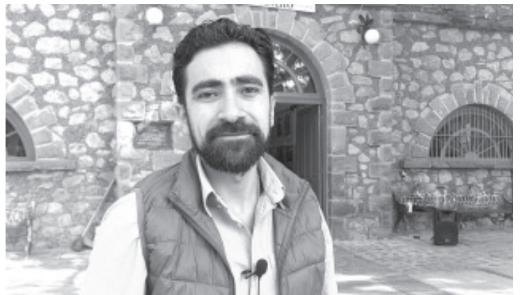
Con el objetivo de incluirlos en actividades del Gobierno Municipal y de promocionarlos en municipios vecinos, la Dirección de Cultura creará un catálogo de artistas locales de todas las disciplinas.

Los artistas interesados en ser parte de catálogo, pueden acudir a la Casona de la Estación, en un horario de 8:00 de la mañana a 4:00 de la tarde, dejar sus datos y con ellos se hará una ficha técnica y un demo para promocionarlo. Este mismo catálogo estará disponible para todos los ciudadanos, en caso que requieran un mariachi, un trío, un grupo o incluso un taller.