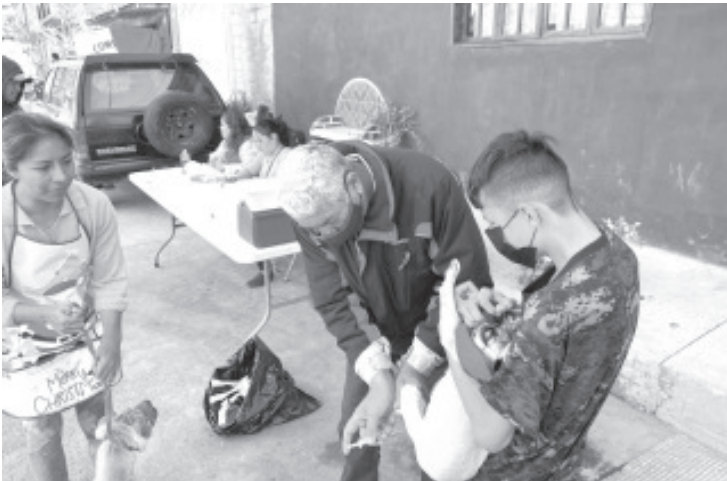
A partir de este jueves, la oficina de Protección Animal retomó las jornadas de vacunación antirrábica para perros y gatos, esto con el objetivo de evitar enfermedades en las mascotas.

Invitó a las escuelas interesadas en este tipo de pláticas, acercarse y solicitar la presencia del personal encargado del programa en su escuela.