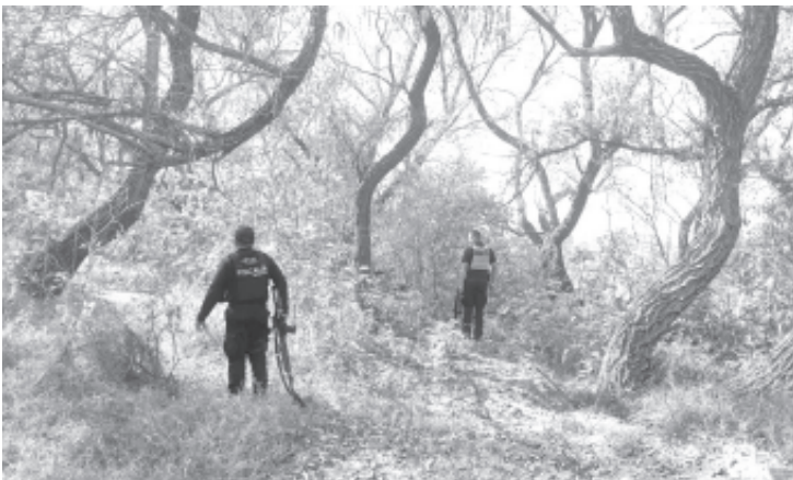
En 2022, la Fiscalía General del Estado de Michoacán (FGE) localizó con vida a mil 89 personas que, en su momento, fueron reportadas como desaparecidas en diferentes puntos de la entidad.

La FGE reitera su compromiso de dirigirse bajo los principios de honestidad y profesionalismo, para garantizar a las víctimas de un caso de desaparición, la protección de su integridad, asimismo, recuerda a la ciudadanía la importancia de denunciar de manera inmediata y coadyuvar con información importante que favorezca la búsqueda de las personas.