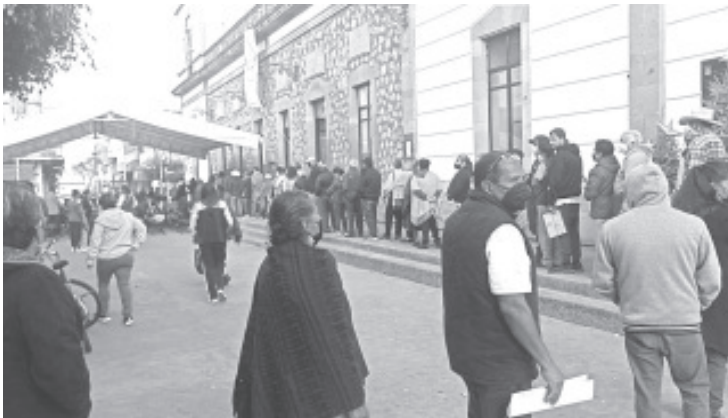
A partir del 4 del presente mes, todos los días la oficina de Ingresos municipales atiende a más de 300 personas que acuden a realizar el pago puntual de sus impuestos.

Agregó que durante el mes de enero se descuenta el 10% a los ciudadanos, en febrero el 5%, por lo que es importante que cubran estos impuestos a tiempo para evitar multas y gastos de ejecución.