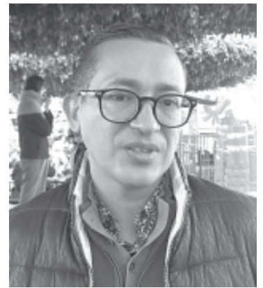
Los municipios del oriente ya están viviendo la sexta ola de covid 19, entre ellos se encuentra Zitácuaro que tiene activos 21 casos confirmados pero que podrían ser 210 porque la gente no está acudiendo a realizarse pruebas.

En covid-19, actualmente circula la variante centauros que son síntomas leves pero se espera otra variante que es la Kraken que está ingresando.