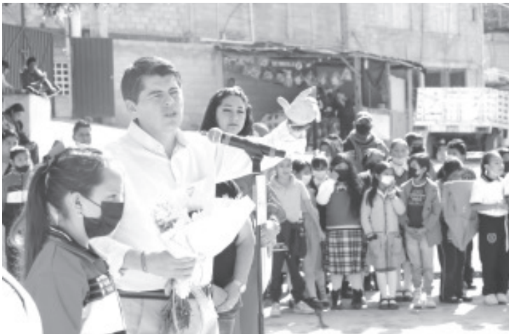
Éste día el Presidente Toño Ixtláhuac, visitó diferentes espacios del municipio en el que constató las condiciones de las peticiones realizadas por los habitantes.

Es así que recorriendo el municipio y saludando a los zitacuarenses es como brindamos #SolucionesEnGrande a las necesidades más importantes de la demarcación.