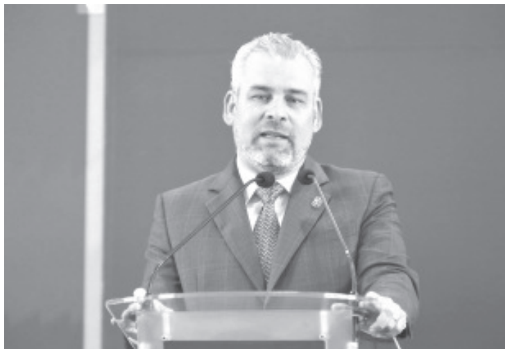
En coordinación con los 19 perfiles ciudadanos del Consejo Estatal de Migración, se construye el Programa Especial de Migración de Michoacán que tendrá vigencia hasta el 2027, destacó el gobernador Alfredo Ramírez Bedolla.

“Con este programa atenderemos las diferentes líneas de acción que involucra la migración, alineadas al PND y al Pladiem y con ello conjugar a la atención de una migración ordenada, segura, legal y voluntaria”, finalizó.