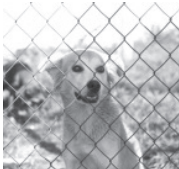
En el marco de las acciones implementadas para la investigación y persecución del maltrato animal, durante el 2022, la Fiscalía General del Estado de Michoacán (FGE) rescató 83 ejemplares de diversas especies, víctimas de maltrato y crueldad animal.

De igual forma, el pasado 5 de diciembre, se llevó a cabo un operativo en coordinación con la Procuraduría Federal de Protección al Ambiente (Profepa), en la que se aseguraron 50 ejemplares de vida silvestre -dos localizados sin vida- consideradas especies en