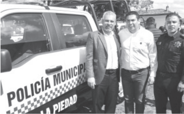
El gobernador Alfredo Ramírez Bedolla afirmó que este año será prioridad incrementar el número de policías municipales certificados a través del Fondo de Fortalecimiento para la Paz (Fortapaz).

- Además se atenderán principalmente los municipios que no participaron en 2022.