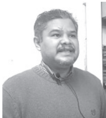
Más de 300 jóvenes de la clase 2004 y remisos, buscan la liberación de su cartilla militar. Para ello hicieron su solicitud durante el 2022 y ahora les corresponde darle seguimiento.

Los jóvenes que faltan para presentarse deben presentar cartilla de identidad militar, credencial de elector, lapicero tinta negra, cubrebocas y gel antibacterial así como atender las indicaciones.