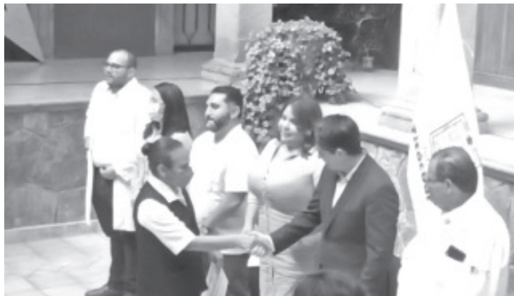
Autoridades municipales y representantes del sector salud, reconocieron a las enfermeras y enfermeros por la labor que hacen en quienes requieren su cuidado.