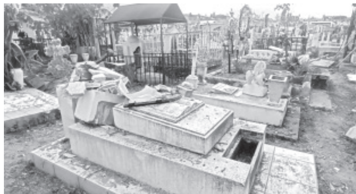
Por el derribo de un árbol en la fila 12, han sido afectadas varias tumbas que están alrededor, hasta el momento suman 15 las que presentan algún daño.