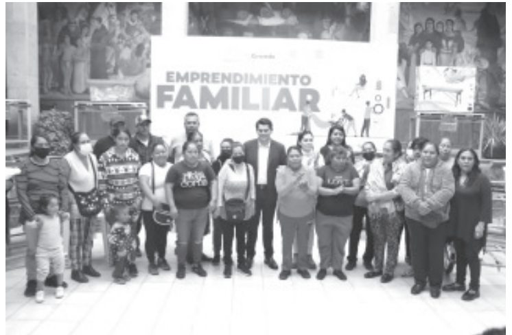
Como parte del programa Emprendimiento Familiar, por medio del cual se apoya con equipo a las solicitudes de los proyectos productivos de los zitacuarenses que desean ampliar o iniciar una actividad económica, el alcalde Toño Ixtláhuac entregó 35 iniciativas para autoempleo.

Esta ocasión, se destinaron artículos como: parrillas de gas, calentadores, molinos para tortillerías, triciclos comerciales, insumos para tiendas de abarrotes, entre otros, con el propósito de que las familias zitacuarenses cuenten con una fuente de empleo y generen economía.