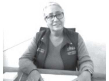
El próximo 21 del presente mes, habrá entrega masiva de tarjetas bienestar a todas las personas que solicitaron el beneficio de la Pensión Para el Bienestar de las Personas Adultas Mayores, que aplica a los mayores de 65 años.

Para revisar si llegó su tarjeta o el estatus de su solicitud, pueden acudir a las oficinas de bienestar que se ubican en Ocampo casi esquina con Altamirano,