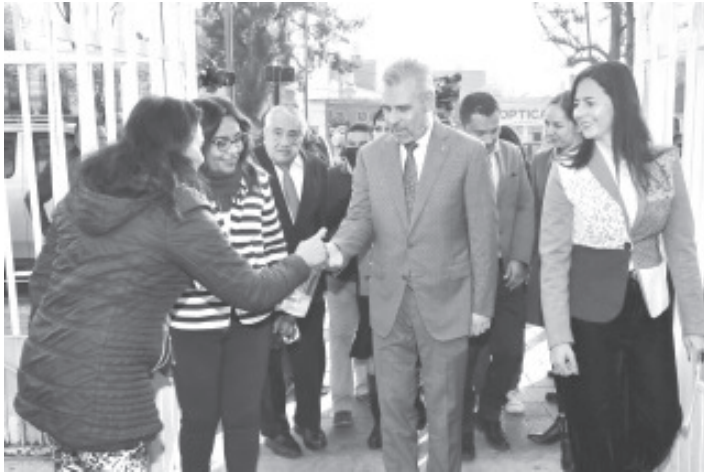
El gobernador Alfredo Ramírez Bedolla reiteró que en este año se reforzará el sector educativo con equipo e infraestructura y se respetarán los derechos laborales de las y los docentes.