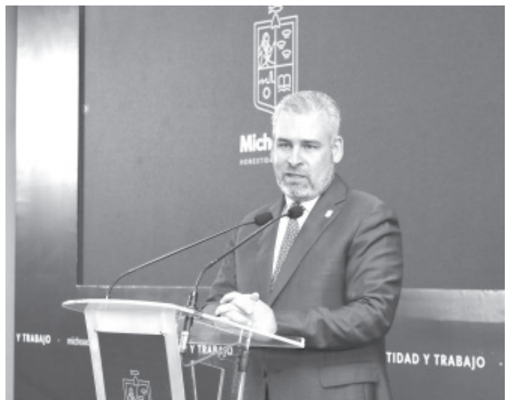
El gobernador Alfredo Ramírez Bedolla buscará reactivar los vuelos comerciales de Lázaro Cárdenas al Aeropuerto Internacional Felipe Ángeles (AIFA) a través de Mexicana de Aviación.

Esta estrategia se sumaría al objetivo de recuperar la conexión aérea de Lázaro Cárdenas con otras localidades económicas del país, así como de potenciar la mayor atracción de inversiones para la generación de empleos y mejora a la productividad de la región.