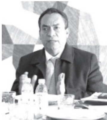
El Fiscal General, Adrián López Solís, destacó los resultados obtenidos con relación al cumplimiento de órdenes de aprehensión por el delito de homicidio doloso en el 2022.

El documento, también coloca a la FGE en el segundo lugar en cumplimiento de acuerdo reparatorios; primer lugar en reparación del daño en sede ministerial; y noveno en tasa de resolución contra tasa de congestión, todo