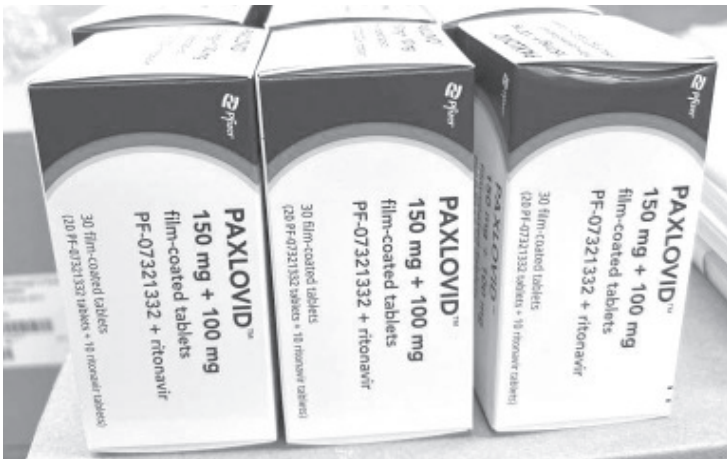
Michoacán continúa posicionado como el estado número 31, en cuanto a casos positivos por COVID-19 (sólo antecedido por Chiapas).

Morelia, Michoacán, 21 de diciembre del 2022.- Michoacán continúa posicionado como el estado número 31, en cuanto a casos positivos por COVID-19 (sólo antecedido por Chiapas).