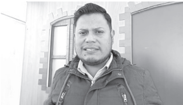
El próximo 6 de enero de 2023, es la fecha límite para que jóvenes del municipio registren para participar en el Certamen de Belleza "Reyna Monarca" de la fiesta del 5 de febrero.

Agregó que el evento será el día 20 de enero a las 18:00 horas en el teatro Juárez y se premiarán los primeros tres lugares: $10,000 pesos para el primer lugar, $6,000 pesos para el segundo lugar y $4,000 pesos para el tercero.