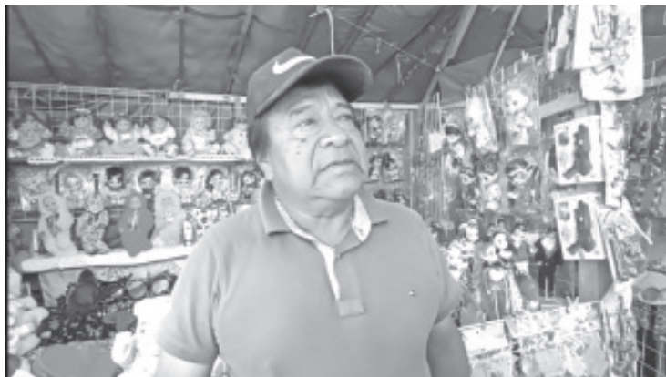
Integrantes de la Unión de Jugueteros "5 de enero" se instalaron sobre la plaza del Jardín Constitución a partir del 20 de diciembre y ya se encuentran ofertando todo tipo de regalos, para todos los gustos y las distintas economías.