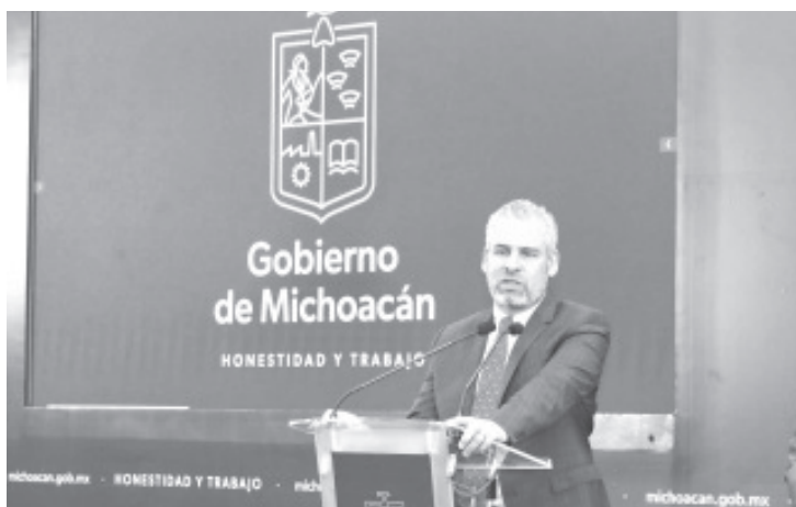
De manera responsable y por primera vez en muchos años, el Gobierno de Michoacán cerrará este 2022 con estabilidad en sus finanzas, así lo aseguró el gobernador Alfredo Ramírez Bedolla.

Están garantizados los pagos a todos los trabajadores del sector público: Bedolla