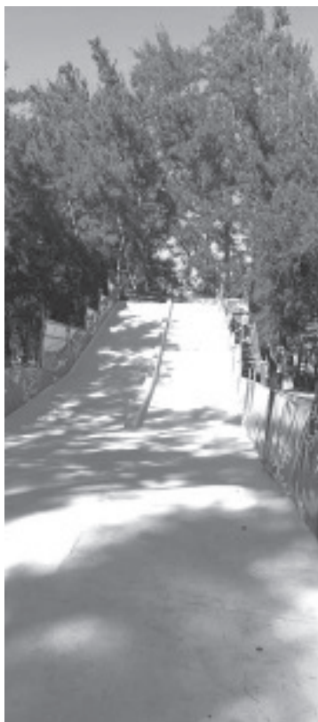
Entre los diversos atractivos de la Villa Navideña instalada en Ceconexpo, los que registran un mayor número de usuarios son el tobogán y la pista de hielo, mismos que ofrecen servicios de manera gratuita.

Por otra parte, la Secretaría de Turismo del Estado subrayó que estos atractivos, así como los que instaló el ayuntamiento moreliano, se muestran como una invitación al disfrute familiar de los espacios públicos durante esta temporada. Puso en relieve que al igual que en la capital michoacana, se observan adornos festivos instalados en pueblos y ciudades de todo Michoacán.