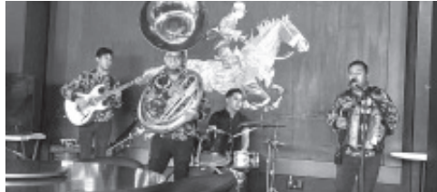
¡FELICITACIONES! AL GRUPO MUSICAL VERSÁTIL. T.Z. NORTEÑA Que se PRESENTO En el REST-BAR. "CARRILLO COCINA Y BRAZAS" Con Interpretaciones y canciones del gusto de los comensales.