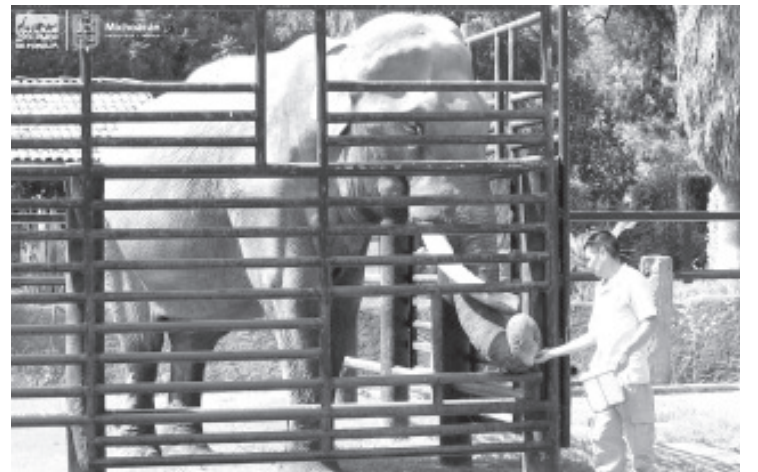
En esta temporada vacacional podrás aprovechar al máximo el Parque Zoológico "Benito Juárez", ya que, hasta el 8 de enero, el recinto extenderá su horario para cerrar a las 18:00 horas.

El Zoológico de Morelia se ubica en Calzada Juárez S/N, en la colonia Félix Ireta.