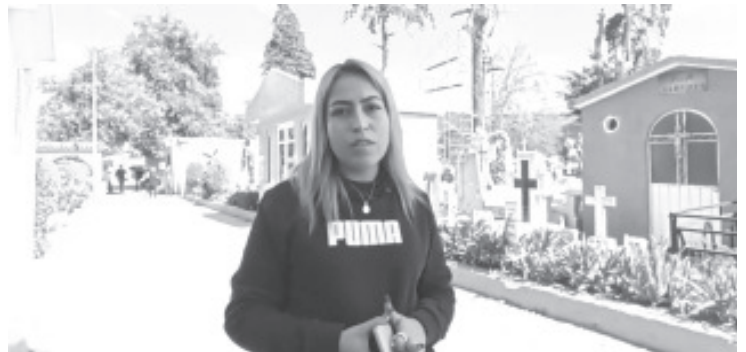
Un total de 4 árboles del Panteón Municipal San Carlos están en riesgo de colapsar, esto se debe a que ya son muy antiguos, están secos y tienen una altura considerable.