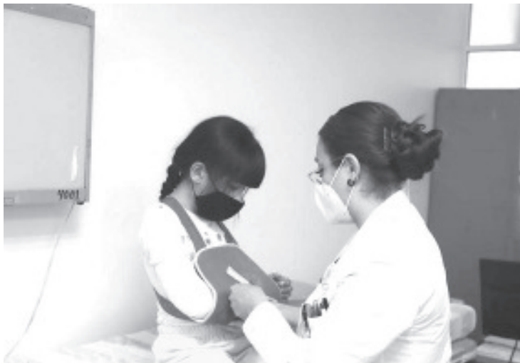
Durante el 2022, el Hospital Infantil de Morelia “Eva Sámano de López” otorgó un total de 77 mil 822 consultas externas y atendió 5 mil 444 urgencias médicas (2 mil 651 en 2021), siendo diciembre el mes con más pacientes registrados.

Los menores que más fueron atendidos en el área de 1 a 4 años, pero el Infantil también ofreció más de 290 mil estudios de laboratorio, para dar atención a 34 mil 584 pacientes, además que se realizaron casi 20 mil estudios de rayos X.