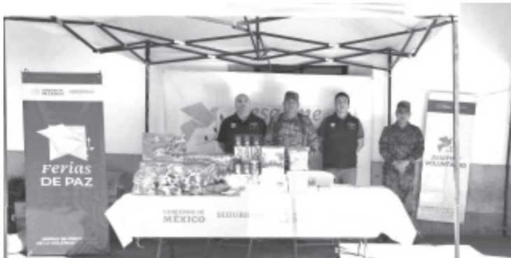
Como resultado del desarme voluntario realizado en los municipios de Morelia y Zamora, del 15 al 17 de diciembre pasados, el Secretariado Ejecutivo del Sistema de Seguridad Pública informó que se alcanzó el número más alto de armas canjeadas en los últimos 10 años.