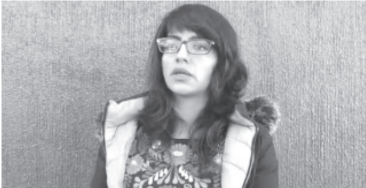
Durante las fiestas de fin de año, está prohibida la quema de llantas y de basura, esto debido a que generan mucha contaminación.

- Dicha disposición está contemplada en el reglamento