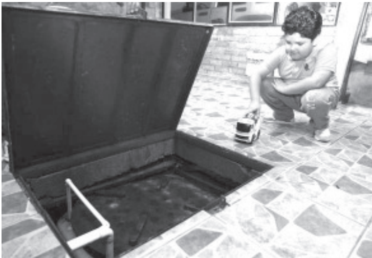
La Secretaría de Salud de Michoacán (SSM) exhorta a la población a prevenir ahogamientos en el interior del hogar, cerrando aljibes y cisternas con tapa metálica y candado, ya que los accidentes con los niños ocurren en cuestión de segundos.

Es recomendable explicar a los infantes que no deben entrar ni forzar el acceso a estos receptáculos de agua, ya que los ahogamientos ocurren en un instante; de ahí el exhorto a que los infantes estén bajo vigilancia de un adulto y con ello evitar un siniestro lamentable.