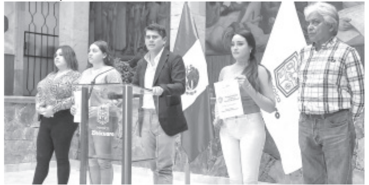
Con el objetivo de tomar en cuenta la opinión de la población para el embellecimiento del centro histórico, los días 13, 14 y 15 de diciembre se estarán llevando a cabo foros de participación ciudadana.