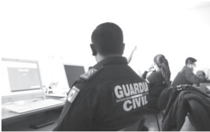
Con la finalidad de atender, analizar y prevenir delitos virtuales, el (IEESSPP) brindará el curso de "Atención ciudadana a delitos cibernéticos y análisis de incidentes", dirigido a la Policía Cibernética de la Guardia Civil.