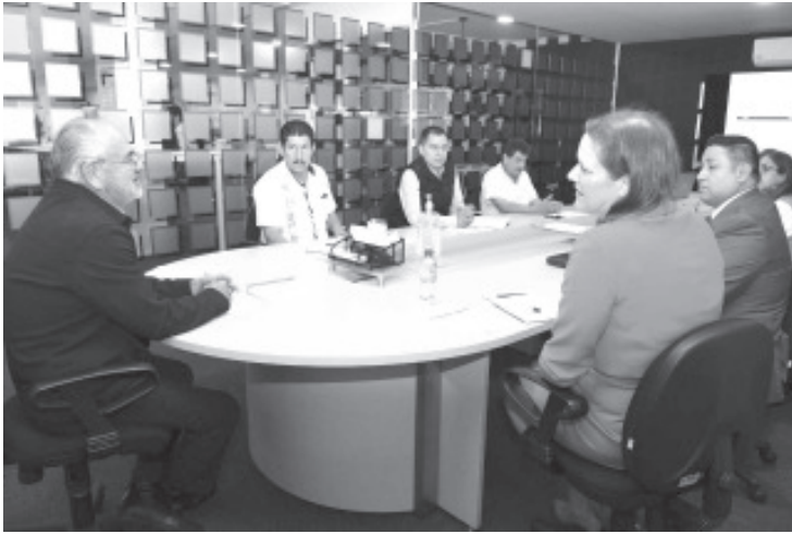
Tanto el personal de la Sedeco como los representantes de la embajada de los Estados Unidos de Norteamérica acordaron mantener la comunicación constante y la retroalimentación.

Morelia, Michoacán, 7 de diciembre del 2022.- Con el propósito de sumar esfuerzos para impulsar una migración laboral ordenada y respetuosa de los derechos de las y los trabajadores, así como para prevenir fraudes relacionados con ofertas de empleo,