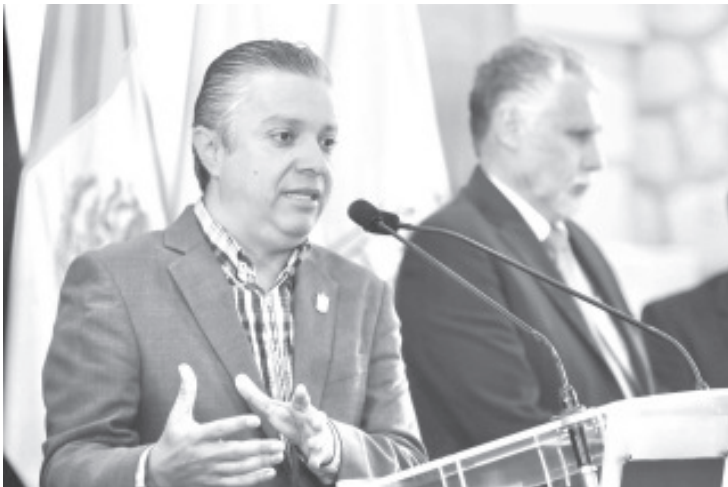
El Gobierno de Michoacán supervisará el uso óptimo y real de la maquinaria y del equipo que compró con la intención de apoyar a 78 municipios en la ejecución de obra pública.