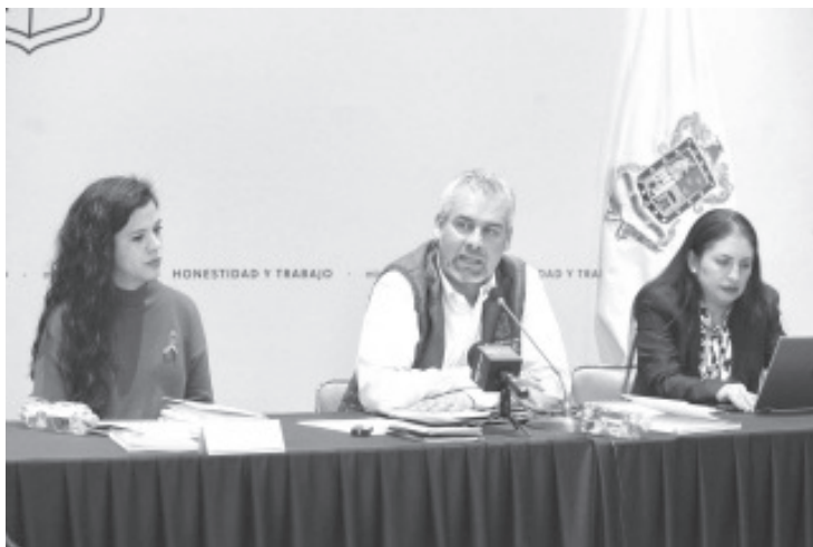
Alfredo Ramírez Bedolla anunció que para el 2023, a través del Fortapaz, se destinarán recursos a 14 municipios con declaratoria de Alerta de Violencia de Género contra las Mujeres.