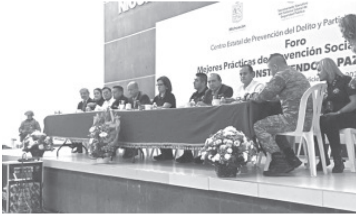
Con la participación de instituciones de seguridad de los tres niveles de gobierno, el Centro Estatal de Prevención del Delito y Participación Ciudadana llevó a cabo en Zitácuaro el foro “Mejores prácticas de prevención social de vida Construyendo la Paz”.

- Estuvieron presentes instituciones de seguridad de los tres niveles de gobierno