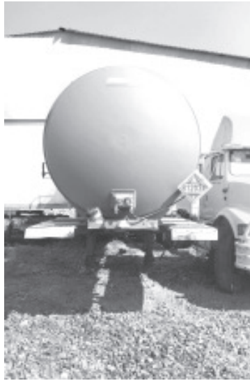
La Fiscalía General de la República (FGR) en Michoacán, inicio carpeta de investigación en contra de quien o quienes resulten responsables de un delito en materia de Hidrocarburos.

El vehículo fue asegurado y puesto a disposición del Ministerio Público Federal en Morelia, quién solicitará las investigaciones y dictámenes correspondientes a elementos de la Policía Federal Ministerial, así como a Peritos de la institución, a fin de integrar la carpeta de investigación.