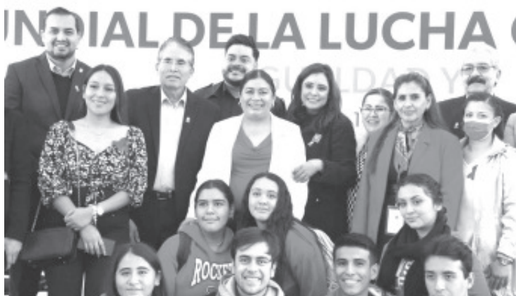
Bajo el lema "Igualdad Ya", la Secretaría de Salud de Michoacán (SSM) conmemoró el Día Mundial de la Lucha contra el SIDA.

En caso de tener sospecha de haber adquirido el VIH, se puede acudir a los centros de salud o al Capasits, donde se les atenderá de manera confidencial, se aplicará la prueba rápida para determinar si son portadores e iniciar el tratamiento si el resultado es positivo.