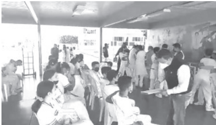
Un total de 1650 alumnos de la escuela Secundaria Federal No 1 Nicolás Romero de, fueron vacunados contra la influenza estacional por parte del sector salud.

- Durante horario escolar se vacunan 1650 alumnos contra la influenza estacional