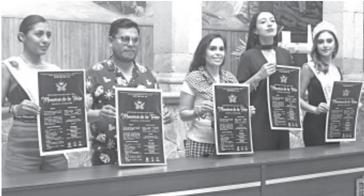
Todas las jóvenes del municipio pueden registrarse para participar en el certamen de belleza la Reyna Monarca del 5 de febrero.

- Inscripciones del 2 de diciembre al 6 de enero de 2023 - La ganadora tendrá la oportunidad de representar al municipio