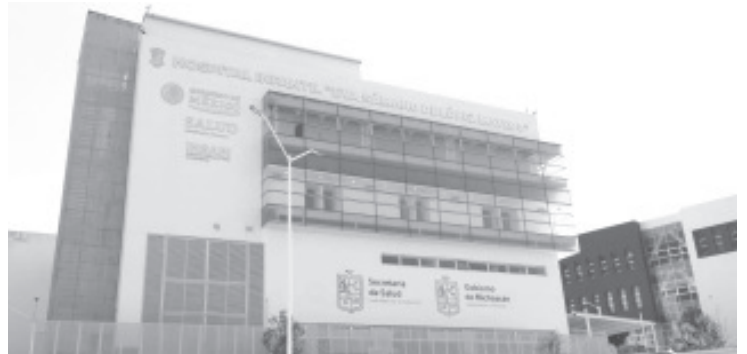
Hospital Infantil de Morelia "Eva Sámano de López Mateos" abrió la convocatoria a médicos pediatras para cursar las nuevas subespecialidades de medicina crítica pediátrica, neonatología y oncología pediátrica.

Para mayores informes sobre el programa académico y documentación para medicina crítica pediátrica, los interesados pueden llamar al teléfono 44 33 18 38 68 o mandar un correo electrónico a las direcciones liliolrom@hotmail.com y dra.paolalh@gmail.com.