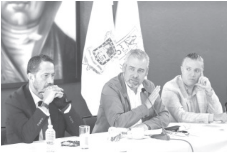
Representantes de las diferentes cámaras y asociaciones civiles de la industria en Michoacán, manifestaron su confianza a la propuesta de presupuesto que presentó el gobernador Alfredo Ramírez Bedolla para el ejercicio fiscal 2023.

- El gobernador destacó proyectos de infraestructura para el desarrollo