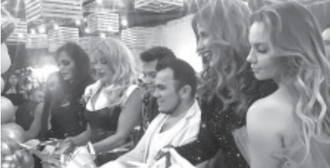
FUNGIERON Como MADRINAS De la INAUGURACIÓN Del "BAR La No.30" y de TANNING SPA. Las Actrices Lorena Herrera, Raquel Bigorra, Michelle Viethy y Carmen Campuzano.