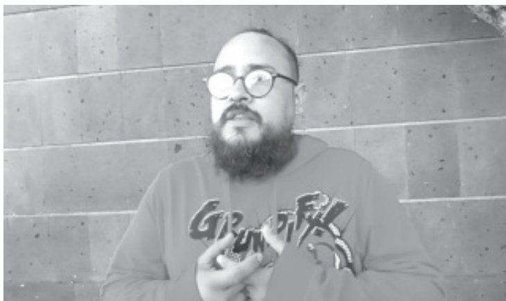
En el Festival Artístico Estatal de la DGETI, llevado a cabo del 14 al 16 de noviembre de forma virtual; el CBTIS 162 fue ganador del primer lugar en las disciplinas de declamación y teatro.

Además de participar en declamación y teatro, también hubo representantes en dibujo, canto, creación literaria y oratoria.