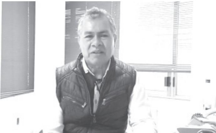
A través de la Feria de Empleo Navideña, realizada este miércoles, buscadores de empleo tuvieron la oportunidad de vincularse con aquellas empresas que tienen vacantes disponibles.