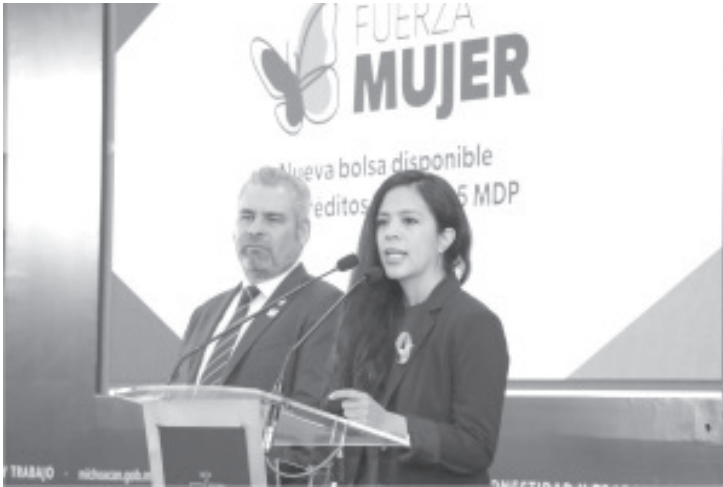
El Programa Integral de Financiamiento Fuerza Mujer, que impulsa el Gobierno de Michoacán para el fortalecimiento de la autonomía económica de las michoacanas, puso a disposición 160 millones de pesos para financiar proyectos con créditos de hasta 5 millones de pesos.

Morelia, Michoacán, 28 de noviembre del 2022.- En el marco de del Día Internacional de la Eliminación de la Violencia contra las Mujeres, el Programa Integral de Financiamiento Fuerza Mujer, que impulsa el Gobierno de Michoacán para el fortalecimiento de la autonomía económica de las michoacanas, puso a disposición 160 millones de pesos para financiar proyectos con créditos de hasta 5 millones de pesos.