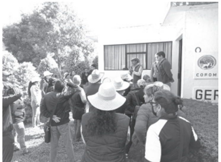
El objetivo de esta capacitación, que se realiza a través del Departamento de Investigación y Cultura Forestal, es que las y los profesores implementen acciones de reforestación en sus escuelas.