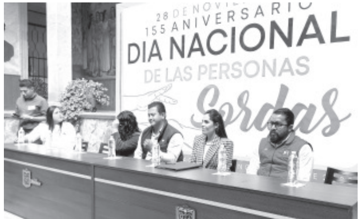
Con el objetivo de hacer visible este sector ante las autoridades y que se respeten sus derechos, a nivel local se conmemoró el Día Nacional de las Personas Sordas.

Explicó que en el próximo ejercicio fiscal, seguirá trabajando por destinar más recursos que continúen mejorando las condiciones de vida de las tenencias y sus manzanas. Convocó a continuar trabajando organizadamente y cerca de su administración.