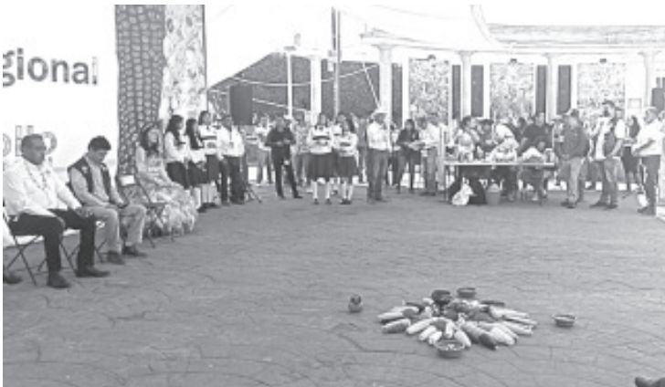
Durante la realización de la IX edición de la Feria del Maíz; organizaciones pidieron a campesinos resistir el ingreso de granos transgénicos y conservar la semilla nativa, de ser posible hacer un banco de semillas. Esto para estar preparados a las próximas crisis alimentarias que se vendrán.

Durante la actividad los presentes pudieron recibir orientación de primera mano de especialistas a través de conferencias magistrales, y participar en el intercambio de semillas.