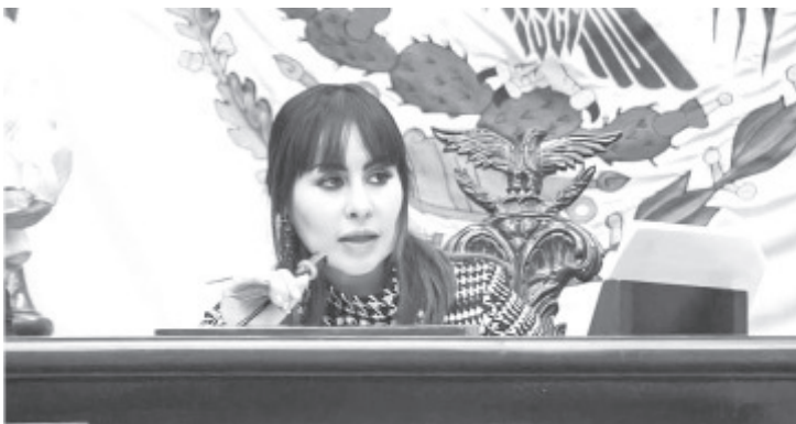
Es necesario redoblar los esfuerzos a favor de cielos azules, los que garantizan un mejor futuro pues son condición necesaria para un desarrollo sustentable y sano, apuntó la diputada Gloria Tapia Reyes, presidenta de la Comisión de Fortalecimiento Municipal de la LXXV Legislatura

Gloria Tapia recordó que la Agenda 2030 para el Desarrollo Sostenible reconoce en su hoja de ruta para lograr el desarrollo sostenible, la protección del medio ambiente y la prosperidad para todos, que reducir la contaminación atmosférica es importante para el cumplimiento de los Objetivos de Desarrollo Sostenible.