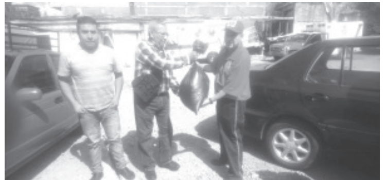
El cuerpo de bomberos de Zitácuaro continúa con su colecta anual de ropa de invierno.

Exhortó a la población a apoyar, ya que todos en su casa tienen ropa o una cobija en buen estado que ya no utilizan y ésta puede abrigar a una persona que si lo necesita.