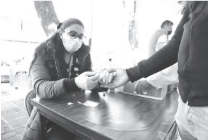
Por el Día Nacional de la prueba de detección de VIH y el Día Mundial de la Lucha contra el SIDA, la Secretaría de Salud de Michoacán (SSM) realizó, el pasado 24 y 25 de noviembre, una jornada para la detección oportuna, en la que se aplicaron 2 mil 244 pruebas rápidas.

- Durante la jornada gratuita de detección que se llevó a cabo el 24 y 25 de noviembre.