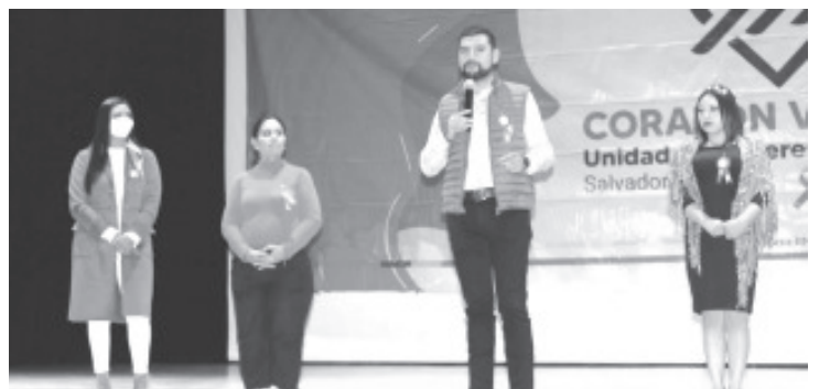
En el marco del Día Internacional de la Violencia contra la Mujer que se recordó el 25 del mes, el Presidente del Partido de la Revolución Democrática (PRD), Octavio Ocampo Córdova, se pronunció a favor del respeto a los derechos humanos de las mujeres, niñas y adolescentes.

Nuestra solidaridad con las mujeres que han sufrido algún tipo de violencia, a las familias de quienes han enfrentado un feminicidio, "más allá de las cifras que se pudieran manejar de feminicidios, el día de hoy nos toca sensibilizarnos y reafirmar nuestro compromiso a favor del respeto a los derechos de las mujeres".