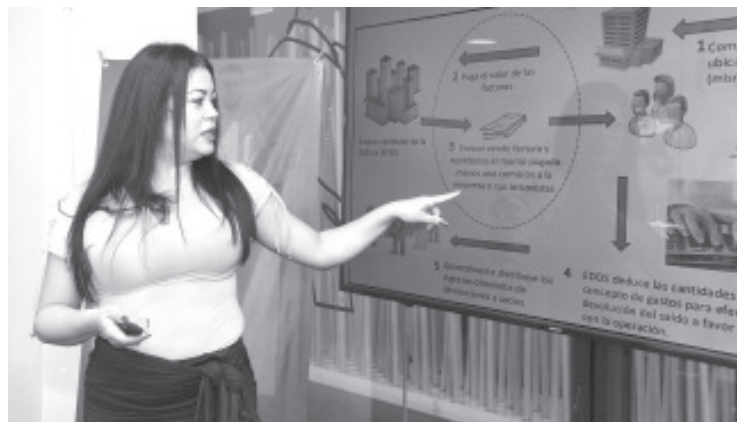
La clasificación de delitos como son administrativos, de bajo impacto y de alto impacto; expuso que a partir de la reforma 2020, los delitos fiscales cometidos son clasificados como de alto impacto.

La charla Defraudación fiscal está disponible en la página de Facebook de Espacio Emprendedor, en el enlace https://www.facebook.com/espacioemprendedor.mx/videos/511796434328243 .