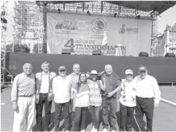
El gobernador Alfredo Ramírez Bedolla, acompañó al Presidente Andrés Manuel López Obrador, durante su mensaje por el aniversario del inicio de la Cuarta Transformación, en el zócalo de la Ciudad de México.

Ciudad de México, 27 de noviembre del 2022.- El gobernador Alfredo Ramírez Bedolla, acompañó al Presidente Andrés Manuel López Obrador, durante su mensaje por el aniversario del inicio de la Cuarta Transformación, en el zócalo de la Ciudad de México.