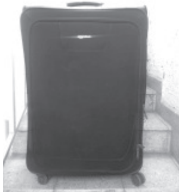
En menos de 24 horas, elementos de la Secretaría de Seguridad Pública (SSP), lograron recuperar en Zitácuaro, un maletín con equipo de ginecología que había sido presuntamente robado en la ciudad de Toluca.

Para la SSP, su objetivo primordial es cuidar del patrimonio de las y los ciudadanos, por ello trabaja día a día sin bajar la guardia y exhorta a denunciar cualquier acto a las líneas telefónicas 911 o 089.