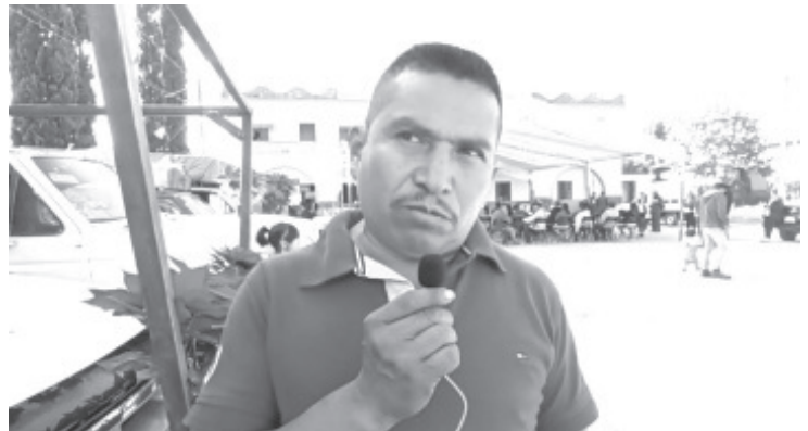
Este año, los insumos necesarios para la producción de la flor de nochebuena se elevaron desde un 100 a un 300%. Esto afectó el trabajo y además ha ocasionado que tengan que subir el precio de esta planta en el mercado.

Para ello ya varios salen a vender fuera a otros estados, también están pendientes en sus viveros, listos para colocar su planta; otros desde hace meses ya tienen apartado un porcentaje de su producción.