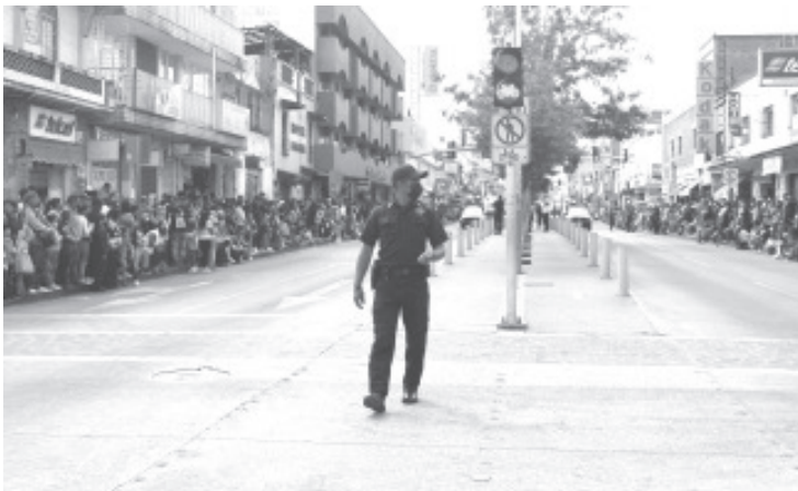
Con saldo blanco, concluye tradicional desfile Cívico-Deportivo, conmemorativo al CXII Aniversario de la Revolución Mexicana, el cual estuvo coordinado por 180 elementos de la Secretaría de Seguridad Pública.

La Revolución Mexicana fue el movimiento armado iniciado en 1910 para terminar la dictadura de Porfirio Díaz y que culminó con la promulgación de la nueva Constitución Política de 1917, siendo ésta la primera a nivel mundial en reconocer las garantías sociales y los derechos laborales colectivos.