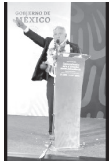
Ante la constante quema de vehículos y cierres de carreteras en Michoacán por parte de estudiantes y egresados normalistas, el presidente de México Andrés Manuel López Obrador hizo un llamado a los familiares de éstos a darles un jalón de orejas.

"Con el pago en efectivo hay intermediarios y viene con piquete de ojos", finalizó Andrés Manuel López Obrador.