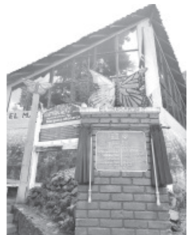
Se devolvió la placa alusiva a la inscripción de bien de Patrimonio Mundial de la UNESCO.

No tiro basura ni cubrebocas dentro del santuario.