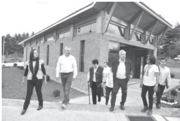
En la inauguración de la Universidad del Bienestar "Benito Juárez," con sede en Áporo, el gobernador Alfredo Ramírez solicitó al presidente Andrés Manuel López Obrador reconocer como Universidad Nacional a la Universidad Michoacana de San Nicolás de Hidalgo (UMSNH),