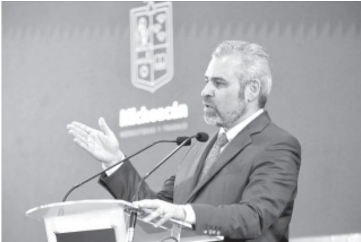
El gobernador Alfredo Ramírez Bedolla resaltó que el paquete fiscal de la Ley de Ingresos y Presupuesto de Egresos 2023, que este día se entrega al Congreso del Estado, no contempla nueva deuda ni impuestos

Morelia, Michoacán, 21 de noviembre del 2022.- El gobernador Alfredo Ramírez Bedolla resaltó que el paquete fiscal de la Ley de Ingresos y Presupuesto de Egresos 2023, que este día se entrega al Congreso del Estado, no contempla nueva deuda ni impuestos por lo que será una propuesta equilibrada, eficiente y sin déficit.