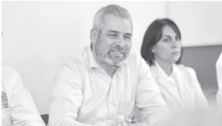
El gobernador Alfredo Ramírez Bedolla, comentó que el paquete económico 2023 mantiene una visión municipalista porque prioriza inversión de infraestructura, seguridad y desarrollo.

Morelia, Michoacán, 22 de noviembre del 2022.- En la propuesta de presupuesto que entregó el Ejecutivo estatal al Congreso local, se contempla una bolsa de 2 mil 619 millones