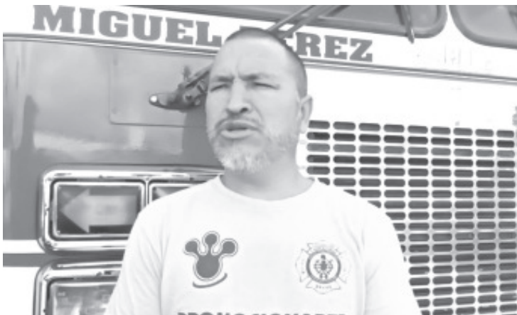
A partir de la apertura de los Santuarios de la Mariposa Monarca, el Cuerpo de Bomberos de Zitácuaro tendrá una subdelegación en el municipio de Ocampo.

Dijo que en el municipio de Ocampo, el cuerpo de bomberos pretende dar el respeto que se merecen los ciudadanos, además ganarse la confianza de la gente y hacer historia.