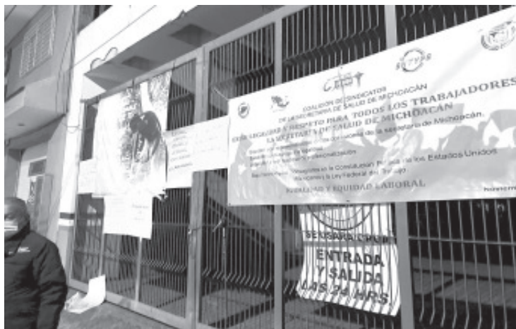
Agregados de diferentes sindicatos de la Secretaría de Salud tomaron las afueras de la Jurisdicción Sanitaria No. 3 exigiendo legalidad y respeto para todos los trabajadores.

- A nivel local estuvieron cerradas la Jurisdicción Sanitaria No 3, áreas administrativas del Centro de Salud y el Hospital Regional