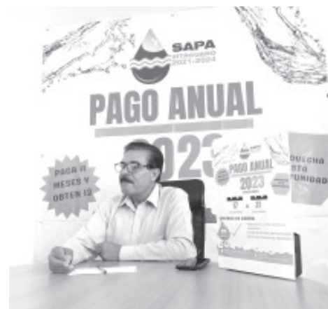
El Sistema de Agua Potable y Alcantarillado (SAPA), llevará a cabo el programa denominado Pago Anual Anticipado. Este año será del 17 de noviembre al 31 de diciembre.

Recordó que el SAPA es un órgano autónomo, descentralizado que no recibe aportaciones de ninguna dependencia, en este sentido su operación, pago de personal y todos los trabajos que realizan dependen exclusivamente de las aportaciones que hacen los usuarios.