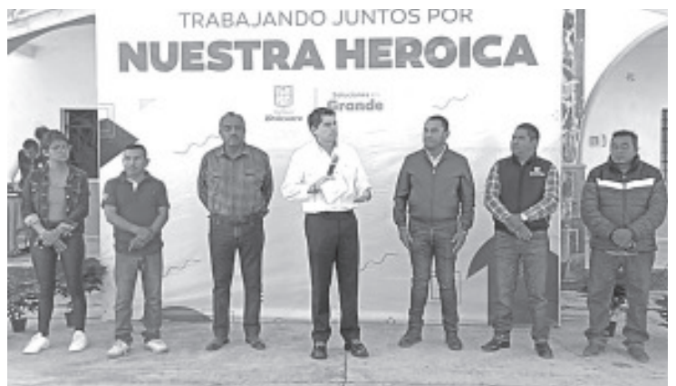
El banderazo de salida de las camionetas que acudirán a la expo de la flor de nochebuena a realizarse en Zinacantepec, fue encabezada por el Presidente Municipal Juan Antonio Ixtláhuac Orihuela.

Cómo parte del evento los presentes entregaron a los productores las credenciales que los identifica como participantes de la expo, además a las camionetas les pegaron calcomanías; también fueron del banderazo de salida a las unidades que acudirán al evento que se inaugura el próximo sábado en el municipio de Zinacantepec.