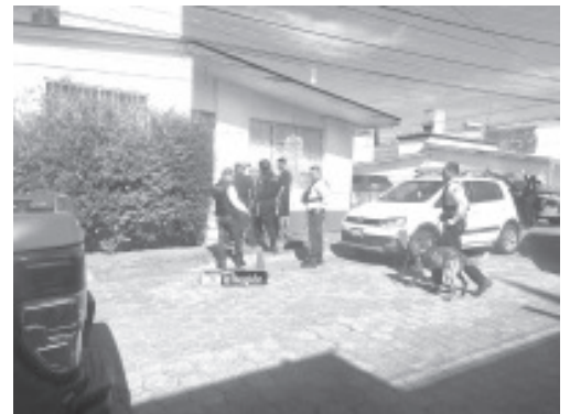
La Fiscalía General del Estado de Michoacán aseguró un inmueble, presuntamente relacionado con hechos delictivos, utilizado como clínica de rehabilitación y liberó a 21 personas, víctimas de posibles actos de tortura, en la ciudad de Morelia.

Morelia, Mich.- 15 de noviembre de 2022.- En cumplimiento a una orden de cateo, la Fiscalía General del Estado de Michoacán (FGE) aseguró un inmueble, presuntamente relacionado con hechos delictivos, que era utilizado como clínica de rehabilitación y liberó a 21 personas, víctimas de posibles actos de tortura, en esta ciudad de Morelia.