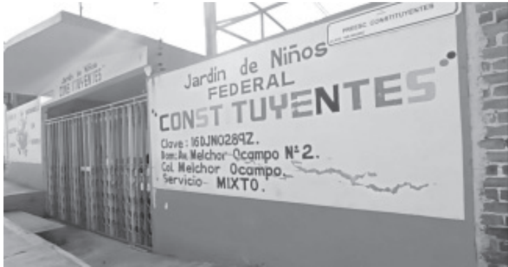
Durante la madrugada del miércoles de esta semana, amantes de lo ajeno entraron a robar al Jardín de Niños “Constituyentes”, que se encuentra en la colonia Melchor Ocampo.

Exhortó a las autoridades a no dejar a las escuelas solas, si bien es cierto que no les pueden dotar de un vigilante, si deben reforzar la presencia policiaca en la zona con recorridos para evitar estas conductas.