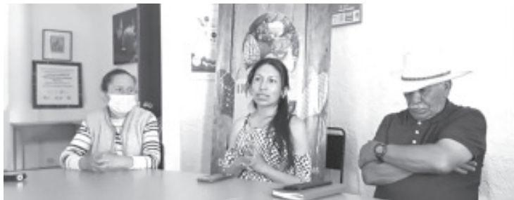
Organizadores de la IX edición de la Feria del Maíz Criollo coincidieron que las comunidades y los productores de baja escala son pieza fundamental para garantizar que se tenga una alimentación de calidad.

Estuvieron presentes representantes de Alternare, XETUMI, Ingenieros Agrónomos, Ecología Humana A.C. la Brigada de Educación para el Desarrollo Rural, entre otros.