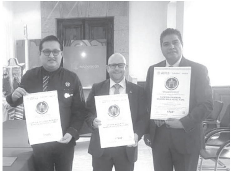
Con la entrega de ocho nuevos distintivos de calidad turística, llegan a 77 los distintivos vigentes en el programa de Mejora Continua en los servicios que ofrece Michoacán en sus diversas regiones.

La presente entrega de certificaciones comprendió cuatro distintivos de renovación Moderniza para empresas como el Hotel Cantera 10 y el Hotel del Carmen, así como cuatro distintivos H, para diversas áreas dedicadas a la preparación de alimentos (restaurantes y bares) en la empresa Mansión Solís Hotel y Spa.