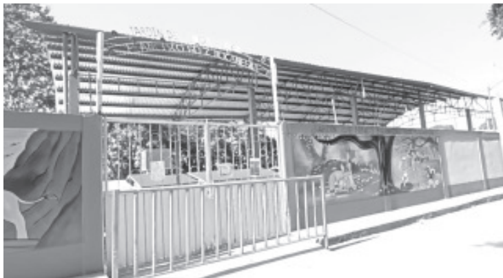
Por novena ocasión, el Jardín de Niños “Francisco González Bocanegra” de la Palma de Cedano fue saqueado por amantes de lo ajeno.

Por su parte, padres de familia dijeron tener miedo, ya que no hay seguridad y se teme que en algún momento en el interior puedan encontrar a alguien. Pidieron a la autoridad atención inmediata a este problema porque no solo es la escuela, los ladrones han vaciado casas completas.