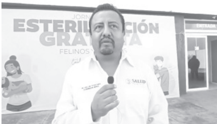
Durante este 14 y 15 en el Centro de Convenciones se van a esterilizar 70 mascotas hembras, tanto caninos como felinos de forma gratuita.

Por el momento en esta jornada, agregó que únicamente se estarían recibiendo hembras, por posteriormente se pretende llevar a cabo esta misma acción en machos.