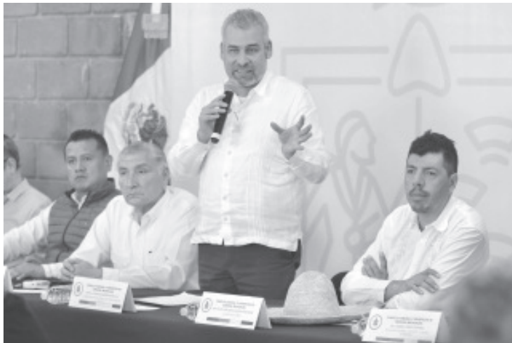
En gira de trabajo el gobernador Alfredo Ramírez Bedolla, acompañado del secretario de Gobernación, Adán Augusto López Hernández, indicó que para el 2023, las comunidades con autogobierno contarán con recursos del Fondo de Fortalecimiento para la Paz (Fortapaz).

Carapan, Michoacán, 15 de noviembre del 2022.- En gira de trabajo por la Meseta Purépecha y la Cañada de los Once Pueblos, el gobernador Alfredo Ramírez Bedolla, acompañado del secretario de Gobernación, Adán Augusto López Hernández, indicó que para el 2023, las comunidades con autogobierno contarán con recursos del