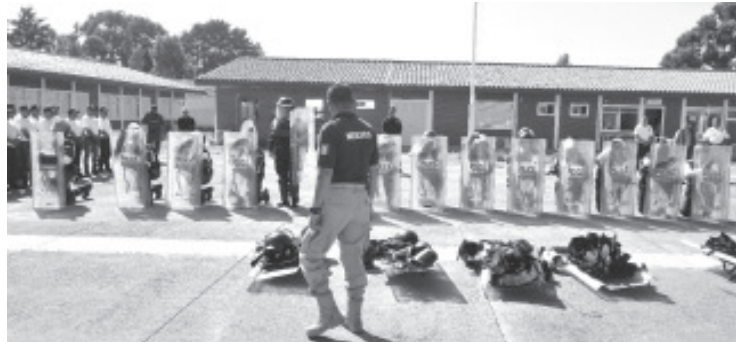
Con el propósito de que todo el estado cuente con cuerpos de seguridad capacitados y preparados, los agentes de la Secretaría de Seguridad Pública (SSP) mantiene capacitaciones para los integrantes de las Guardias Comunitarias en el municipio de Zitácuaro.

Gracias a estas labores, la SSP se mantiene firme en su compromiso por establecer condiciones para que todas y todos los michoacanos participen para asegurar el bienestar y el orden público en el estado.