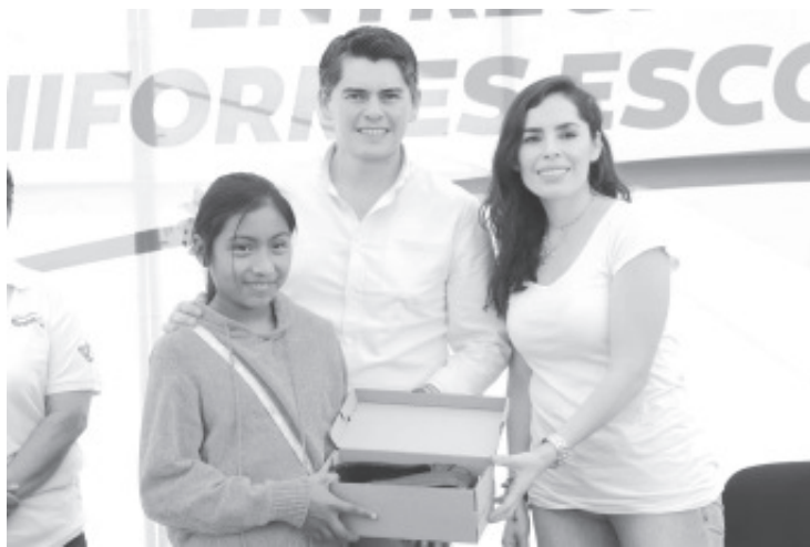
Más de una docena de comunidades y escuelas recibieron este sábado en la Plaza Cívica la segunda dotación de calzado, de mano del alcalde Juan Antonio Ixtláhuac.

Se entregaron 400 pares de zapatos a niños de estas comunidades y escuelas.