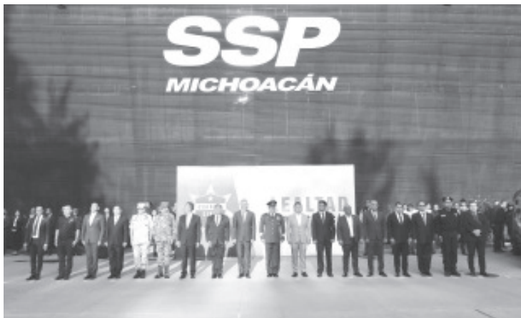
El gobernador Alfredo Ramírez Bedolla hizo un reconocimiento a las labores coordinadas de la Guardia Civil con instituciones de seguridad pública y procuración de justicia del ámbito municipal, estatal y federal.

Morelia, Michoacán, 07 de noviembre de 2022.- El gobernador Alfredo Ramírez Bedolla hizo un reconocimiento a las labores coordinadas de la Guardia Civil con instituciones de seguridad pública y procuración de justicia del ámbito municipal, estatal y federal, entre quienes dijo, se han generado las condiciones para preservar la paz