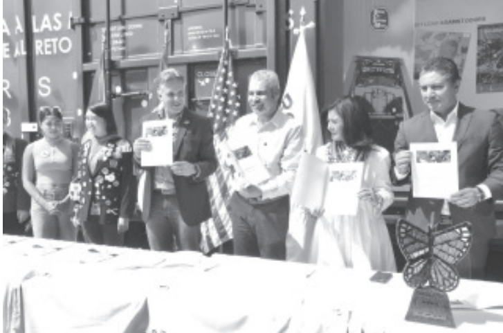
El gobernador Alfredo Ramírez Bedolla, recibió en Morelia el furgón de la Mariposa Monarca que recorrió 4 mil 500 kilómetros entre Canadá, Estados Unidos y México.

- El vagón con la imagen de la mariposa recorrió más de 4 mil 500 km entre Canadá, Estados Unidos y México para recaudar más de 2 mdp y adquirir 60 mil oyameles que serán plantados en el ejido de El Rosario - Bedolla signó convenio con KCSM y el Club Rotario Internacional para continuar implementando acciones en pro del medio ambiente