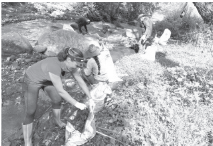
Integrantes de la Alianza por la Conservación del Bosque, Suelo y Agua A.C. llevaron a cabo una jornada de limpieza en la microcuenca del Río San Isidro, específicamente a la altura del Puente de San Miguel.

Invitó a la población en general a involucrarse en tareas como está, pues el cuidado del medio ambiente es un tema que le compete a todos; desafortunadamente prevalece una apatía total.