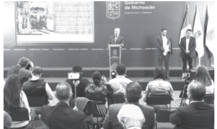
A más de un año de mantener las vías férreas libres en el estado, el gobernador Alfredo Ramírez Bedolla destacó que se recupera la confianza para atraer las inversiones.

Carolina es licenciada en Comunicación, lleva tiempo desempeñándose como fotógrafa en retrato, paisaje, concierto, institucional, social y deporte, este último es el que la lleva a Qatar.