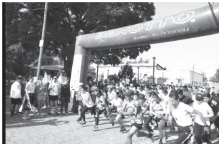
La carrera a campo traviesa "Corre por tu mole" en su edición 2022 fue un éxito total, participaron más de 600 personas distribuidas en todas las categorías contempladas en la convocatoria.