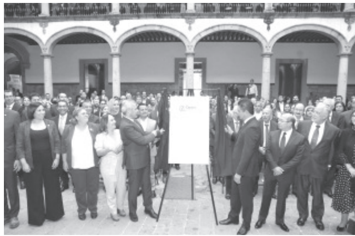
Durante la entrega de la acreditación institucional a la Universidad Michoacana de San Nicolás de Hidalgo (UMSNH), el gobernador Alfredo Ramírez Bedolla destacó la importancia de este logro, al cumplir con creces las funciones para hacerse acreedora a esta certificación, dejando en claro su aportación al desarrollo del país.