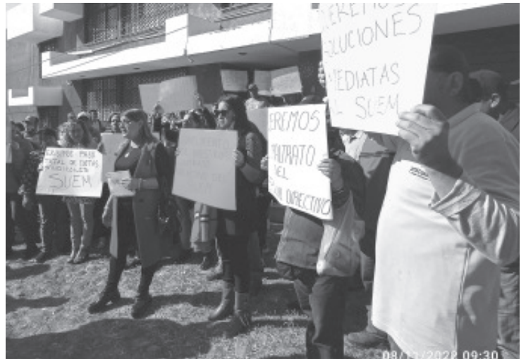
Agremiados al Sindicato Único de Empleados Municipales (SUEM), tomaron las oficinas de este organismo y paralizaron el funcionamiento de las cajas de cobro.

De todos estos atrasos, agregó que no ha habido ninguna explicación de ninguna persona, no les han dicho el motivo. En este sentido, precisó que la única forma en que se