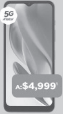
MOTOROLA g50 5G