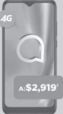
ALCATEL 1SE 5030A