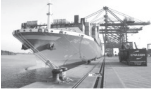
La Administración del Sistema Portuario Nacional Lázaro Cárdenas (ASIPONA), ofreció la bienvenida de su primer arribo al puerto al buque ONE Orinoco de la empresa Ocean Network Express, navío que es característico por su color magenta.

Lázaro Cárdenas, Mich.- 3 de noviembre de 2022.- La Administración del Sistema Portuario Nacional Lázaro Cárdenas (ASIPONA), ofreció la bienvenida de su primer arribo al puerto al buque ONE Orinoco de la empresa Ocean Network Express, navío que es característico por su color magenta.