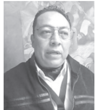
A nivel estado, la Jurisdicción Sanitaria No 3 con cabecera en Zitácuaro, ocupa el tercer lugar en cuanto a muertes maternas. anteriormente se ocupaba el primer sitio debido a que se tenían al menos 6 fallecimientos por año.

Agregó que tanto el sector salud como el