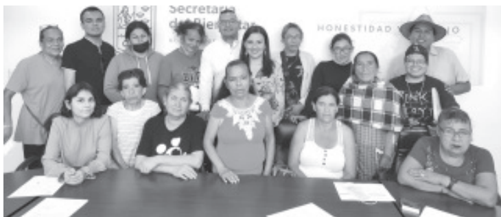
La Secretaría del Bienestar en Michoacán (Sedebi) realizó la entrega del recurso de manera directa a 48 personas, entre activistas, trabajadoras y trabajadores sexuales; así como a mujeres trans del estado.

A través de estas acciones, la Sedebi avanza en el objetivo de reconocer la diversidad así como la no discriminación de las personas LGBTTTIQ+, mediante distintas acciones que mejoren su calidad de vida.