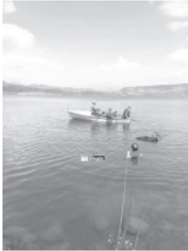
Socorristas de distintas corporaciones, así como elementos de la Guardia Civil y expertos en buceo realizaron un operativo de búsqueda en el referido lugar.

Especialistas de la Fiscalía Regional efectuaron las averiguaciones pertinentes para esclarecer los hechos, y los ahora finados fueron trasladados a la morgue para la práctica de la necropsia de rigor.