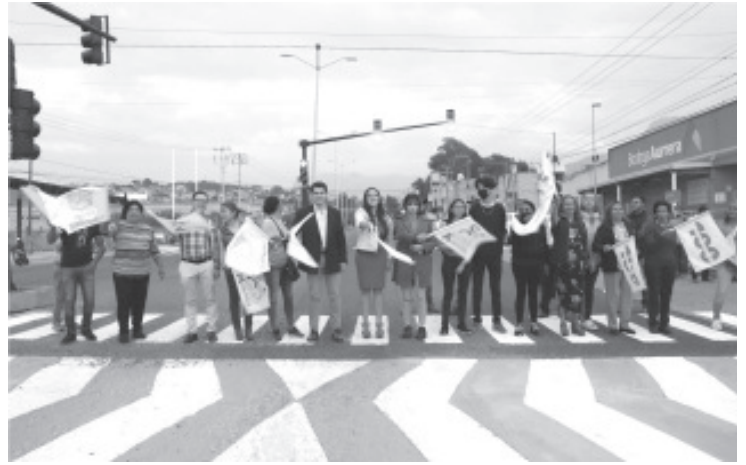
A petición de las y los vecinos de las colonias y fraccionamientos aledaños a la carretera federal, en salida a Huetamo, el #GobiernoDeSoluciones, instaló un módulo de semáforos y señalética, a fin de garantizar condiciones de seguridad vial para los transeúntes y automovilistas.