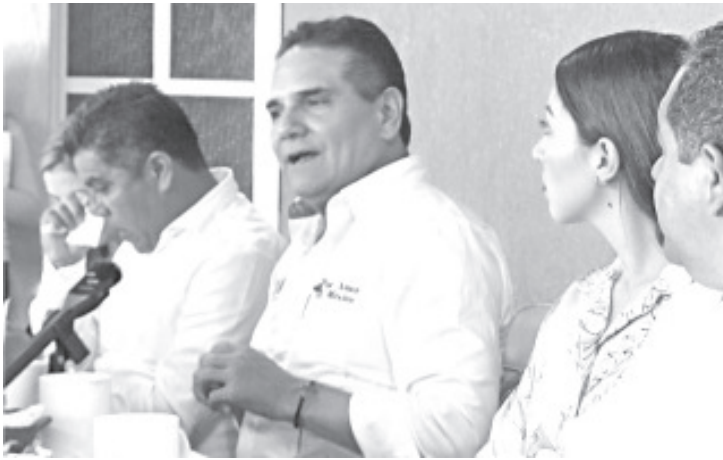
Como parte del recorrido que realiza por todo el país, Silvano Aureoles Conejo visitó este viernes el municipio de Zitácuaro.

- Su gira por todo el país llega al municipio