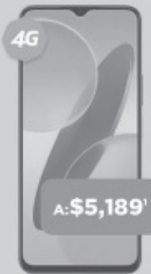
HONOR X6s 128GB