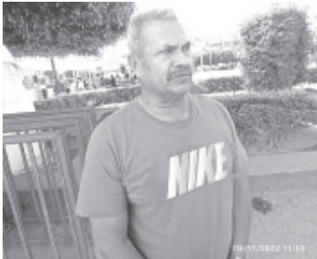
Félix Reyes Posadas, titular de Educación y Cultura Física exhortó a la población a reportar malas conductas en unidades deportivas, ya que ha tenido conocimiento de personas que ingresan y consumen bebidas alcohólicas, lo cual está prohibido.

- Llama a usuarios a reportar malas conductas en estos espacios