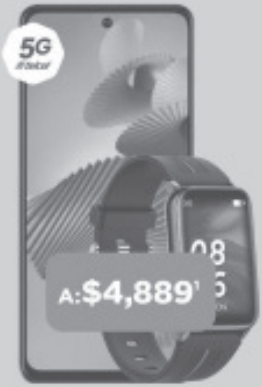
ZTE V40 Bundle