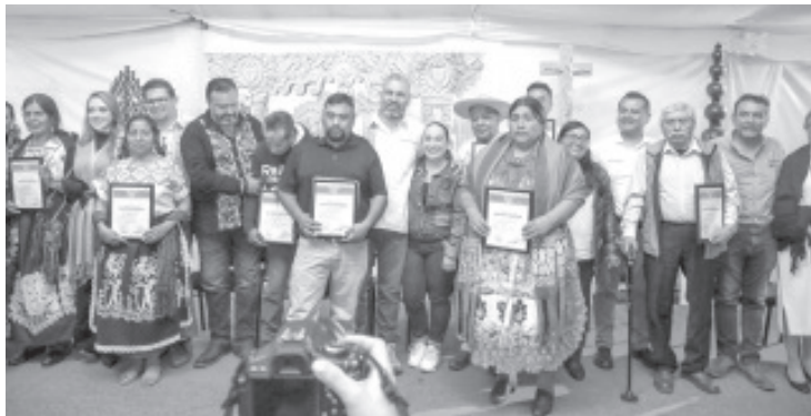
El gobernador Alfredo Ramírez Bedolla, acompañado de su esposa Griselda Tello Pimentel, entregó los premios a los artesanos ganadores del LIII Concurso Estatal de Artesanías de Noche de Animas.

- Otorga Gobernador premio a artesanos ganadores del LIII Concurso Estatal de Artesanías en Pátzcuaro - La bolsa en premios para las y los ganadores asciende a los 845 mil pesos, 17% más que en 2021