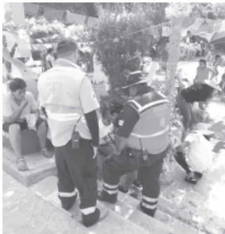
La Secretaría de Gobierno, a través de la Coordinación Estatal de Protección Civil informa respecto a la atención de incidentes durante las celebraciones del Día de Muertos en la región Lacustre de Pátzcuaro.

La Secretaría de Gobierno reitera el número de emergencias 9-1-1 para atender cualquier eventualidad a través de los servicios de emergencia.