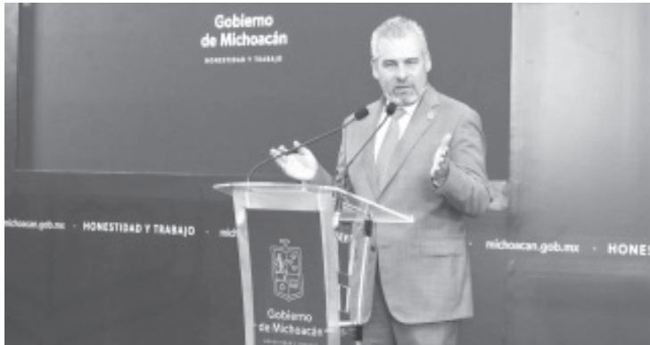
El gobernador Alfredo Ramírez Bedolla informó que el próximo jueves 27, la secretaria de Bienestar federal y el Gobierno de Michoacán, comenzarán la entrega de apoyos en municipios afectados de la región Costa.

- Gobierno de Michoacán ha destinado 25 mdp en apoyos a damnificados por sismo