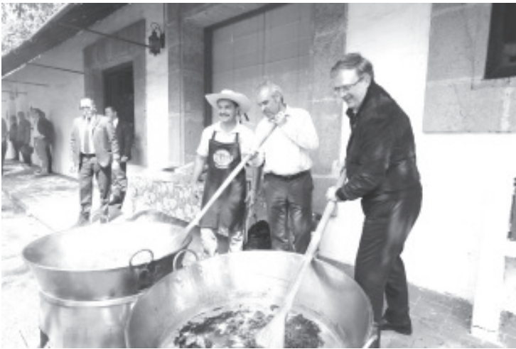
El gobernador Alfredo Ramírez Bedolla y el Canciller Marcelo Ebrard, se reunieron con empresarios y empresarios michoacanos, donde coincidieron en su interés por impulsar las inversiones en la entidad.

Morelia, Michoacán, 23 de octubre de 2022.- El gobernador Alfredo Ramírez Bedolla y el Canciller Marcelo Ebrard, se reunieron con empresarios y empresarios michoacanos, donde coincidieron en su interés por impulsar las inversiones en la entidad, a través de la sinergia entre empresarios, sector productivo y Gobierno.