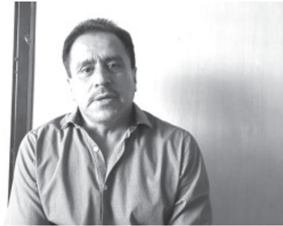
Con la entrada en vigor en el estado, del nuevo modelo de justicia laboral el pasado 3 de octubre; todos los ciudadanos que quieran asesoría, tienen que acudir a la ciudad de Morelia.

- Para cualquier trámite tienen que acudir a Morelia