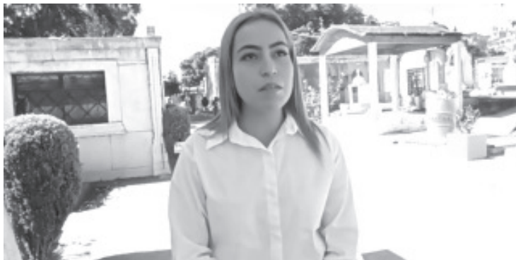
Previo a la celebración de Día de Muertos, el Panteón Municipal San Carlos ya comenzó a registrar afluencia de visitantes. Tan sólo durante el fin de semana, se recibieron alrededor de 2000 personas.

Recordó que cada año asistente a este lugar más de 30 mil personas en los días centrales, pero estimó que ahora la celebración ocurre a mitad de semana por lo que seguramente muchos aprovecharán para ir en fin de semana.