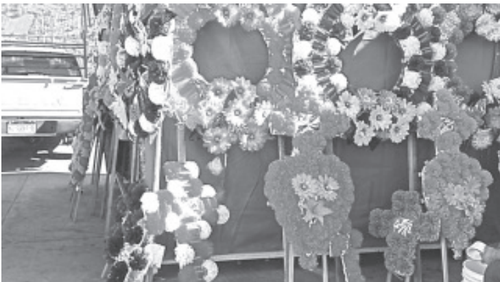
Un total de 94 comerciantes de coronas, veladoras y flores ya se encuentran instalados en las inmediaciones de la central de autobuses, en lo que es la calle General Pueblita como cada año.

Agregó que esta unión es la más grande que tiene Zitácuaro porque la componen 104 integrantes, sin embargo este año no todos salieron a trabajar. Los que sí participan están en el mejor de los ánimos por sacar adelante las ventas y recuperar lo invertido.