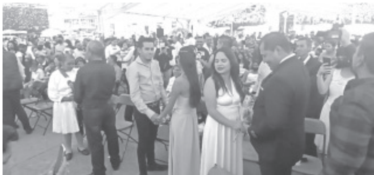
Con un evento emotivo dónde se unieron en matrimonio decenas de parejas que vivían en unión libre, culminó la campaña de regularización del estado civil de las personas llevada a cabo en Zitácuaro del 3 al 20 de octubre.

Durante el evento se entregaron las actas de registro de nacimiento y reconocimientos, así como de matrimonio a quienes se beneficiaron durante la campaña