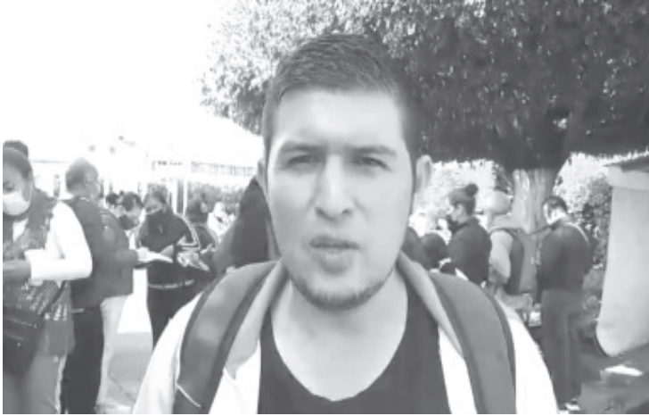
Para exigir que diputados locales y federales revisen el presupuesto que se destina a este rubro para atender las demandas, integrantes de la CNTE Grupo Poder de Base acudieron a las presidencias municipales para entregar un posicionamiento y sus principales necesidades.

- Actualmente se debe a Pensiones Civiles 6000 millones de pesos