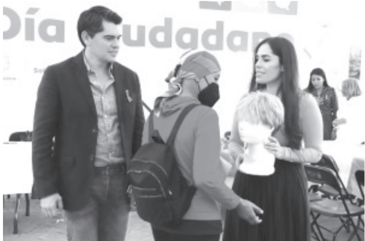
En el marco del Día Internacional de la Lucha Contra el Cáncer de Mama, durante el #DíaCiudadano número 58, el alcalde Toño Ixtláhuac entregó pelucas oncológicas a mujeres que luchan contra este padecimiento.

"Somos un gobierno sensible y comprometido con quienes más ocupan de nosotros", destacó el presidente municipal al término de este encuentro con los ciudadanos.