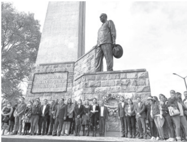
Las y los integrantes de la Dirección Estatal Ejecutiva (DEE) del Partido de la Revolución Democrática (PRD), conmemoraron el 52 Aniversario luctuoso del general Lázaro Cárdenas del Río.