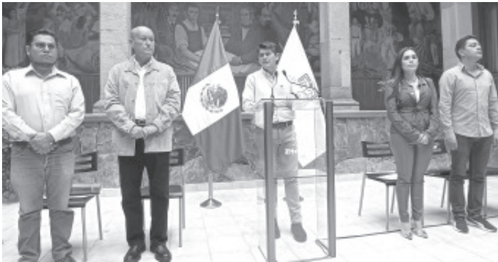
Con la realización de diferentes actividades que van desde concursos de ofrendas, rodada ciclista, ofrendas, rondallas, desfile, feria del pan entre otras actividades del 27 de octubre al 6 de noviembre se realizará el festival de Día de Muertos "Animas de la Heroica".

- Ofrendas, rodada ciclista, desfile, rondallas y más