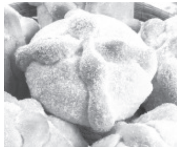
Un total de 50 panaderos de dos uniones e independientes, participarán en la Feria del Pan de Muerto, la cual está proyectada a realizarse del 29 de octubre al 2 de noviembre en la explanada de la Plaza Cívica Licenciado Benito Juárez.