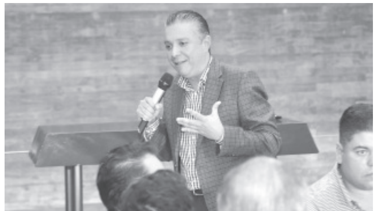
Respetuoso de la autonomía y de la división de Poderes, el Gobierno de Michoacán expresa su beneplácito por el hecho de que el Congreso del Estado obtuvo un ahorro de más de 42 millones de pesos, monto que retornará a las arcas estatales de manera transparente e institucional.

Navarro García expresó que se dan coincidencias en ambos poderes estatales, el Ejecutivo y el Legislativo, en materia de eficiencia, austeridad y transparencia en la aplicación de los recursos públicos, por lo que pronosticó que, en lo sucesivo, los acuerdos serán más favorables a las demandas sociales y acordes al bien común.