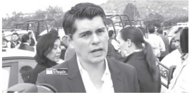
Antonio Ixtlahuac Orihuela, presidente municipal de Zitácuaro informó que el ayuntamiento planea fortalecer la seguridad pública de su municipio y la región a través de diversas medidas.

También detalló que al inicio de su administración había solo 5 patrullas y actualmente se cuenta con 40 unidades.