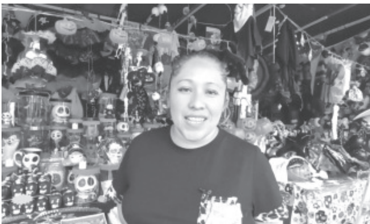
Para la celebración de Día de Muertos, en el Jardín Constitución ya se encuentran a la venta todo tipo de dulces y productos alusivos a dicha celebración.

Confío en que las ventas sean buenas, ya que durante la pandemia sus ventas fueron muy bajas; ahora hay clases presenciales y esto ojalá les beneficie ya que los estudiantes son los que mueven la economía