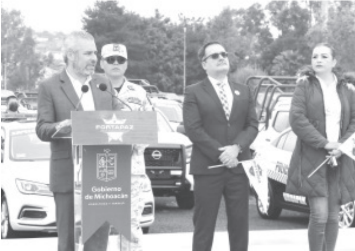
El gobernador Alfredo Ramírez Bedolla realizó la primera entrega de patrullas y equipamiento a municipios del estado, como parte del programa de Fortalecimiento para la Paz (Fortapaz),