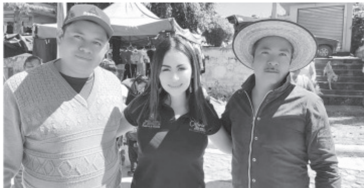
Para conocer las necesidades de las y los comerciantes del Distrito de Zitácuaro y buscar alternativas conjuntas encaminadas a detonar su potencial y mejoren sus ingresos, la diputada Gloria Tapia Reyes sostuvo diversas reuniones de trabajo e hizo entrega de diversos apoyos.

Gloria Tapia añadió que "seguiré ayudando y estoy muy contenta de estar aquí con todos ustedes para hacerles entrega de estos apoyos, pero también para seguir construyendo proyectos juntos, que contribuyan a detonar el potencial de los comerciantes y que ellos se traduzca en grandes beneficios para sus familias; sus causas son las nuestras".