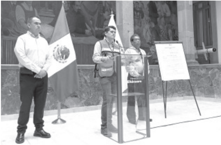
El municipio enfrenta una deuda de 133 millones 447 mil 792 pesos ante el SAT por no llevar a cabo el pago del ISR por sueldos y salarios. Dichas omisiones fueron durante los periodos de 2017, 2018 y 2020.

-Anuncia Gobierno Municipal medidas para no poner en riesgo operatividad