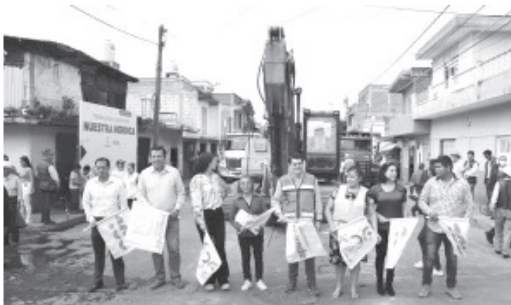
Derivado del Presupuesto Participativo 2023, que promovió el gobierno del alcalde Toño Ixtlahuac, una de las obras más votadas para aplicar este ejercicio fue la pavimentación de la calle Moctezuma, en el tramo que comprende de Pipila a Manuel Doblado.

Los trabajos también contemplan, la introducción del drenaje sanitario, red de agua potable y alumbrado público. "En dos meses los vecinos de esta colonia contarán con un espacio renovado y de calidad", agregó el alcalde.