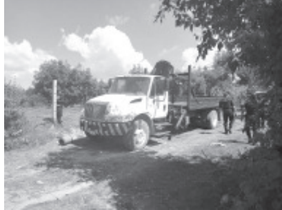
Con la premisa de velar por el patrimonio e integridad física de las y los michoacanos, los elementos de la Secretaría de Seguridad Pública, en coordinación con la Policía Municipal, lograron localizar y recuperar un automotor que contaba con reporte de robo.

En caso de requerir o solicitar apoyo ante alguna situación de riesgo, las líneas telefónicas 911 y 089 atienden de manera inmediata los siete días de la semana.