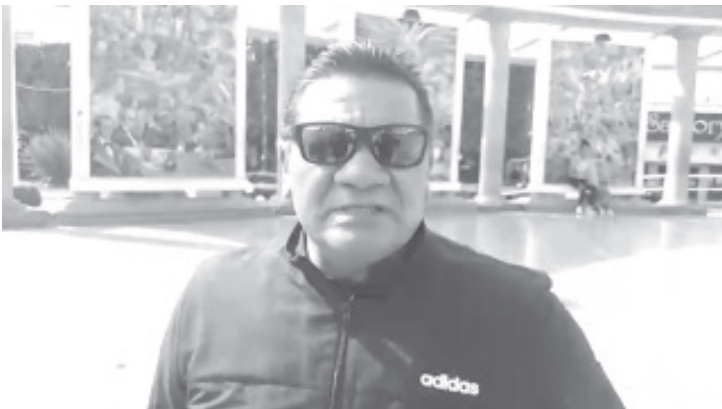
El próximo 20 de octubre, en León Guanajuato se realizará el Circuito de Natación Nacional, evento que reúne a los mejores en esta disciplina deportiva. De Michoacán va el Club de Tiburones de Zitácuaro y una escuela de Morelia.

Agregó que a Tiburones se pueden sumar, todas aquellas personas que sepan nadar, siempre y cuando tengan menos de 17 años; actualmente entrenan en la alberca de la unidad deportiva de Pueblo Nuevo.