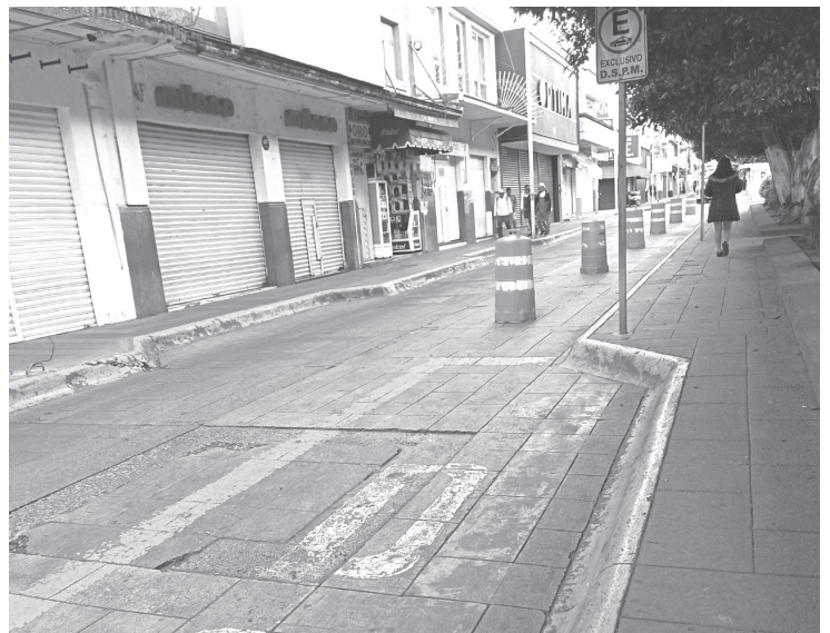
Luego de que el Gobierno Municipal, anunciara la semana pasada que está prohibido estacionarse en el primer cuadro de la ciudad, este lunes ya se comenzó a aplicar.

Agregó que todo aquel automovilista que no acate dicha disposición, será acreedor a multas y sanciones que ya están establecidas.