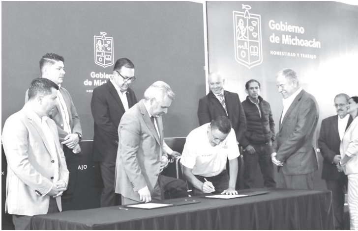
El Gobierno de Michoacán puso en marcha la estrategia Michoacán sin Carestía, en un esfuerzo coordinado con dependencias y organismos del gobierno federal y empresas de diversos giros para contener incrementos en precios de productos y servicios.

-Pone en marcha estrategia Michoacán sin Carestía