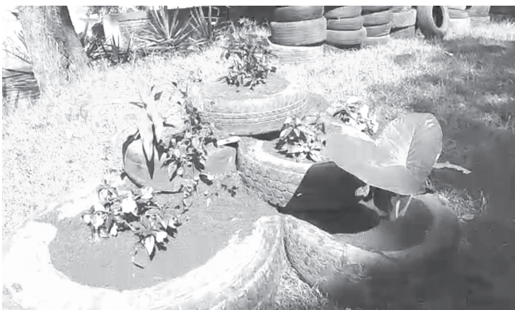
Con el objetivo de dar un destino final sustentable, adecuado y además propiciar la reutilización en juegos infantiles y macetas ecológicas, del 11 al 30 de octubre se llevará a cabo el 'Llantatón 2022'.

Invitó a la población en general a participar en esta acción, ya que es importante no contaminar más el medio ambiente y las llantas son un material difícil de descomponerse.