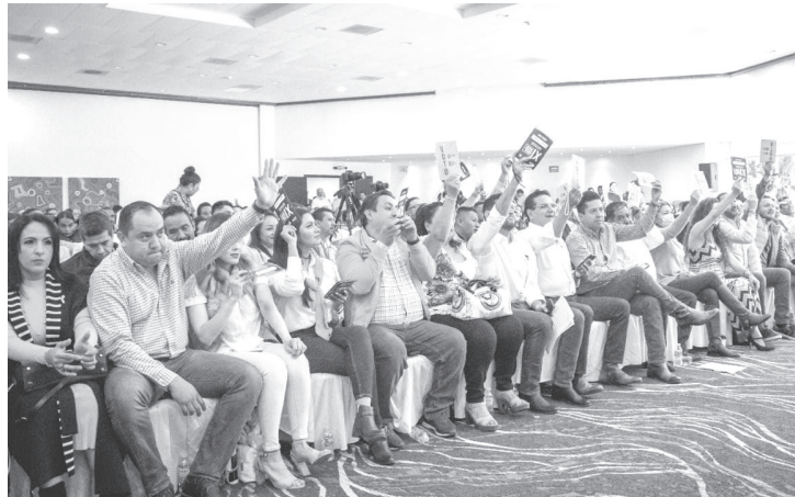
Integrantes de la Dirección Estatal Ejecutiva (DEE) del Partido de la Revolución Democrática (PRD) exigieron al gobierno del estado que atienda a las familias damnificadas por los sismos ocurridos el pasado 19 y 22 de septiembre, con epicentro en Coalcomán.

forma inmediata. Exigimos la creación de una reserva financiera especial estatal que suministre los recursos complementarios a los recursos federales acumulados en forma expedita y transparente al programa de atención a contingencias climatológicas para atender sin pretextos y oportuna las necesidades inmediatas de los nuestros hermanos en desgracia que han perdido de manera total o parcial su patrimonio.