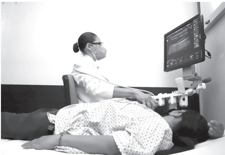
El Gobierno de Alfredo Ramírez Bedolla garantiza a mujeres sin seguridad social tratamiento oportuno y gratuito de cáncer de mama a través del Centro Estatal de Atención Oncológica de la Secretaría de Salud de Michoacán.

La SSM no bajará la guardia en la implementación de acciones para la detección oportuna: autoexploración a partir de los 20 años de edad, exploración clínica de 25 a 39 años de edad y mastografía de 40 a 69 años de edad, haciendo énfasis en aquellas mujeres que tienen factores de riesgo.