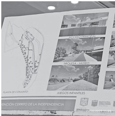
El Cerrito de la Independencia será rescatado en dos aspectos: ambiental y turística para el disfrute de todos los ciudadanos. Así lo anunció el Presidente Municipal Juan Antonio Ixtláhuac Orihuela,

H. Zitácuaro Michoacán, 11 de octubre de 2022.- Por: Guadalupe Solache Rebollo. El Cerrito de la Independencia será rescatado en dos aspectos: ambiental y turística para el disfrute de todos los ciudadanos. Así lo anunció el Presidente Municipal Juan Antonio Ixtláhuac Orihuela, acompañado de funcionarios de algunas dependencias.