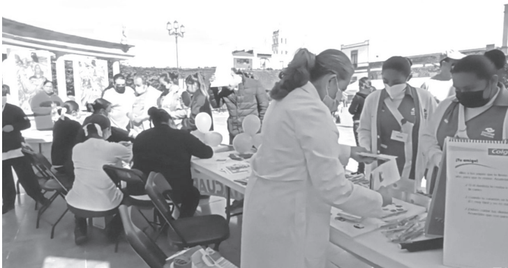
Para acercar todos los servicios de salud a la población, en todo el país se llevará a cabo la Segunda Jornada de Salud Pública del 10 al 21 de octubre.