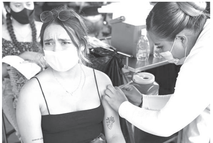
Poco más de 3 millones de michoacanos mayores de 5 años han completado sus esquemas de inmunización anti COVID-19, lo que sigue colocando al estado entre los mejores calificados en la estrategia Nacional de Vacunación.

Desde el arranque de la inmunización y hasta el día de hoy se han aplicado 7 millones 736 mil 851 dosis de vacuna a grupos etarios mayores de 5 años.