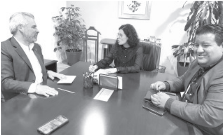
El gobernador Alfredo Ramírez Bedolla revisó con la secretaria del Trabajo y Previsión Social, especificaciones de la propuesta regulatoria para la contratación y formalización de trabajadores agrícolas del aguacate en Michoacán.

Ciudad de México, 5 de octubre del 2022.- El gobernador Alfredo Ramírez Bedolla revisó con la secretaria del Trabajo y Previsión Social, Luisa María Alcalde, especificaciones de la propuesta regulatoria para la contratación y formalización de trabajadores agrícolas del aguacate en Michoacán.