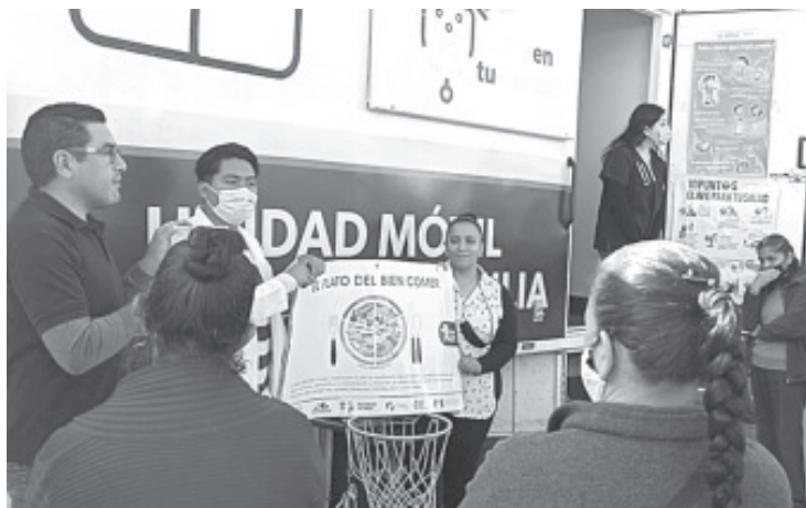
El módulo móvil del programa “Salud en tu casa” llegó al municipio y a través de la unidad móvil en la plaza central se hicieron activaciones físicas así como detección de glucosa, diabetes e hipertensión en personas adultas mayores.

Ambos exhortaron a la población a llevar estilos de vida saludable, esto incluye