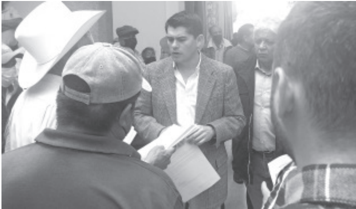
Productores de diferentes núcleos agrarios llevarán a cabo la segunda etapa de la tecnificación del sistema de riego de la presa de Ziráhuato, esto con el fin de seguir produciendo alimentos de calidad para toda la población.

- Son varios cultivos los que serán beneficiados