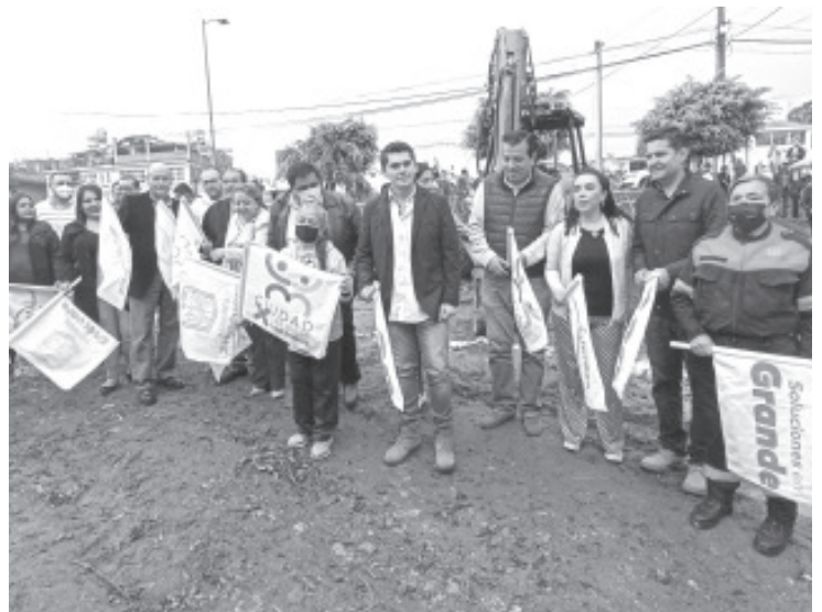
Con una inversión superior a los 10 millones de pesos, arrancaron los trabajos de la obra de construcción de la clínica de hemodiálisis y para diabéticos.

Estuvieron presentes coordinadores de la Jurisdicción Sanitaria No 3, directores de hospitales así como funcionarios de la administración pública municipal