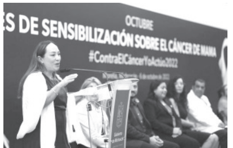
El Gobierno Estatal, a través de la Secretaría de Salud de Michoacán (SSM) y del Sistema DIF, reforzará las acciones de prevención, detección y atención del cáncer de mama.

Por último, hizo un llamado al Sector Salud a no bajar la guardia en la batalla contra el cáncer de mama, para lograr bajar la incidencia de casos y defunciones a consecuencia de esta enfermedad.