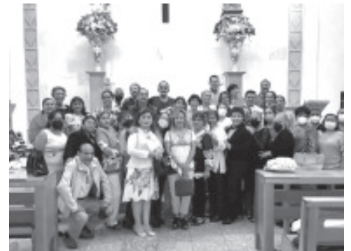
Este PRIMERO DE OCTUBRE Se Celebró EL DIA DEL TRABAJADOR DEL ISSSTE Y Trabajadores de la Clínica del ISSSTE Fueron ¡FELICITADOS! En su día por Autoridades y Sindicato.