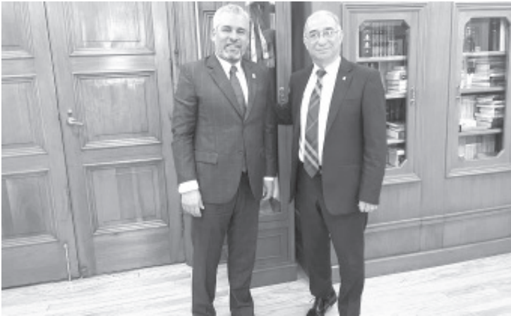
El gobernador Alfredo Ramírez Bedolla se reunió con el ministro de la (SCJN), Alberto Pérez Dayán, para intercambiar ideas sobre los derechos de las comunidades indígenas, el autogobierno y la determinación de recursos propios para este sector.

Ciudad de México, 4 de octubre del 2022.- El gobernador Alfredo Ramírez Bedolla se reunió con el ministro de la Suprema Corte de Justicia de la Nación (SCJN), Alberto Pérez Dayán, para intercambiar ideas sobre los derechos de las comunidades indígenas, el autogobierno y la determinación de recursos propios para este sector.