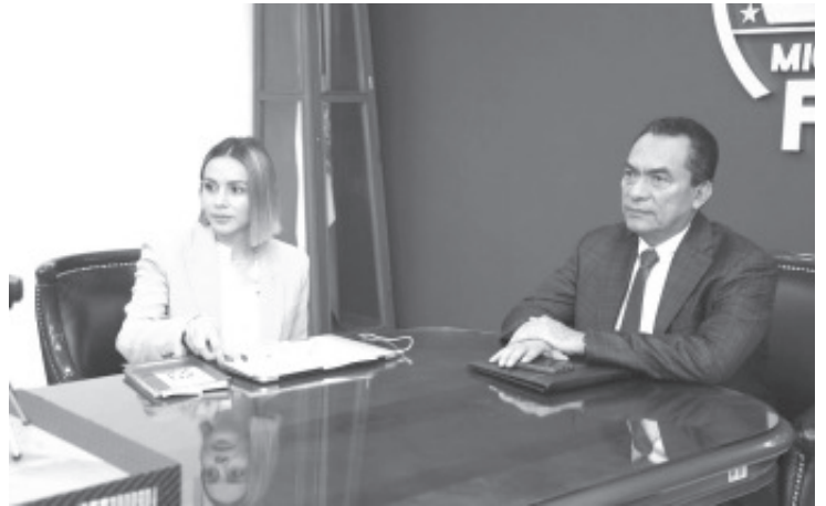
El titular de la Fiscalía General del Estado de Michoacán (FGE), Adrián López Solís, urgió la necesidad de reforzar la Estrategia Nacional de Búsqueda de Personas, a través del trabajo coordinado de las diversas instancias, encargadas en esta tarea.