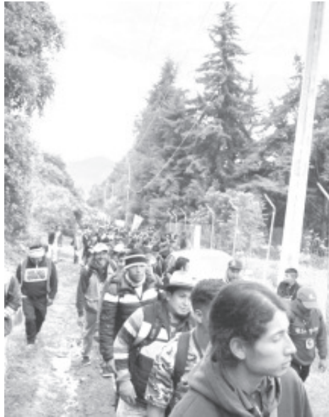
Luego de dos años de haber estado suspendida por la pandemia de covid-19, este año volvió la Peregrinación de Hombres a Pie al Tepeyac

“Para muchos es muy difícil porque se les hacen ampollas, se rozan pero a todos nos mueve la fe, y queremos ver a nuestra madre para pedir por nuestra familia o agradecer favores que nos ha hecho la virgen” expresó.