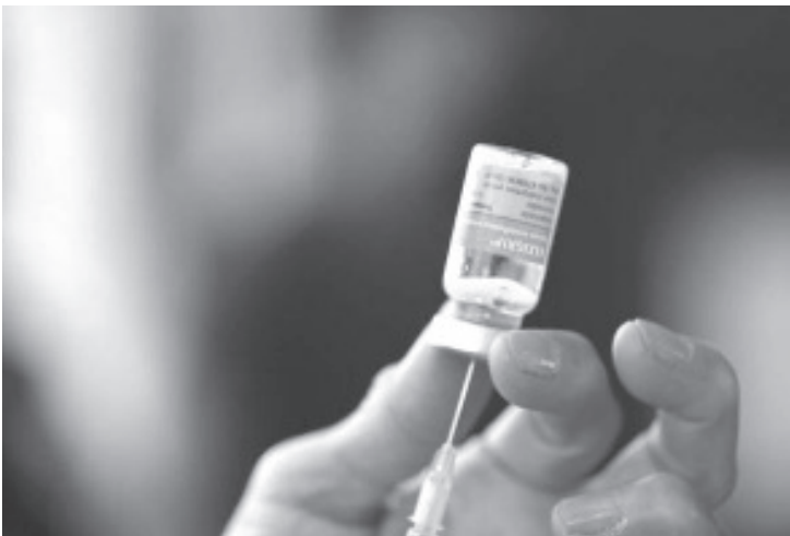
La Secretaría de Salud de Michoacán (SSM) informa a la población que la vacunación contra la influenza ya arrancó en la entidad y que estará vigente hasta el 31 de marzo del 2023, con la meta de inmunizar a más de un millón 312 mil personas.

Los principales síntomas de la influenza estacional son: fiebre con escalofríos, tos, dolor de garganta, mucosidad nasal o nariz tapada, dolores musculares, dolor de cabeza y fatiga. En esos casos, es necesario solicitar atención médica en el centro de salud más cercano.