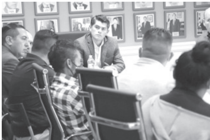
El alcalde, Juan Antonio Ixtláhuac, encabezó la noche del lunes una reunión con los padres de la menor de edad agredida en la colonia Pueblo Nuevo por un sujeto que se encuentra prófugo.

Además, se acordó la realización de reuniones consecutivas a lo largo del proceso para darle una solución integral al caso.