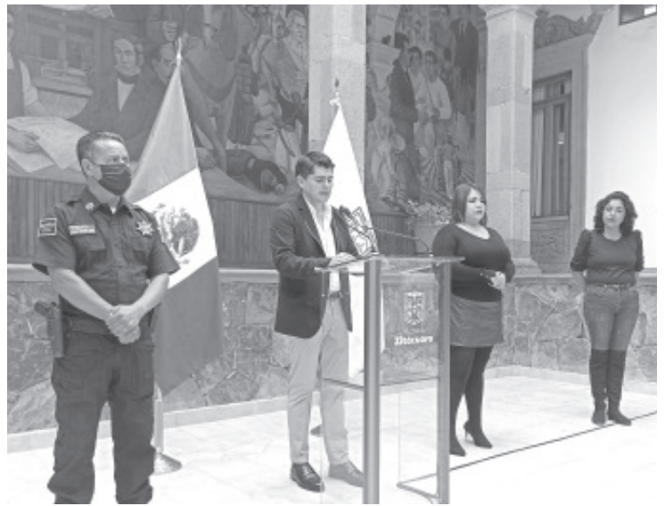
El Ayuntamiento Municipal diseñará una estrategia para proteger a los niños y niñas de la ciudad de hechos que pudieran cometer 'inadaptados' o personas que están enfermos psicológicamente.