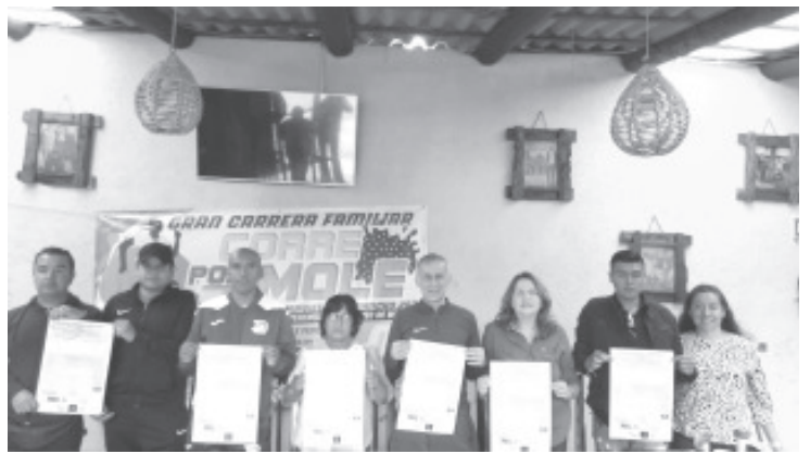
El próximo 6 de noviembre en punto de las 9:00 de la mañana en la tenencia de Coatepec de Morelos, se realizará la carrera familiar a campo traviesa "Corre por tu mole".