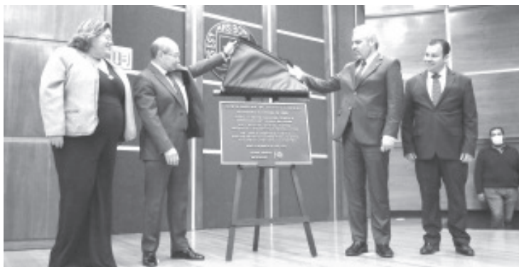
El gobernador Alfredo Ramírez Bedolla enfatizó que el nuevo sistema de justicia laboral, que a partir del 3 de octubre entra en vigor en Michoacán, resuelve una deuda histórica con las y los trabajadores.

- Este modelo resuelve la deuda histórica con trabajadores y sus derechos: Bedolla