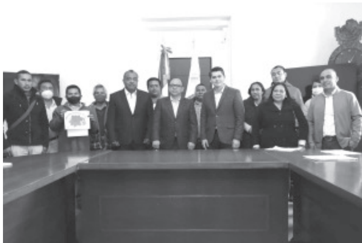
Los alcaldes de Zitácuaro y Zinacantepec establecieron un acuerdo en favor de los productores de flor de nochebuena del municipio michoacano.

Toño Ixtláhuac destacó la disponibilidad de su homólogo de Zinacantepec y manifestó su confianza en que con el acuerdo establecido este día los productores de nochebuena de Zitácuaro mejorarán sus ventas.