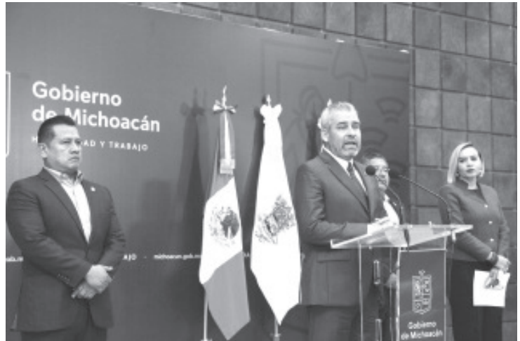
El gobernador Alfredo Ramírez Bedolla enfatizó que los trámites para asignación de plazas educativas o contratación de docentes, se realizan de manera individual, sin la intervención de sindicatos, y únicamente a través de la Unidad Estatal del Sistema Para la Carrera de los Maestros y Maestras.

Por lo anterior, enfatizó, "yo quiero decir a los jóvenes normalistas que, así como se acabó el huachicol de plazas y