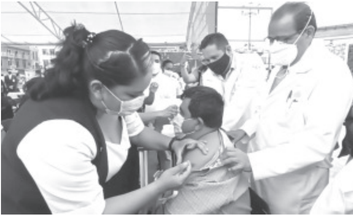
Este lunes arrancó la vacunación contra la influenza estacional 2022-2023 y concluirá el próximo 31 de marzo.