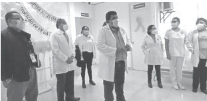
Durante todo este mes de octubre, el Hospital Regional estará intensificando la realización de los estudios de mastografías a mujeres mayores de 40 años.

Las interesadas deben acudir desde temprano, bañadas, sin desodorantes o cremas, axilas depiladas y con ropa cómoda para el estudio, deben llevar además credencial de elector.