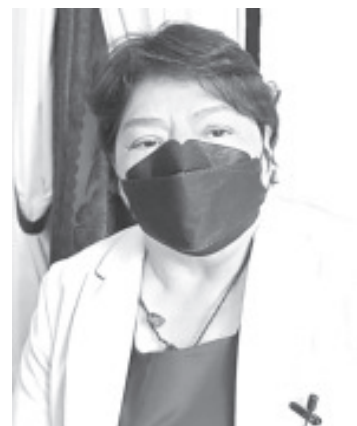
Este año la fiesta en honor a San Francisco de Asís en la tenencia de Coatepec de Morelos fue austera, se redujo solo a la parte religiosa; por lo tanto no hubo feria, concurso del mole, juegos mecánicos ni puestos.

Ahora, dijo que se tiene la meta de que el siguiente año vuelva el esplendor, para ello aseguró que hay muchos habitantes de este lugar en contribuir para tener una fiesta como este lugar se merece.