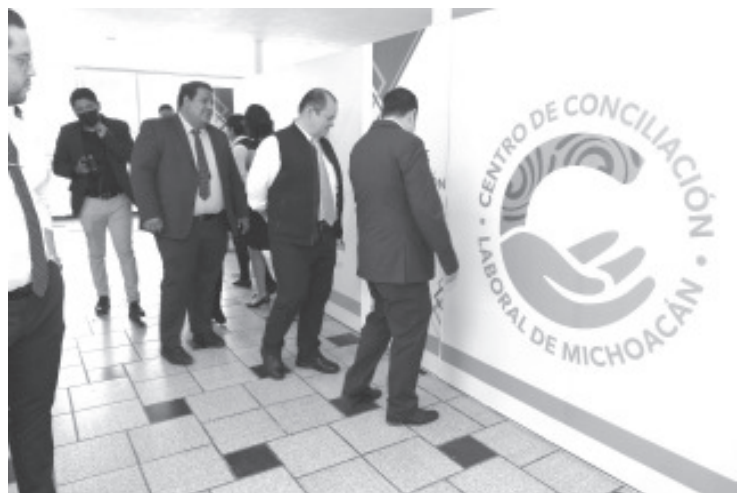
Este lunes Michoacán y otras 10 entidades federativas comenzaron a operar bajo ese nuevo modelo. Al entrar en vigor la reforma laboral, comenzaron actividad los Centros de Conciliación Laboral en Morelia, Uruapan y Zamora, así como cuatro tribunales.

Cabe señalar que el horario de atención al público será de 9:00 a 15:00 horas, de lunes a viernes.