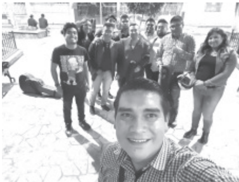
El próximo 26 y 27 del mes de noviembre, la rondalla Ebríos de Amor representará a Zitácuaro en un evento nacional que se realizará en Zamora.

Sin embargo, dijo que tienen varias dificultades para acudir a la sede, requieren el apoyo para el transporte, por lo que han decidido salir a botear a las calles, cantar, y solicitar ayuda de alguna persona o empresario que esté en condiciones de