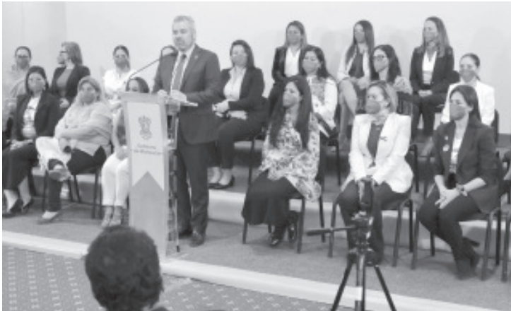
El gobernador Alfredo Ramírez Bedolla confió en que se apruebe, en el Congreso del Estado, la reforma al Código Penal de Michoacán con el que se agravan las penas por delito de feminicidio.

Morelia, Michoacán, 28 de septiembre del 2022.- El gobernador Alfredo Ramírez Bedolla confió en que este jueves se apruebe, en el Congreso del Estado, la reforma al Código Penal de Michoacán con el que se agravan las penas por delito de feminicidio.