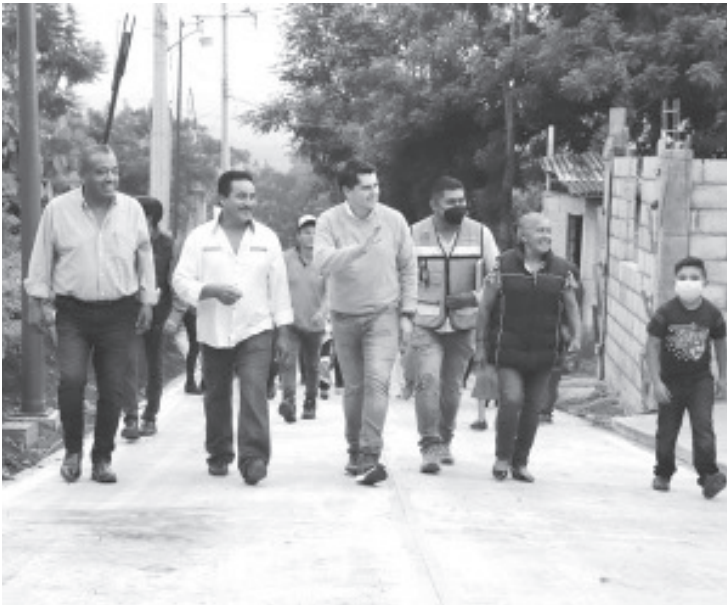
Juan Antonio Ixtláhuac prosigue con la entrega de obras de calidad en la zona rural, al inaugurar este martes la pavimentación del camino que conduce a la localidad de Los Zapotes, perteneciente a la encargatura de Ocurio.

"No aplica a capricho o decisión unilateral, sino con acuerdos, participación ciudadana y buscando el beneficio colectivo", agregó.