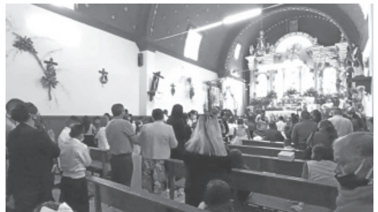
Habitantes de la tenencia de San Miguel Chichimequillas celebraron en grande al santo patrono de este lugar San Miguel Arcángel.

Estas dos palabras juntas en nahua significa línea de perros; el agregado ‘de Escobedo’ se debe a Mariano Escobedo, un personaje de la historia.