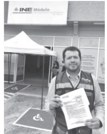
Con el fin de que en las próximas elecciones de 2024, los ciudadanos no tengan que recorrer largas distancias para emitir su voto; el representante de MORENA en el Distrito 03 del INE, solicitó la reubicación de casillas así como de unidades territoriales.

Agregó que en los próximos días comenzará una campaña para la difusión de Módulos de Atención Ciudadana que operarán en el distrito federal 03 por parte del Instituto Nacional Electoral, esto con el fin de invitar a ciudadanos a que acudan a la actualización de su credencial de elector.