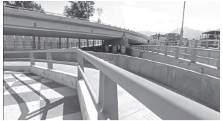
En días pasados, comenzó la construcción del puente peatonal en el circuito de Avenida Revolución, con este, los vecinos podrán cruzar hacia el otro lado sin tantos problemas.