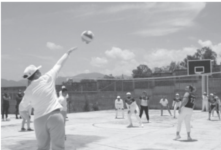
La apertura y adaptación de espacios deportivos, así como la dotación de equipo ha sido un factor fundamental para incentivar a internas e internos a la práctica de atletismo, fútbol, basquetbol, voleibol, box, ping pong, ajedrez y muchas otras actividades.

Con estas acciones el Gobierno de Michoacán ratifica su compromiso de trabajar en favor de todos los sectores de la sociedad.