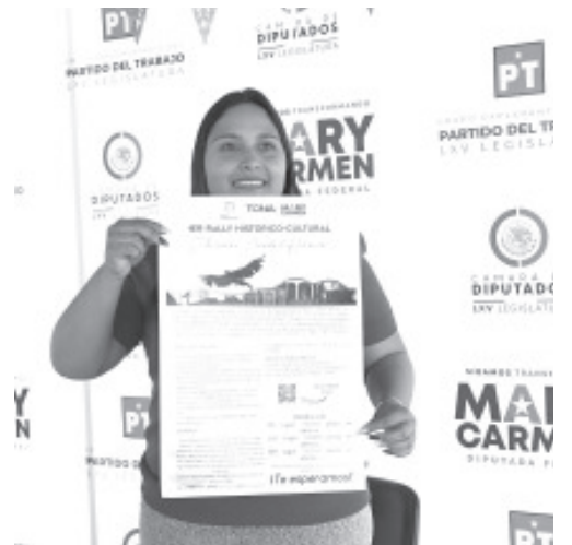
El próximo sábado 1 de octubre, se realizará en la ciudad el primer Rally Histórico Cultural; con él, se pretende promover los lugares emblemáticos del municipio.

Invitó a la población a participar en este evento, el cual se espera que sea divertido, además, agregó que tiene muchos proyectos a futuro en dónde se toma en cuenta a los jóvenes.