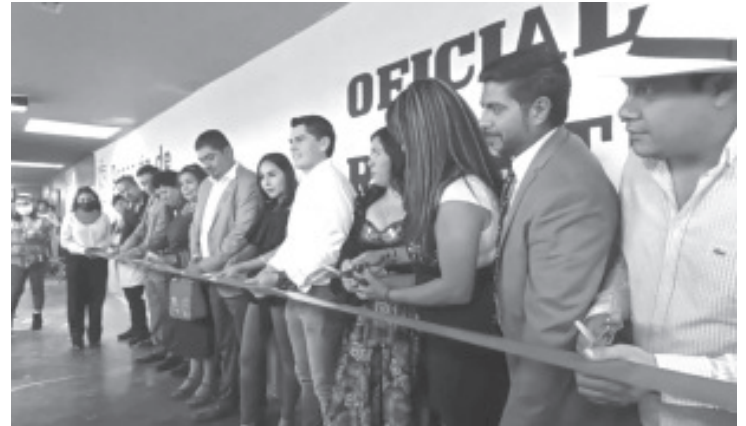
A partir de hoy, la parte alta del mercado Benito Juárez albergará la oficialía segunda del registro civil, la delegación regional de la Secretaría de Agricultura del Gobierno del Estado, la Supervisión Escolar Indígena y la oficina del sindicato de músicos.