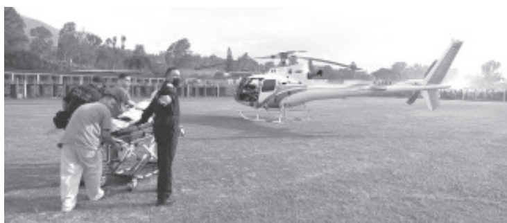
Derivado de un llamado de emergencia, paramédicos de la Secretaría de Seguridad Pública, adscritos a la Dirección de Servicios Aéreos, trasladaron exitosamente a una fémica que presentaba complicaciones de embarazo; desde el municipio de Tuxpan a la capital del estado.

En cumplimiento a la petición del gobernador del estado, Alfredo Ramírez Bedolla, las aeronaves de la SSP se mantienen a la orden de la ciudadanía en caso de requerir apoyo ante alguna calamidad, haciendo la solicitud a las líneas telefónicas de emergencia 911 y 089.