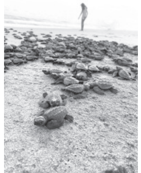
El Gobierno de Michoacán, a través de la Comisión de Pesca del Estado, entregó materiales y equipamiento a los 27 campamentos tortugueros que trabajan en la preservación y conservación de la tortuga marina.

Con estas acciones se va cumpliendo el compromiso que el gobernador Alfredo Ramírez Bedolla tiene con los campamentos de las comunidades indígenas y voluntarios que realizan actividades para proteger a la tortuga marina, que llega a las playas de Lázaro Cárdenas, Aquila y Coahuayana