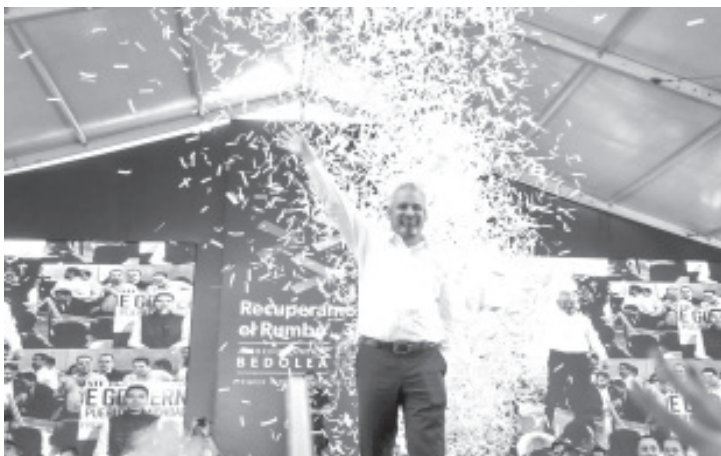
Arropado por michoacanas y michoacanos, que se dieron cita en la Plaza Valladolid en el marco del Primer Informe de Gobierno, el gobernador Alfredo Ramírez Bedolla afirmó que se logró recuperar a Michoacán con austeridad, honestidad y trabajo.