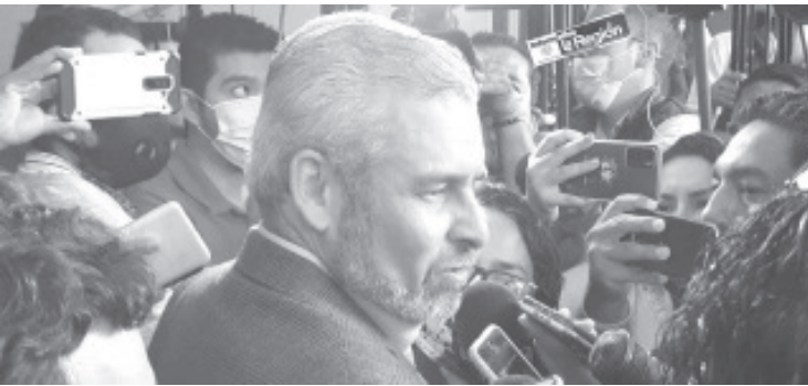
El gobernador del estado de Michoacán, Alfredo Ramírez Bedolla, comentó que la Fiscalía General del Estado (FGE) está a cargo del caso del triple homicidio que tuvo entre sus víctimas a Francisco Eduardo M.

Finalmente en un comunicado detalló "La FGE continúa con las investigaciones del caso que permitan su pleno esclarecimiento".