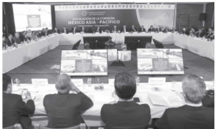
Integrar la Plataforma Logística del Pacífico mexicano y posicionar al Puerto de Lázaro Cárdenas como su Hub Logístico son objetivos del Gobierno de Michoacán.

Como responsable de esa importante comisión se estableció una agenda que contempla cinco ejes: infraestructura para el desarrollo; gobierno digital y simplificación administrativa; promoción; gobernanza, seguridad, certeza logística, así como vinculación y formación académica - laboral.