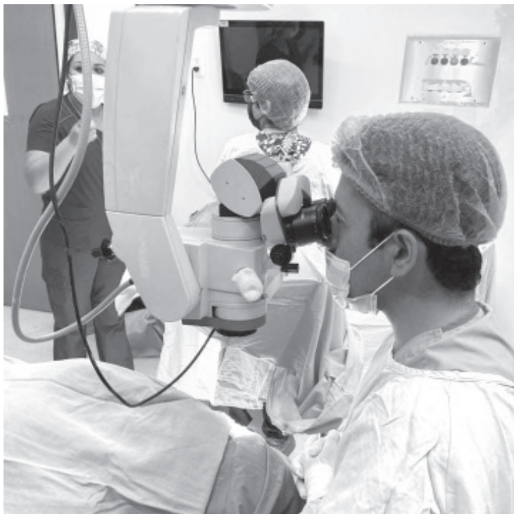
Las córneas extraídas de un donador fueron trasplantadas con éxito a dos pacientes que se encontraban en lista en espera, en el Hospital General "Dr. Pedro Daniel Martínez" de Uruapan.