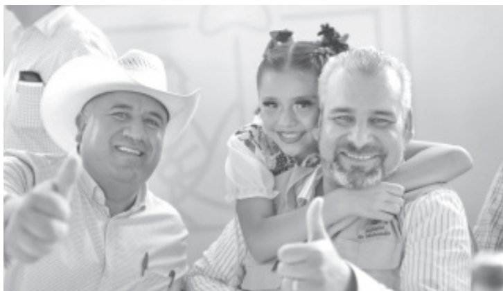
A casi un año del inicio del gobierno que encabeza Alfredo Ramírez Bedolla, presidentes municipales aseguran que la vocación municipalista del Gobierno de Michoacán es palpable en obras, acciones y recursos