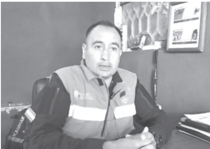
En punto de las 12:19 PM del próximo 19 del presente mes, a nivel nacional sonarán las alertas sísmicas para la realización del macro simulacro 2022.

Serrano Miralrío, agregó que ellos como PCE, el día del macro simulacro estarán evaluando el desempeño de los que se hayan registrado, en este sentido, refirió que en años pasados se han encontrado buenos aspectos de las brigadas, lo que quiere decir que se ha avanzado.