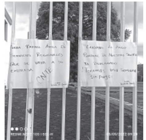
Integrantes del magisterio democrático tomaron este lunes las oficinas de Servicios Regionales Educativos.

Exhortó a las autoridades a reconsiderar la falta de pago, sobre todo porque en algunos casos, maestros iniciaron el ciclo escolar sin ningún tipo de pago.