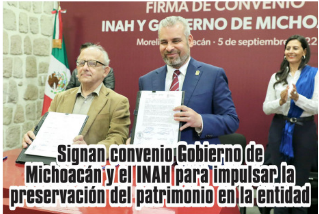
Signan convenio Gobierno de Michoacán y el INAH para impulsar la preservación del patrimonio en la entidad