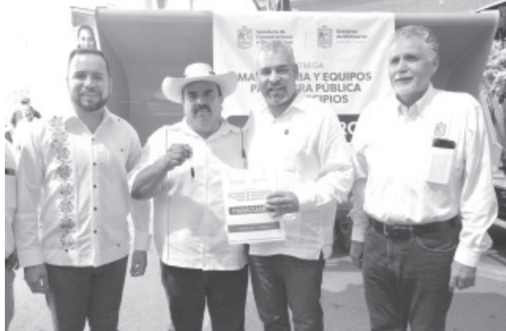
El gobernador Alfredo Ramírez Bedolla entregó maquinaria y equipo para obra pública a ocho municipios de Tierra Caliente y Región Tepalcatepec, con una inversión de 40 millones de pesos.

Informa que hoy lunes 5 de septiembre se realizó depósito a 8.9 millones de derechohabientes; el resto recibirá su pago a través de operativos del Banco del Bienestar, del 6 de septiembre al 3 de octubre