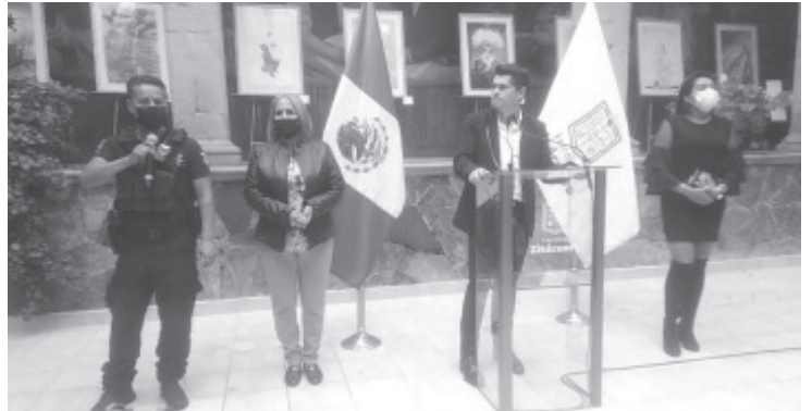
La Secretaría de Seguridad Pública Municipal desplegará un estado de fuerza de 350 a 400 elementos este 15 de septiembre, en el marco de los festejos por el CCXII Aniversario del Inicio de la Independencia de México.

En dicho operativo coordinado se desplegarán un estado de fuerza de 350 a 400 elementos, adscritos a la Heroica Policía Municipal para llevar a cabo las festividades patrias, dicha acción policial pretende también proteger a aquellos que asistan a la Plaza Cívica Lic. Benito Juárez García, con la finalidad de evitar la comisión de ilícitos o actos vandálicos que alteren el orden público.