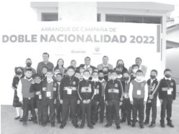
El evento se desarrolló en la Escuela Primaria Francisco I. Madero, donde participaron funcionarios del ayuntamiento de Zitácuaro, autoridades de la institución educativa, estudiantes y madres y padres de familia.