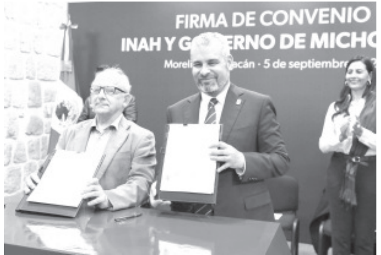
El gobernador, Alfredo Ramírez Bedolla y el director general del Instituto Nacional de Antropología e Historia (INAH), Diego Prieto Hernández, signaron un convenio de colaboración interinstitucional

Al término del evento, se hizo la entrega simbólica de maquinaria y equipo de mantenimiento para zonas arqueológicas en Huandacareo y Tzintzuntzan.