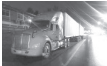
La FGE en menos de 24 horas recuperó dos tracto camiones con contenedores y mercancía, que el pasado 29 de agosto fueron robados.

La FGE reafirma su compromiso de llevar ante los tribunales a quien atente contra el patrimonio de las personas en Michoacán.