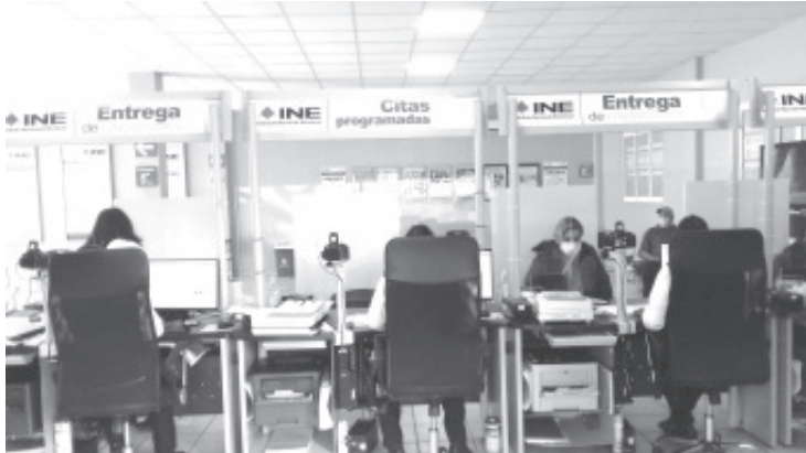
La credencial para votar tiene una vida útil de 10 años después de su expedición, por ello todas las que su vigencia es el 2022 deben ser renovadas antes del 31 de diciembre.

- Más de 9 mil credenciales para votar correspondientes al distrito 03 perderán vigencia el 31 de diciembre de 2022 si no son renovadas.