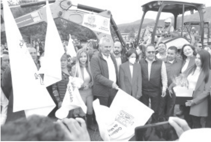
El gobernador Alfredo Ramírez Bedolla, dio el banderazo de arranque de la primera etapa de construcción de colectores para el saneamiento de agua de la Presa Mata de Pinos.