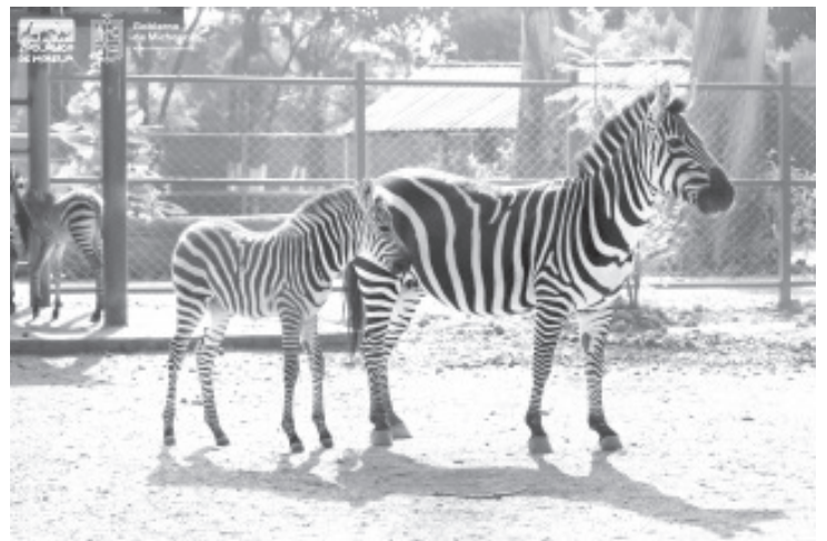
Las rayas de las cebras son inconfundibles y detrás de ese manto rayado hay mucho más. La sabana africana puede estar muy cerca de ti si visitas el Parque Zoológico “Benito Juárez”.

El Gobierno de Michoacán, te invita a que este fin de semana conozcas en familia el albergue de las cebras en el Parque Zoológico “Benito Juárez” en un horario de 10:00 a 17:00 horas.