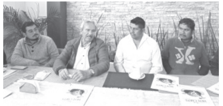
En conferencia de prensa, líderes del transporte foráneo exhortaron a las autoridades a tomar cartas en el asunto, y cancelar las concesiones otorgadas a finales de la administración estatal anterior.

Estuvieron presentes representantes de las rutas de Toma de Agua, La Soledad, Macho de Agua, Zirahuato, Mesa de Cedano, Aputzco, Valle Verde, Carpinteros, El Naranjo.