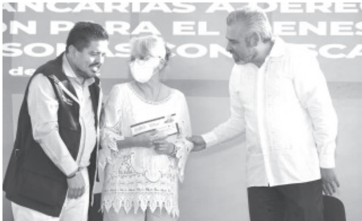
Con una inversión superior a los 29 mil millones de pesos anuales, los programas sociales del Gobierno de la República benefician a un millón 97 mil 694 michoacanos, afirmó el gobernador Alfredo Ramírez Bedolla.

- Actualmente, uno de cada cuatro michoacanos es beneficiario de algún programa para el Bienestar.