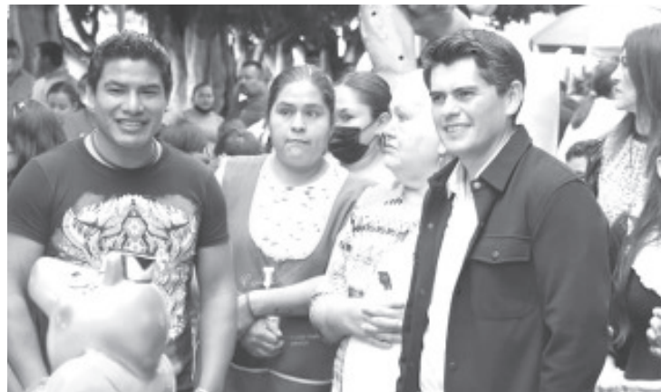
Zitácuaro es un municipio históricamente dedicado a la labor mercantil comentó el edil.