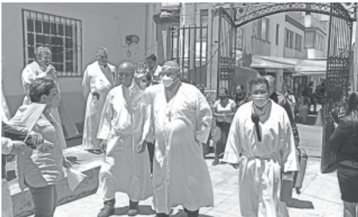
Ante los feligreses, Monseñor Carlos Garfias Merlos, pidió a todos aprovechar este día para acercarse a la virgen, confiarle aquello que les causa preocupación y además dar gracias por permitir seguir adelante.

Además recordó las afectaciones que ha traído la pandemia a la salud de muchas personas, por ejemplo en su caso lo mantuvo hospitalizado, grave, luego en un largo periodo de recuperación, que le impidió desarrollar sus funciones.