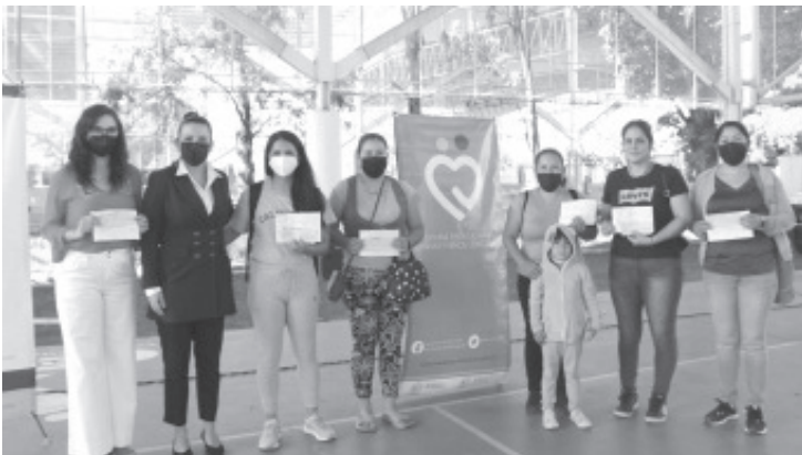
La Secretaría del Bienestar (Sedebi) del Gobierno de Michoacán realizó la quinta entrega de apoyos económicos a beneficiarios del programa para el Bienestar de Familias Cuidadoras de Niñas y Niños con Cáncer.

Recordar que estos apoyos mensuales ascienden a la cantidad de 4 mil pesos y tienen el objetivo de apoyar a las familias a solventar sus gastos de alimentación y traslados, entre otros, en tanto sus hijas o hijos se encuentren en tratamiento y hasta su tercer año de vigilancia médica en alguno de los hospitales del sector público.