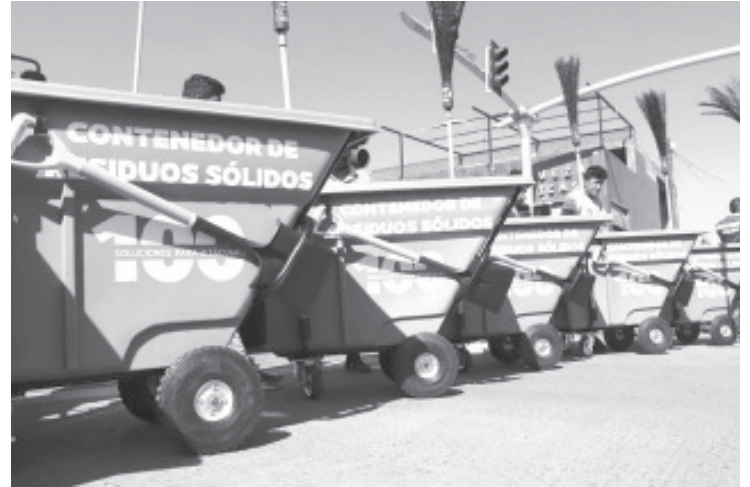
Hoy presentó el alcalde 2 nuevas barredoras que por su dimensión y tecnología, eficientarán los trabajos de aseo en las principales calles y avenidas de nuestra ciudad, también entregó contenedores nuevos al personal del sistema de Limpia.