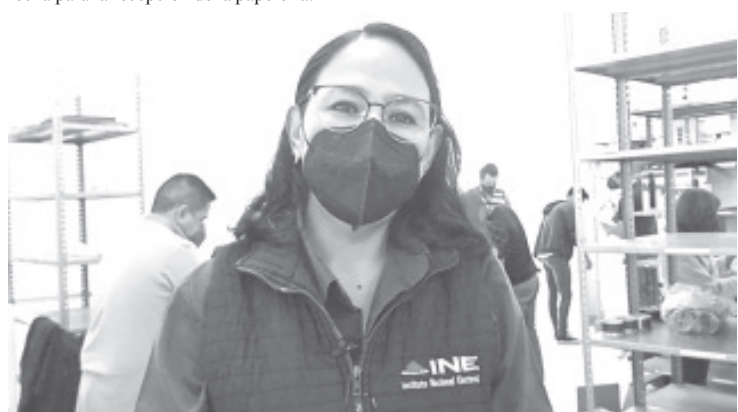
La papelería será donada a la Comisión Nacional de Libros de Texto Gratuitos (CONALITEG), mientras que las cajas que estén en buenas condiciones.