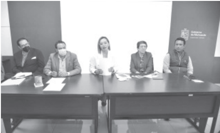
Ante las autoridades judiciales se estará interponiendo la denuncia contra quien resulte responsable de la sustracción de los documentos oficiales.

La SEE dio la instrucción de agilizar los trámites para que la siguiente semana se tengan nuevamente los documentos de estos cambios, con los que se busca llevar docentes a las zonas en que se requieren, de acuerdo también a las necesidades de maestras y maestros que buscan moverse a otra escuela, y siguieron el proceso correspondiente.