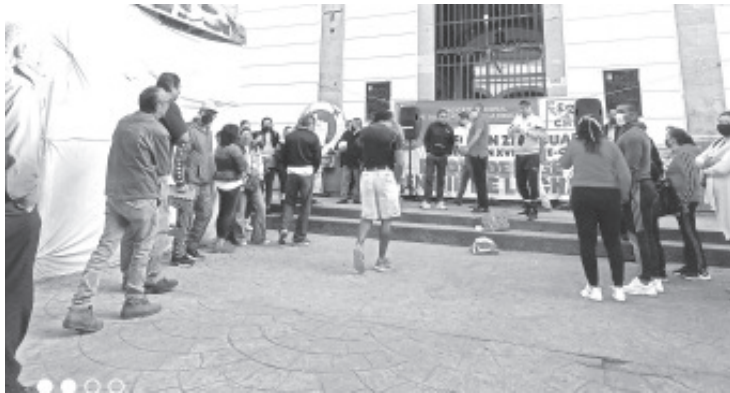
Maestros de la Coordinadora Nacional de Trabajadores de la Educación (CNTE), Grupo Poder de Base, tomaron la presidencia municipal e impidieron el funcionamiento de las distintas dependencias ubicadas en el palacio del gobierno local.

Entre las leyendas que se pudieron leer en las pancartas pegadas en las puertas de la presidencia municipal estuvieron: "Donde hay un niño, que exista un maestro; contratación de maestros generación 19, 20, 21 y 22", "Yarabi nuestro salario no es negociable ¡Pago inmediato!", "Exigimos pago inmediato del salario a los maestros", entre otros.