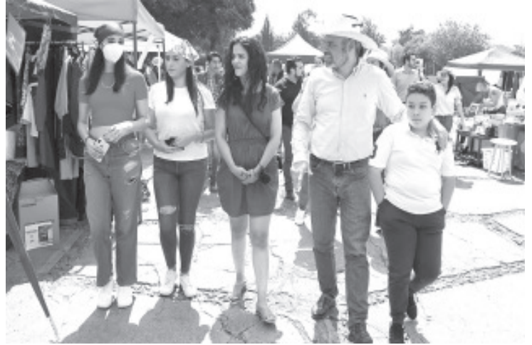
Se ofertaron desde artesanías hasta bisutería, ropa, juguetería, productos naturales, plantas, manualidades, entre otros.