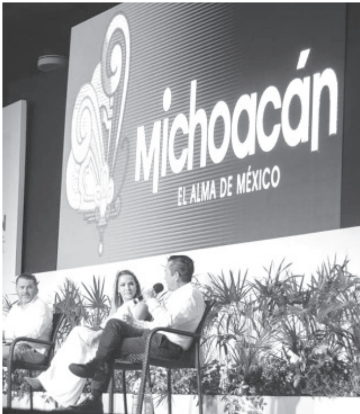
El World Tourism Trends Summit es un evento orientado a la búsqueda de soluciones e implementaciones tecnológicas encaminadas a mejorar la experiencia de los viajeros.

Destacó que el foro de este año comprendió tres días de actividades en los que se presentaron 17 conferencias, con 500 asistentes presenciales y un número similar de asistentes virtuales.