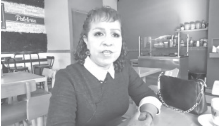
El próximo examen es el 29 de octubre y los médicos interesados en presentarlo, tienen hasta el 30 del mes de septiembre para registrarse.

- Consejo estatal invita a profesionales de la salud a mejorar su formación