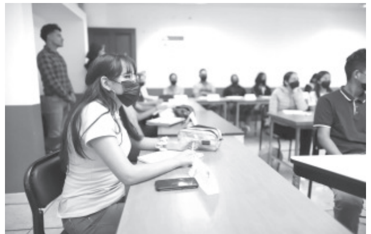
La institución educativa, que cuenta con tres planteles en Morelia, Zitácuaro y Lázaro Cárdenas, logró atraer para este nuevo ciclo escolar a más de 2 mil 300 estudiantes en licenciaturas, maestrías y doctorado.

Finalmente, recordó el compromiso del gobernador Alfredo Ramírez Bedolla de llevar la educación superior a todos los rincones del estado, por lo que en próximos días estarán abriendo nuevas sedes en distintos municipios.