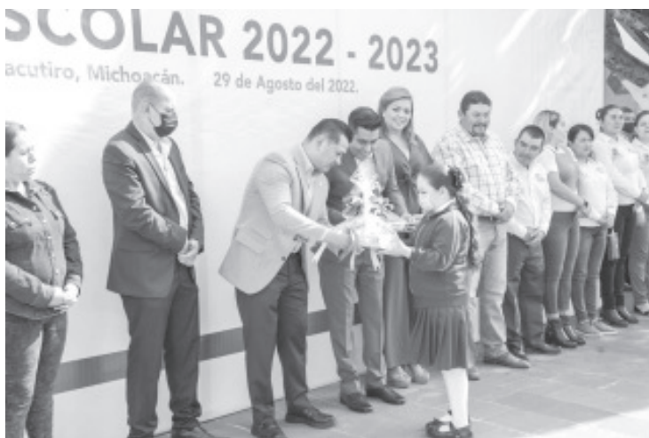
“Como en todo México, hoy inicia un nuevo modelo de transformación educativa, la Nueva Escuela Mexicana en Michoacán, promueve el trabajo colaborativo, la pedagogía crítica y el aprendizaje autónomo”.