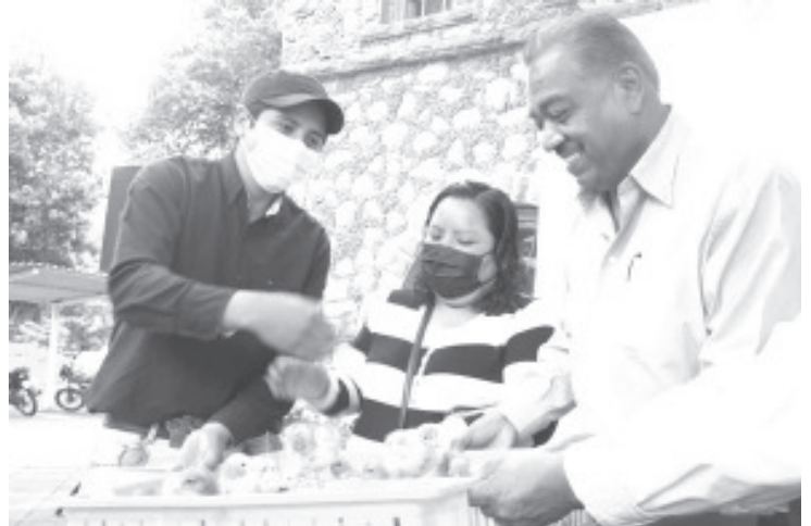
El Gobierno de Toño Ixtláhuac a través de la Secretaría de Agronomía y Medio Ambiente, entregó 2 mil aves de traspatio a 200 familias de diferentes comunidades,

Aseguró que en este ejercicio fiscal seguirá habiendo más obra pública, prioritariamente, con servicios básicos y acciones que favorezcan a las localidades que más necesidades tienen.