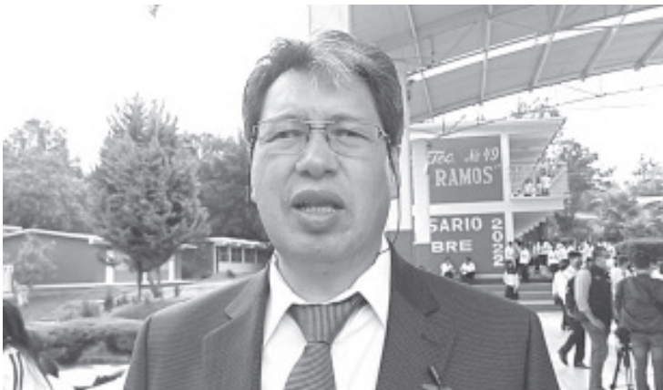
Durante esta semana se tendrá una reunión con supervisores escolares, padres de familia y todos los involucrados para ver la posibilidad de atender el tema.