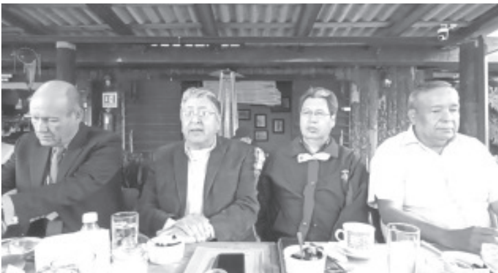
Gracias al trabajo conjunto de diferentes instancias de gobierno, ningún alumno de la Escuela Secundaria Técnica 105 de Valle Verde perdió el año, todos van a recibir su certificado.