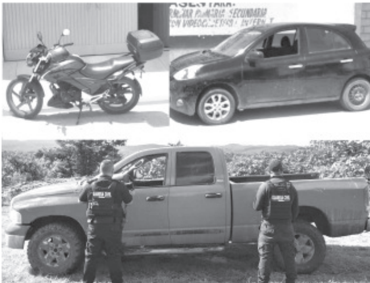
Elementos de la Secretaría de Seguridad Pública (SSP), aseguraron tres vehículos con reporte de robo; hechos registrados en Uruapan, Huetamo y Tangancicuaro.

Las tres unidades y el masculino, quedaron a disposición de la autoridad competente, a fin de llevar a cabo las diligencias que marca la Ley. La SSP a través de la Guardia Civil se mantiene a la orden de la ciudadanía en caso de presentar daños a sus bienes, a través de las líneas de emergencia 911 y 089.