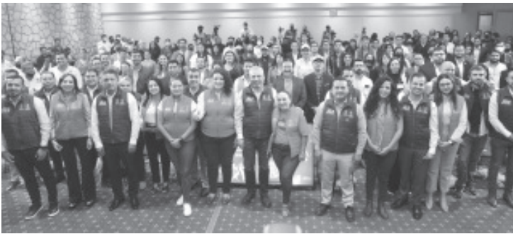
El Gobierno de Michoacán realizará un “escucha” de la voz propia de la juventud para posteriormente planear programas y políticas en este sector.

Jóvenes serán escuchados sin tabús, críticas y discriminación, enfatiza Gobernador