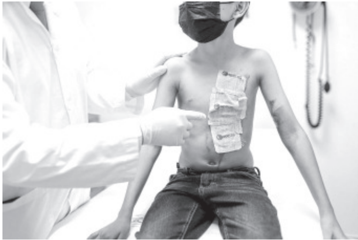
El Instituto Mexicano del Seguro Social (IMSS) en Chiapas, inició la aplicación de un tratamiento basado en aloinjerto de epidermis humana, un moderno procedimiento de trasplante de tejidos cultivados in vitro.

A fin de lograr una pronta recuperación en pacientes con quemaduras superficiales de segundo grado, así como evitar infecciones, mejorar la cicatrización y disminuir el dolor, el Hospital General de Zona (HGZ) No. 1 “Nueva Frontera”, del Instituto Mexicano del Seguro Social