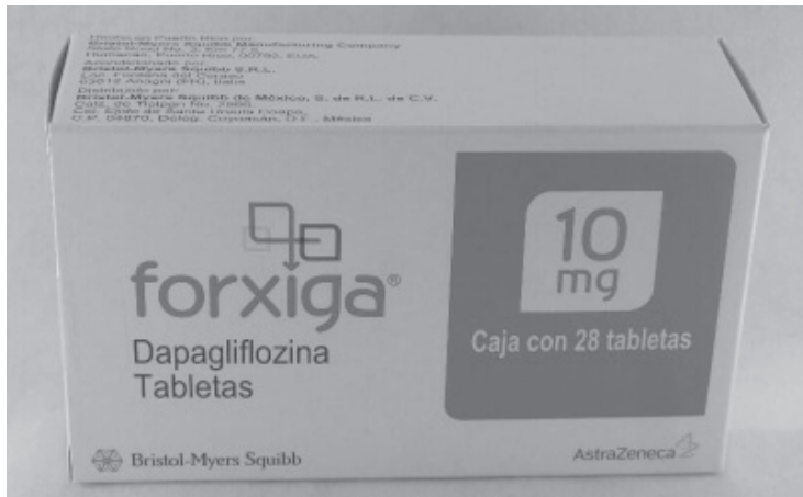
La SSM continuará con las acciones de vigilancia para evitar que los productos, empresas o establecimientos incumplan con la legislación sanitaria vigente y no representen un riesgo a la salud de la población.

La SSM continuará con las acciones de vigilancia para evitar que los productos, empresas o establecimientos incumplan con la legislación sanitaria vigente y no representen un riesgo a la salud de la población. Ya se dio aviso a las ocho jurisdicciones sanitarias para que realicen la búsqueda intencionada de este producto en la entidad.