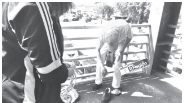
Luego de calmar al señor, los uniformados lo trasladaron al área de barandilla para recibir ayuda psicológica y determinar la mejor manera en la que se le dará seguimiento a su caso para evitar alguna situación similar.

Realizamos estudios de Electroencefalograma