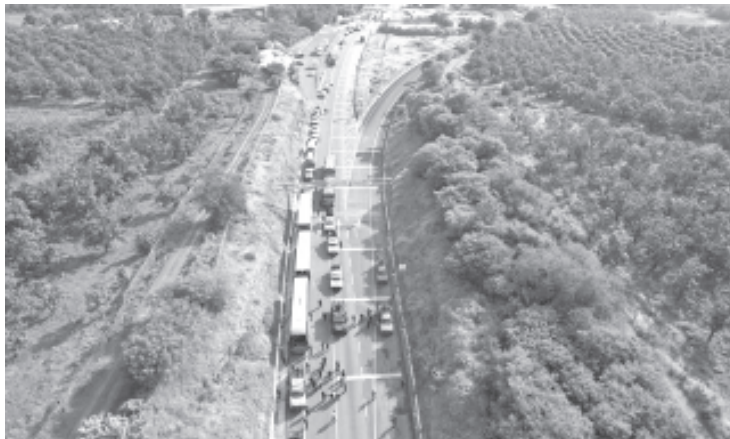
La Secretaría de Seguridad Pública (SSP), brindó apoyo a la Coordinación del Sistema Penitenciario para el traslado desde el municipio de Charo de 154 detenidos, los cuales fueron ingresados al Centro Penitenciario de Apatzingán;

La SSP en coordinación con las autoridades estatales y federales no bajan la guardia para garantizar el Estado de Derecho en el territorio michoacano a través de acciones firmes que permitan la recuperación de espacios e inhibir la comisión de conductas delictivas.