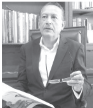
El 23 de julio de 2022, la Organización Mundial de la Salud declaró el brote de viruela símica como una emergencia de salud pública de importancia internacional.