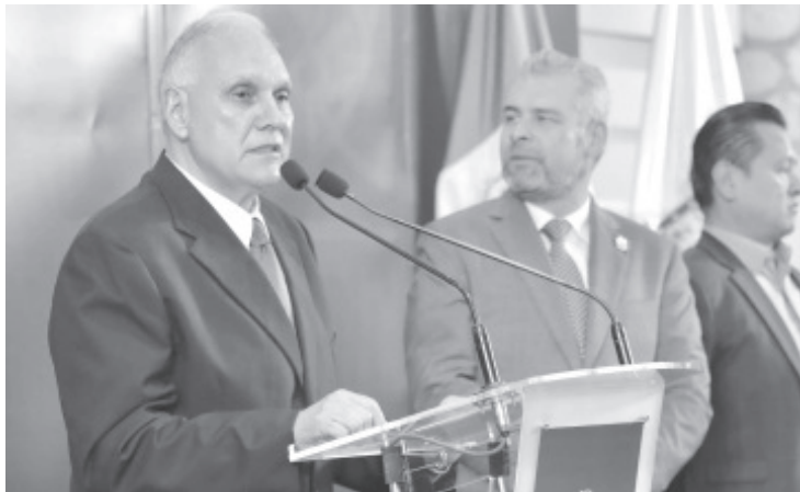
Con el cambio de cobro de cheque a tarjeta en la Secretaría de Educación del Estado (SEE), se ahorrarán 100 millones de pesos al año, lo que alcanzaría para construir más de 200 aulas didácticas equipadas.

- Serán alrededor de 55 mil maestros los que cobren con tarjeta, a finales de agosto.