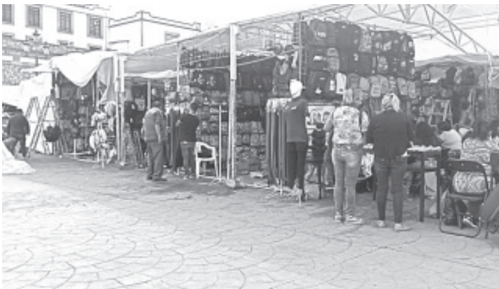
Ya se encuentra instalada la Feria Escolar de este año en el jardín central; comenzó el pasado domingo 21 y concluirá el miércoles 31 de agosto.

Agradeció la confianza y preferencia de padres de familia y los invitó a conocer la variedad que tienen, con la Feria Escolar hay para todos los gustos y para todas las economías.