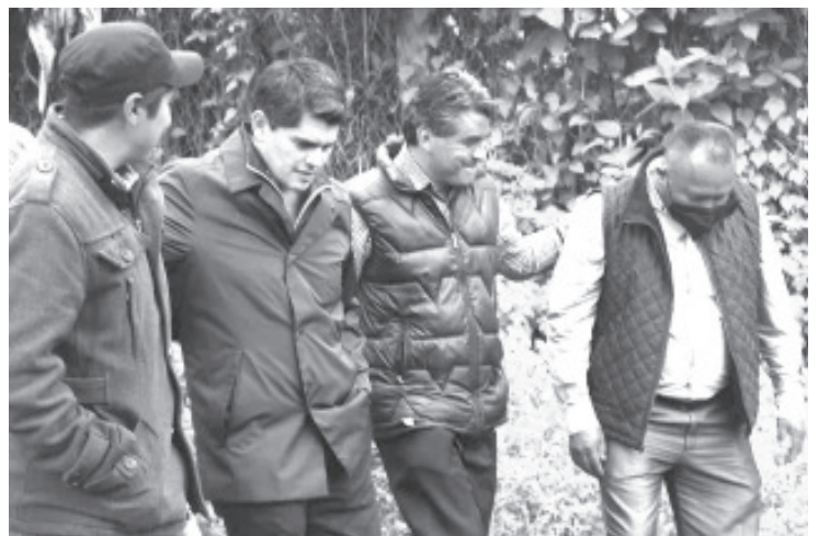
"Servicios básicos para todos, es el objetivo de nuestro #GobiernoDeSoluciones", refirió el presidente municipal. Dijo que aún hay muchas localidades de Zitácuaro, que no cuentan con alumbrado, agua potable o drenaje.

La obra entregada, incluye lámparas, postes de concreto de 12 metros de alto, un transformador y lámparas led que beneficiarán a decenas de familias.