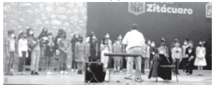
La presentación de este coro será a las 6:00 de la tarde en el teatro Juárez, además también se tendrá la participación de los coros Cenzontles del Tepeyac y Ágape, procedentes de la Ciudad de México.