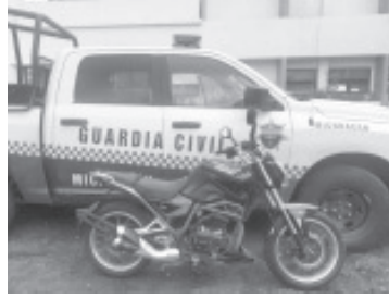
Elementos de la Secretaría de Seguridad Pública (SSP), lograron asegurar dos motocicletas con reporte de robo, hierba verde seca, al parecer marihuana y pastillas de medicamento controlado.

Los tres indiciados, así como los vehículos y droga asegurada, fueron puestos a disposición de la autoridad competente a efecto de llevar a cabo las diligencias que marca la Ley. La SSP pone a disposición de la ciudadanía las líneas de emergencias 911 y 089, en caso de denunciar cualquier acto que vulnere su salud y seguridad.