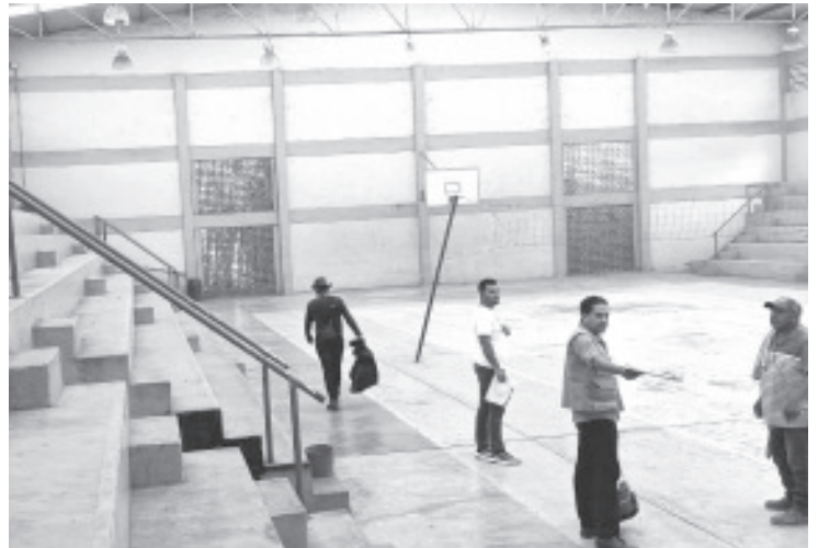
La Comisión Estatal para la Protección contra Riesgos Sanitarios (Coepris), ya verificó que los cuatro albergues habilitados en el Oriente del Estado, sean aptos para el refugio temporal de los ciudadanos.

En recorrido por el conjunto habitacional, acompañado del personal del área técnica y jurídica del instituto, el funcionario estatal invitó a los habitantes a confiar en las autoridades y unir esfuerzos "para consolidar las acciones hacia la escrituración de sus viviendas".