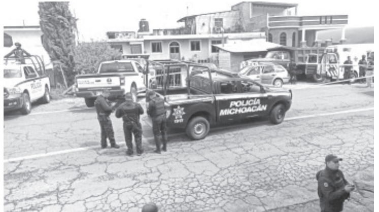
Una persona fallecida y varios heridos, fue el saldo de un incidente entre habitantes de la tenencia de Crescencio Morales, el hecho causó la movilización de los distintos cuerpos de seguridad de la región.

Hay que mencionar que desde que se conformó el consejo del denominado Autogobierno, este tema mantiene dividida a la población de Crescencio Morales, en varias ocasiones se ha llegado al enfrentamiento.