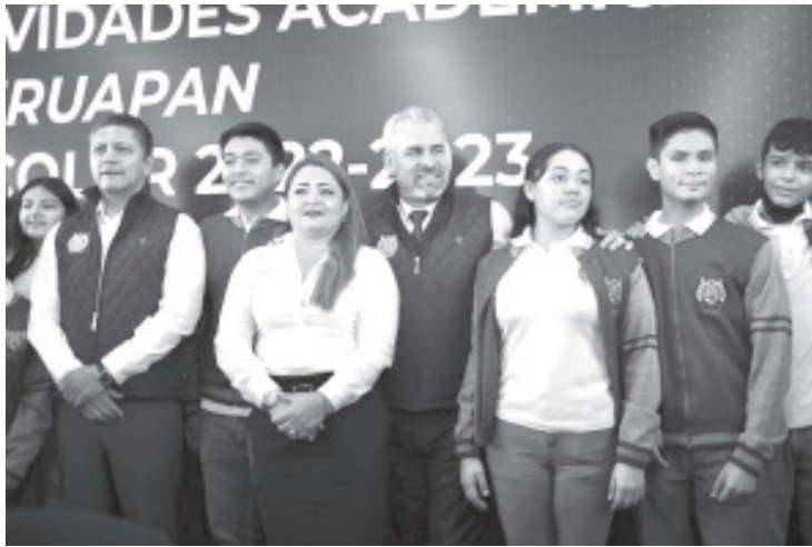
Después de 12 años en que estuvo abandonado, el gobernador Alfredo Ramírez Bedolla puso en operación el Campus de la Universidad Michoacana de San Nicolás de Hidalgo en Uruapan.

*Uruapan, Michoacán, 15 de agosto de 2022.-* Después de 12 años en que estuvo abandonado, el gobernador Alfredo Ramírez Bedolla puso en operación el Campus de la Universidad Michoacana de San Nicolás de Hidalgo en Uruapan, por lo que jóvenes de la región ya pueden contar con 6 carreras como alternativa para realizar estudios de