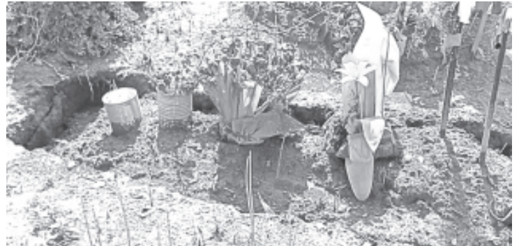
Por la temporada de lluvias, continúa el hundimiento de tumbas en el Panteón Municipal San Carlos así como el crecimiento de hierba y pasto en diferentes zonas.

común que durante todo el año no se presenten, sino hasta Día de Muertos.