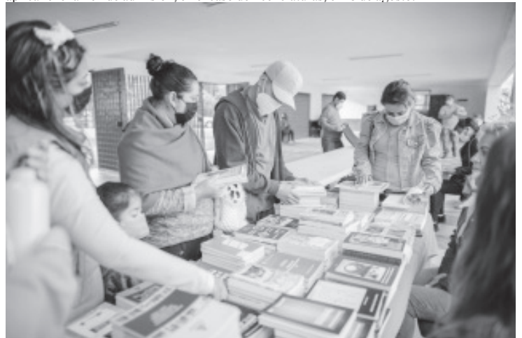
IMCED amplió hasta el 17 de agosto su convocatoria de nuevo ingreso para licenciaturas y maestrías.

El registro se hace en línea en: https://imced.edu.mx/ a más tardar el 17 de agosto, para aplicar el examen de admisión, en el caso de licenciaturas, el 18 de agosto.