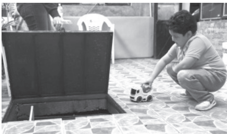
La SSM exhorta a la población a tomar precauciones y no dejar solos a niños en el hogar, sobre todo en temporada vacacional, debido a que los accidentes ocurren cuando hay algún descuido.