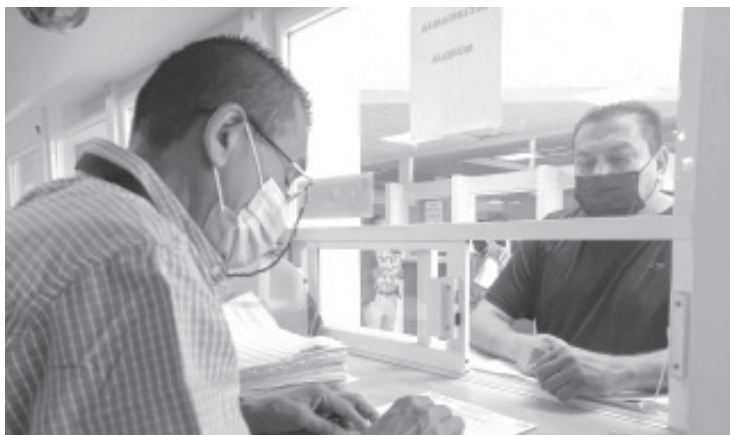
La Secretaría de Educación del Estado (SEE) informa que esta primera quincena de agosto se están destinando más de 458 millones y medio de pesos al pago de retroactivo.

En total, este lunes comenzaron a ser dispersados mil 199 millones 453 mil 748 pesos, que incluyen la quincena 15 del año y el retroactivo, que representa 38.2% del total del recurso destinado al magisterio en esta ocasión.