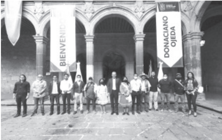
El gobernador Alfredo Ramírez Bedolla, restableció la relación del Gobierno de Michoacán con las comunidades mazahuas de Crescencio Morales y de Donaciano Ojeda, ambas del municipio de Zitácuaro.

- El gobernador trabaja en colaboración con comunidades de Crescencio Morales y Donaciano Ojeda