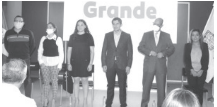
El presidente municipal destacó que Gobierno Digital tiene como objetivo acelerar la atención, a través de la digitalización con mecanismos esenciales.