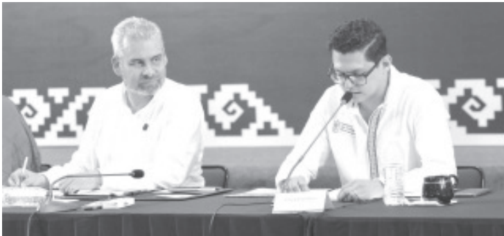
Ramírez Bedolla señaló que los artesanos son un sector productivo determinante para el desarrollo económico de Michoacán.

•Organismo dará impulso al sector artesanal como motor de desarrollo para comunidades y regiones de Michoacán