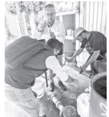
En las zonas afectadas por la inundación en Jungapeo, brindan atención a los habitantes con la cloración de 250 mil litros de agua.

Las recomendaciones que estas brigadas emiten a la población son necesarias para que las familias que sufrieron encharcamientos esperen a que baje el agua de lluvia del interior de sus hogares y una vez que esto ocurra laven pisos y paredes con jabón y cloro, antes de volverla a habitar, y hacer lo mismo con los encerres domésticos y trastes antes de utilizarlos para preparar alimentos, a efecto de evitar las infecciones gastrointestinales.