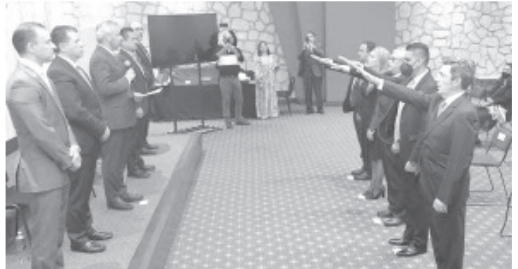
El mandatario recordó que el Gobierno de Michoacán, en coordinación con el Colegio de Notarios, garantizará que los nombramientos sean de forma transparente y en apego a la ley.