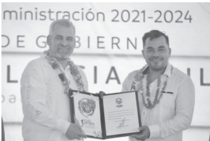
El gobernador Alfredo Ramírez Bedolla invitó a presidentas y presidentes municipales para que en alianza y equipo, se trabaje por el desarrollo social y económico en beneficio de la ciudadanía.

*Aquila, Michoacán, 10 de agosto del 2022.-* El gobernador Alfredo Ramírez Bedolla hizo un llamado a presidentas y presidentes municipales para que en alianza y equipo, se trabaje por el desarrollo social y económico en beneficio de la ciudadanía.