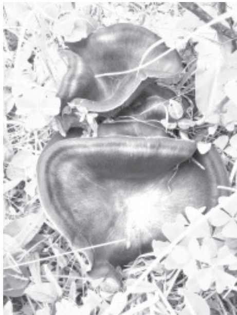
La presidenta municipal comentó que se invirtieron cerca de 220 mil pesos en este evento y se espera recibir a más de 5 mil visitantes por día.

La Expo FERIA del Hongo es uno de los eventos de mayor importancia en la región, reconocida a nivel internacional.