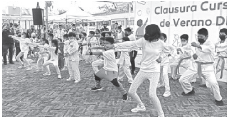
Durante el evento algunos de los participantes hicieron una demostración de lo aprendido durante los cursos de verano del DIF.