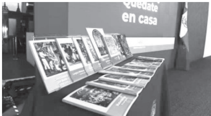
Comenzó la distribución de los libros de texto gratuitos en el nivel básico en el oriente como parte de los preparativos del ciclo escolar 2022-2023.

De la región Zitácuaro son 205,000 paquetes de útiles escolares, Región Hidalgo 97,750 y para la Región Maravatio 146,500