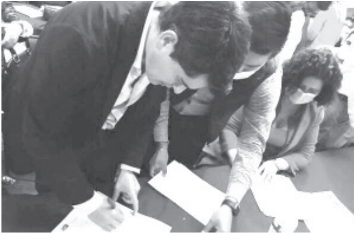
Ante representantes de la ASF, el presidente Ixtláhuac reiteró el compromiso de trabajar eficientemente y con disciplina financiera, en favor de los zitacuarenses.

-Auditorías Colmena, supervisará ejecución de participaciones de la federación en Zitácuaro.