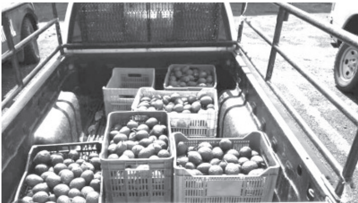
Los elementos de la Secretaría de Seguridad Pública (SSP), lograron detener a una persona del sexo masculino, quien operaba una unidad que transportaba cajas de plástico con aproximadamente 120 kilos de aguacate, al parecer ilegal.

En caso de presenciar algún hecho constitutivo del delito, las líneas telefónicas 911 y 089 se mantienen al servicio de la población las 24 horas del día.