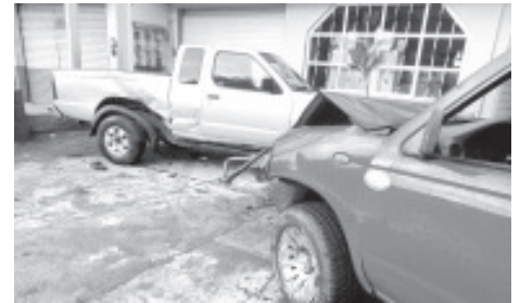
El siniestro ocurrió a la altura del restaurante La Palma, en la Colonia del mismo nombre, donde quedaron dañadas tres camionetas de la marca Nissan, una cuatrimoto de la marca Vento y un autobús Irizar.

De los hechos tomó conocimiento personal de Tránsito municipal y de la Guardia Civil. Al momento se desconoce cuál fue la cinemática oficial del accidente.