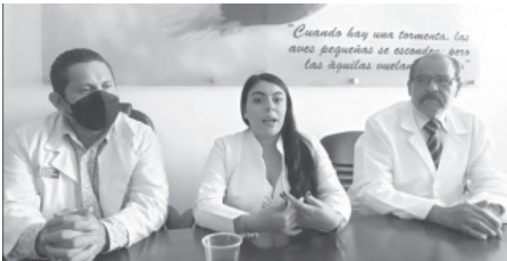
El Hospital Regional ha realizado en promedio 250 estudios de mastografías. Dicha cifra es muy baja, en comparación a lo que se esperaba y de acuerdo al índice poblacional.

El estudio se realiza los días martes, jueves y viernes; con previa cita al número 7151186160 en un horario de 9:30 de la mañana a 1:00 de la tarde. Éste es completamente gratuito, el único requisito es identificación del INE así como acudir con las axilas depiladas, sin cremas o desodorantes y haberse bañado. Asimismo, después de hacerse el estudio se les entregará una interpretación así como el tratamiento que debe tener en caso de requerirse.