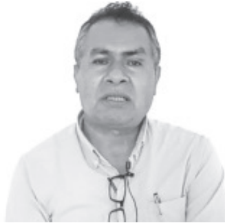
La actividad será en el estacionamiento de la Unidad Operativa que se encuentra en la calle Cuauhtémoc, en un horario de 9:00 de la mañana a las 3:00 de la tarde.

Como responsable de la oficina del empleo a nivel local, recalco que si bien es cierto, que