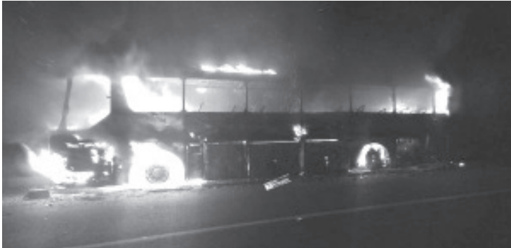
Un autobús ardió en llamas sobre la Autopista Siglo XXI, sin que por fortuna se registraran personas heridas.

Posteriormente los agentes de la Guardia Nacional de la División Seguridad en Carreteras e instalaciones, efectuaron los correspondientes peritajes y con apoyo de una grúa retiraron el ómnibus quemado. Siendo reestablecida la circulación.