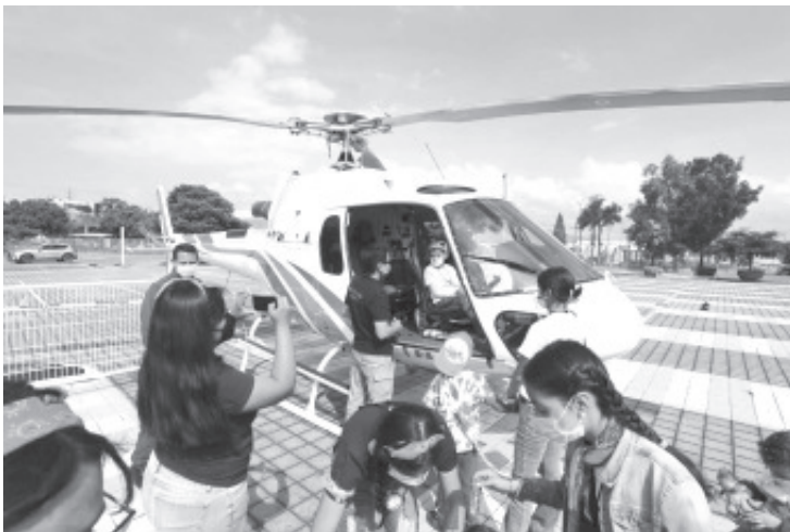
Desde el inicio las y los participantes, se mostraron muy contentos y efusivos por ver el helicóptero de la Guardia Civil con el que el personal de la SSP realiza los traslados médicos de emergencia.

La nueva Guardia Civil se distingue por ser más humana y más cercana a la ciudadanía, donde la prioridad es siempre velar por su bienestar y generar condiciones para que se desarrollen de manera sana y plena, aunado a ello se encuentra a su servicio en las líneas de emergencias 911 y 089.