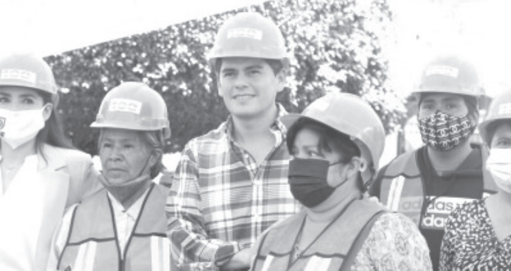
La Brigada Heroica, de la colonia Pueblo Nuevo, recibió de manos del alcalde Toño Ixtláhuac equipamiento y tarjetas bancarias.

El presidente municipal destacó que continuará la dotación de equipo y recursos a las demás cuadrillas desplegadas en todo el municipio. Reconoció que es una ardua labor la limpieza para evitar inundaciones, pero es una tarea noble que prevendrá muchos siniestros.