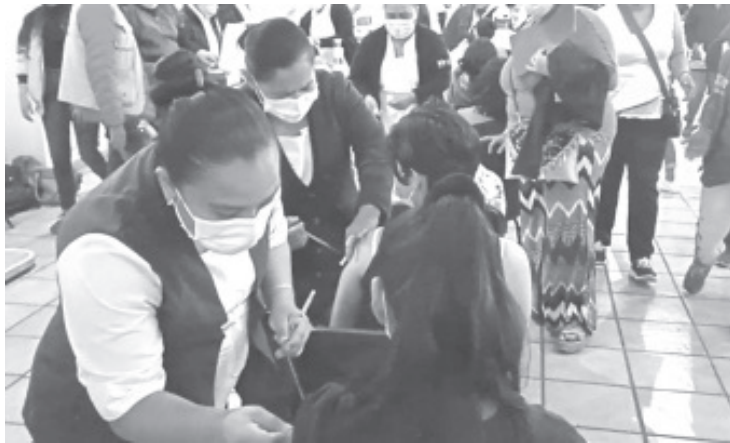
Cientos de menores de 12 a 17 años respondieron al llamado del sector salud y del gobierno federal y acudieron a vacunarse contra el covid-19.

Los requisitos básicos como en todas las jornadas fueron: registro de vacunación, acta de nacimiento y por ser menores de edad, estar acompañados de un adulto.