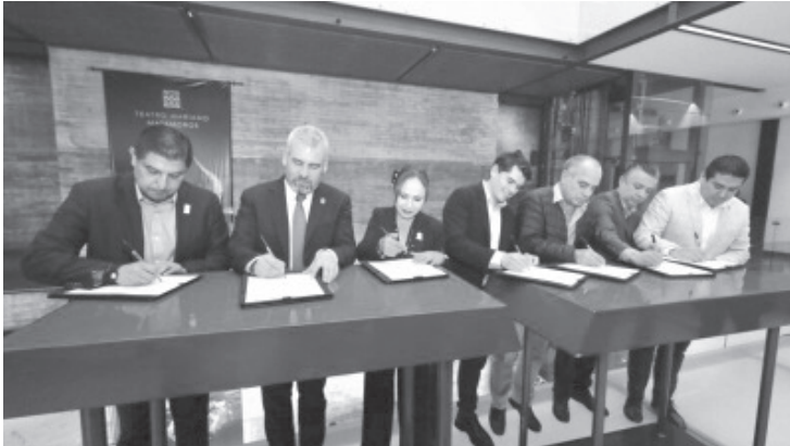
El Gobierno de Michoacán, a través de la Secretaría de Finanzas y Administración (SFA), signó convenios de colaboración y escrituración con el sector empresarial.

Morelia, Michoacán, 03 de agosto del 2022.- El Gobierno de Michoacán, a través de la Secretaría de Finanzas y Administración (SFA), signó convenios de colaboración y escrituración con el sector empresarial para fortalecer la economía y turismo en la entidad.