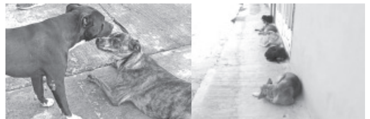
La oficina de Control Animal recibe todos los días de 4 a 5 reportes de agresión de perros, dicha cifra es preocupante.