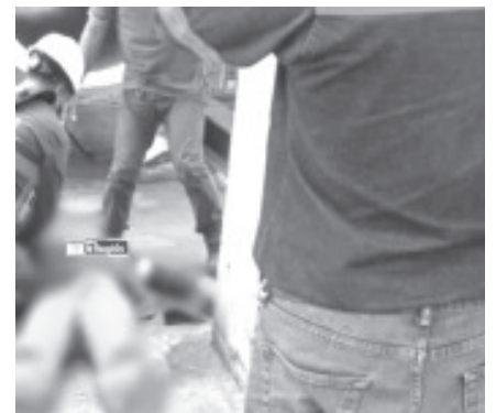
Sus compañeros, quienes llamaron al servicio de emergencia de la empresa, cuyos socorristas realizaron al obrero y vieron que ya no presentaba signos vitales.

Al momento se desconocen las causas oficiales del deceso.