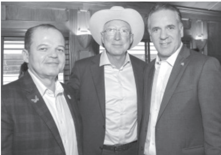
Medina González externó que la ruta de ese gran ferrocarril que traslada mercancías del puerto michoacano a destinos de Estados Unidos de América y Canadá demuestra la fortaleza del T-MEC.

En el evento, en el que se dio el banderazo a la locomotora #4721 o del Bicentenario, Medina González saludó al embajador de Estados Unidos en México, Ken Salazar, quien le expresó el interés de visitar Michoacán en fecha próxima.