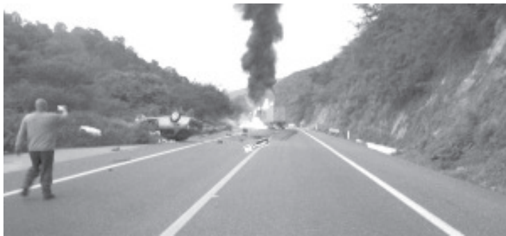
Paramédicos confirmaron el deceso del ocupante de un coche, con placas de Guerrero, fue necesaria la intervención de bomberos ya que la pesada unidad ardió en llamas.

Elementos de la Guardia Nacional de la División Seguridad en Carreteras apoyaron en dar seguridad perimetral durante las labores de auxilio. De lo sucedido se dio aviso a la Fiscalía General del Estado, cuyo personal se hizo cargo de las correspondientes averiguaciones.