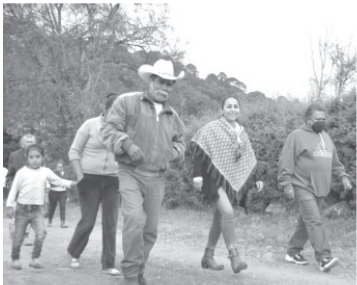
Se debe apoyar desde la Federación a los Santuarios así como a las familias que se dedican al cuidado y protección de la misma, indicó la diputada.

Si bien el cuidado y preservación de los Santuarios de la Mariposa Monarca obedece a razones fundamentalmente ambientales, también tiene alcances de tipo económico por la derrama que el turismo genera en estos lugares.