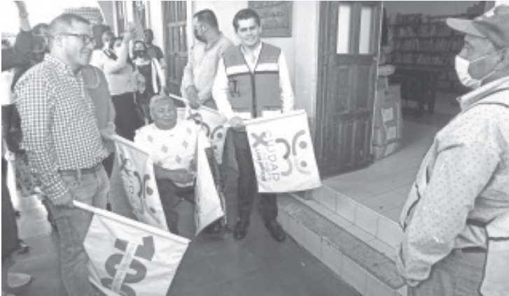
Los trabajos consisten en pintura general, construcción de una escalera para subir a la azotea, luminarias, lámparas, puerta, y kiosco digital que estará en el área de los portales.

- En diciembre este lugar cumple 70 años