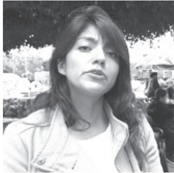
Este viernes se llevó a cabo una jornada de reforestación en el lugar conocido como Las Canoas, perteneciente a la tenencia de Nicolás Romero, en dónde se piensa plantar 160 mil arbolitos.

La acción se realizó de forma conjunta con la comunidad y ejido de Nicolás Romero, así como con la participación de Nación Verde, que está muy interesada en contribuir en restaurar el bosque de esta zona.