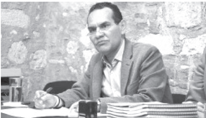
A partir del lunes los ayuntamientos y Concejos Municipales, contarán con un plazo de 15 días para turnar a los Poderes Ejecutivo y Legislativo del Estado, sus respectivos informes de gobierno.

El Auditor Superior de Michoacán destacó la importancia de que el informe que se rinda a la ciudadanía y se turne a los Poderes Ejecutivo y Legislativo, sea objetivo y preciso, que permita una clara comprensión de los alcances de las acciones gubernamentales.