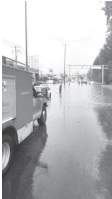
Las labores de atención se realizan en coordinación con las autoridades municipales a fin de atender las contingencias derivadas de la lluvia.

La Coordinación Estatal de PC reitera extremar precauciones ante el temporal que se prevé para las próximas horas y pide a la ciudadanía comunicarse al 9-1-1 para reportar cualquier suceso.