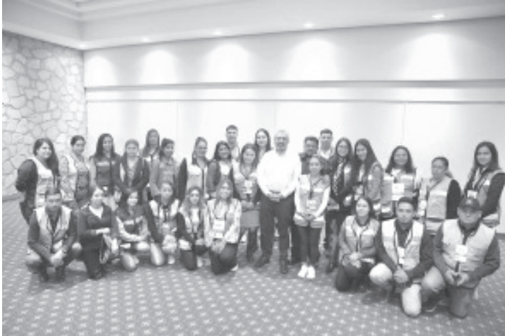
El programa opera en Michoacán desde el 2019 y hace llegar recursos de manera directa a preescolares, primarias, secundarias y telesecundarias.

-Al cierre del 2022, un total de 5 mil 566 escuelas serán beneficiadas en la entidad: Bedolla -El programa evita la corrupción, reduce la burocracia y el intermediarismo para la atención a necesidades básicas en los centros escolares: Pantoja .