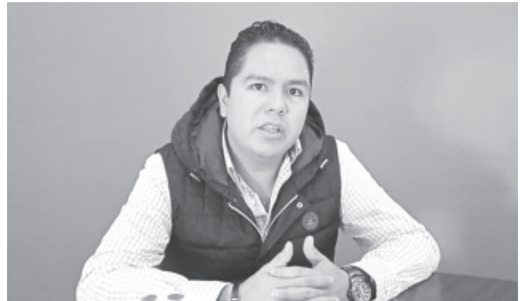
La fecha estará incluida en el mes de agosto, y durante la primera celebración se hará un evento con una kermes y otras actividades del rubro.

Agregó que tendrá que ser en el mes de agosto cuando se instituya y se lleve a cabo la primera celebración.