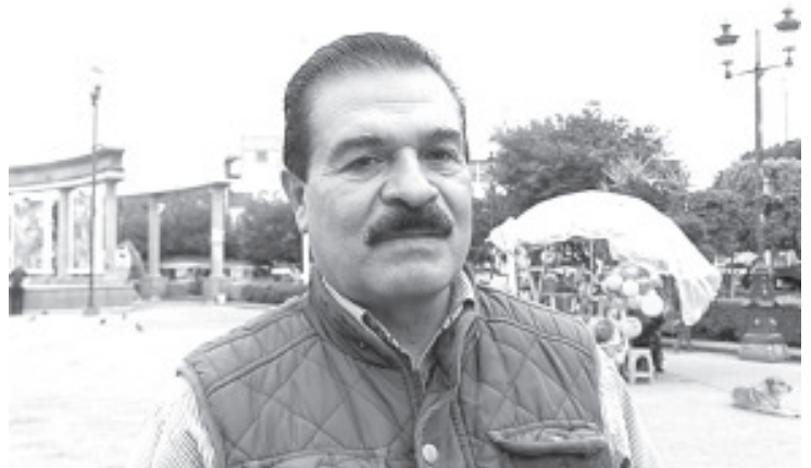
“Estamos en julio, y todavía esperamos que durante los siguientes dos meses las lluvias sean abundantes para que los mantos acuíferos se recarguen lo suficiente”.

En este sentido, invitó a los ciudadanos a cuidar el agua y utilizarla de forma racional, ya que cada gota cuenta y no se debe desperdiciar por ningún motivo.