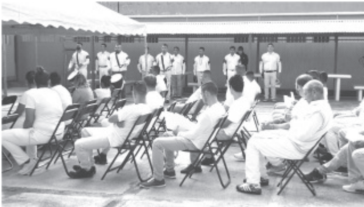
Aunado a la oferta educativa, el incremento en las bibliotecas fue factor determinante para que 385 personas privadas de la libertad iniciaran su educación primaria y 374 la secundaria.

Con el apoyo de instituciones públicas o aprovechando descuentos que a través de convenios con la Coordinación del Sistema Penitenciario ofertaron algunas escuelas privadas, 267 internas e internos decidieron cursar su educación media superior y 30 ingresaron a alguna licenciatura.