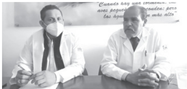
Invitó a la población a retomar las medidas sanitarias, ya que actualmente la quinta ola de COVID 19 está en su nivel más alto y los ciudadanos siguen relajando las medidas en todos los aspectos.