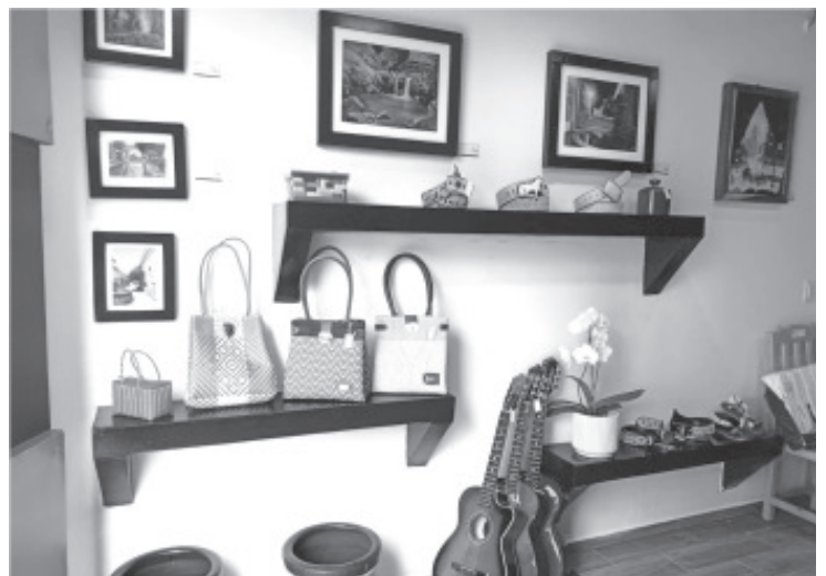
Pulseras, collares, bolsas, carteras, huaraches, cinturones piteados, sillas de montar, en los que internas e internos ponen cariño, son ofertados a precios accesibles.

A través de las acciones que de manera conjunta realizan la Coordinación del Sistema Penitenciario y la Secretaría de Desarrollo Económico para garantizar los derechos de las personas privadas de la libertad en los once penales del estado, se trabajó en tiempo y forma en la creación de nombre, diseño de logotipo y registro de marca de los productos que se expenden, a partir del 18 de julio, en la tienda LiberArte en Morelia.