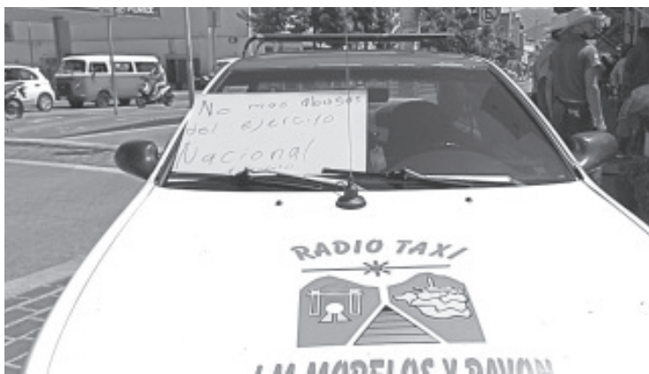
Taxistas y choferes se negaron a declarar el motivo de esta acción de protesta, sin embargo sobre las unidades colocaron pancartas contra de Policía Michoacán y ejército mexicano.

H. Zitácuaro Michoacán, 26 de julio de 2022.- Por: Guadalupe Solache Rebollo. Desde las 11:30 de la mañana hasta las 15:30 horas, transportistas paralizaron Zitácuaro y todas sus actividades.