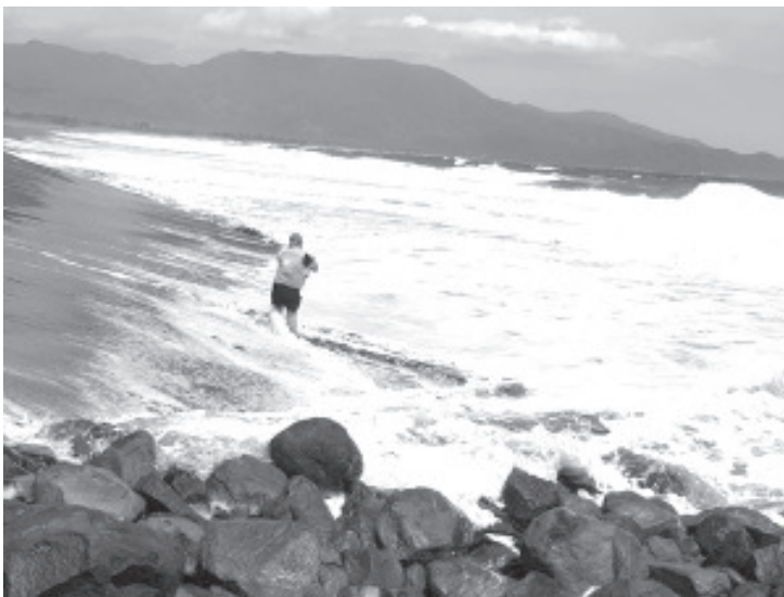
Fueron analizadas en el Laboratorio Estatal de Salud Pública casi 100 muestras de agua de mar extraídas de los principales centros turísticos y todas cumplen con los niveles de seguridad de enterococos fecales .

También se encuentran aptas Boca de Apiza, Faro de Bucerías, Las Brisas y San Juan de Alima del municipio de Coahuayana.