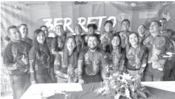
Son de 50 y 30 kilómetros los que se van a correr distancias, mientras los corredores a pie, podrán recorrerá 5, 10 ó 30 kilómetros.

Los interesados pueden inscribirse en la página de Facebook "Warriors MTB" Tuxpan.