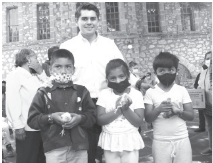
El presidente municipal destacó que el apoyo al desarrollo del campo, contempla distintos beneficios como éste.

Explicó que las familias que reciben este recurso se favorecen tanto con el consumo de la carne y huevo; o con autoempleo, por medio de la producción y crianza de las aves.