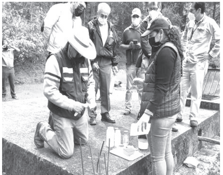
La SSM, a través de la Coepris, realizó un muestreo a los pozos de abastecimiento en la localidad de Los Azufres, municipio de Hidalgo.

Además del muestreo, se revisaron en conjunto los elementos integrados para las obras hidráulicas de captación, desinfección, almacenamiento y distribución, en las localidades cercanas a este recinto turístico.