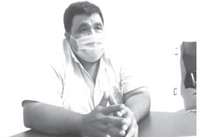
En todos los Centros de Salud hemos tenido contagiados, pero el que nos preocupó más fue en el municipio de Tiquicheo, a tal grado que lo tuvimos que cerrar.

En el Hospital Regional las pruebas contra el COVID 19 se hacen los días lunes, miércoles y viernes, por la mañana y por la tarde en dos horarios. Quienes acudan a solicitar el servicio deben tener paciencia, ya que primero tienen que pasar a consulta, ahí se determina con base a los síntomas si es candidata para la prueba.