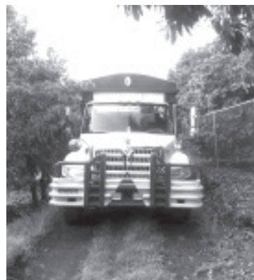
El conductor fue despojado del camión de manera violenta, después llamó a los números de denuncia para reportar el robo de la unidad.

El personal de la SSP se mantiene firme en los esfuerzos para garantizar la paz entre la ciudadanía y se encuentra a su servicio en los teléfonos de emergencia 911 y 089, donde podrán solicitar apoyo en caso de requerirlo.