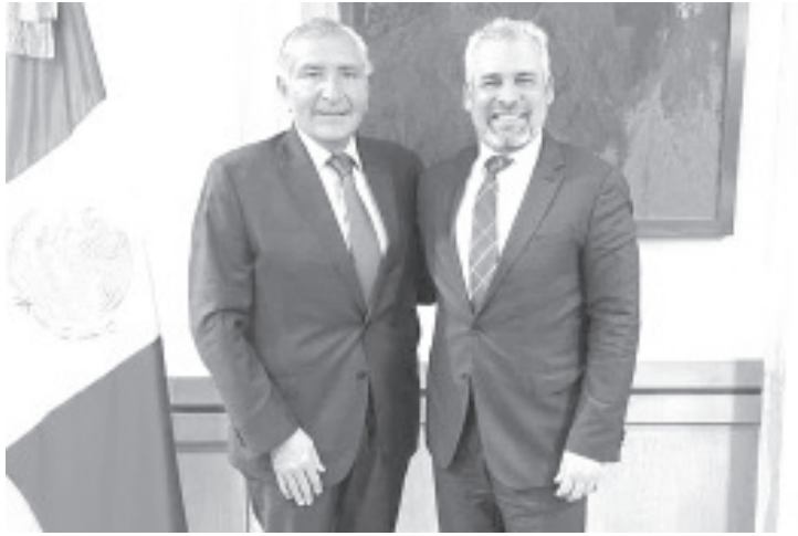
Ramírez Bedolla se reunió con el secretario de Gobernación, para dar seguimiento al proceso de federalización de la nómina educativa, la reactivación del sector minero en Aguililla y el traslado de las oficinas del IMSS.

Ciudad de México, 25 de julio del 2022.-* El gobernador Alfredo Ramírez Bedolla se reunió con el secretario de Gobernación, Adán Augusto López Hernández para dar seguimiento al proceso de federalización de la nómina educativa, la reactivación del sector minero en Aguililla y el traslado de las oficinas centrales del Instituto Mexicano del Seguro Social (IMSS).