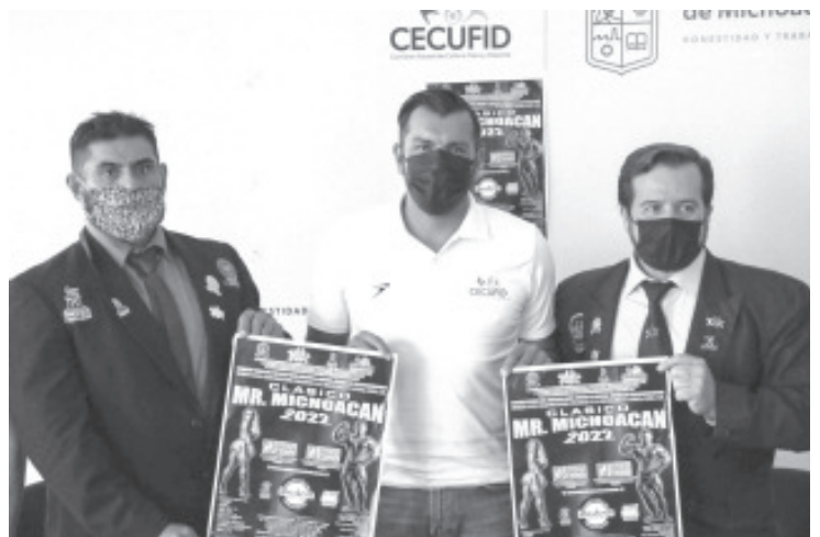
Para la edición 40 del Clásico Mr. Michoacán 2022, se espera la participación de alrededor de 120 atletas provenientes de municipios como Zamora, La Piedad, Sahuayo, Zitácuaro, Morelia.