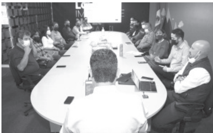
Se reunieron integrantes de la Cámara Nacional de la Industria de la Panificación y Similares de México con representantes de la empresa harinera Monarca y de la Sedeco.