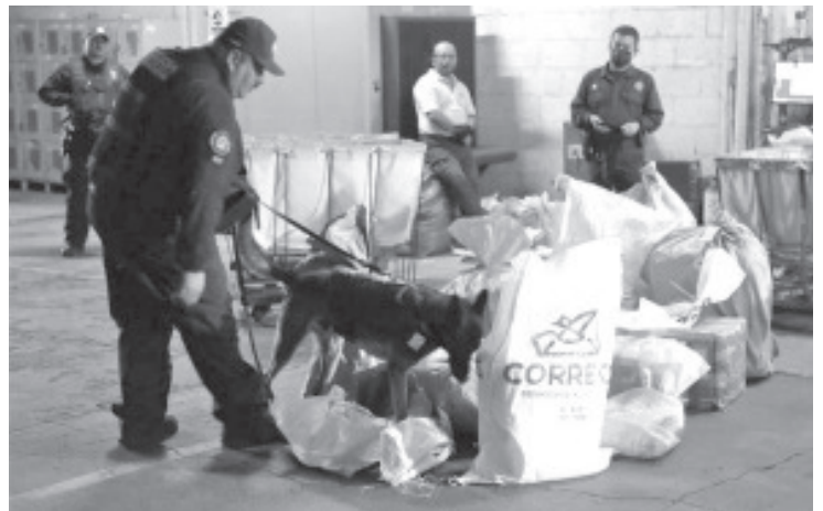
En la oficina de Correo realizaron una revisión a los más de 870 paquetes que estaban en la bodega con el uso de los caninos de ambas instituciones.

Asimismo el personal de la SSP pone a disposición de la población los números de emergencia 911 y 089, para poder recibir denuncias en caso de tener conocimiento de actos que atenten contra la seguridad pública o solicitar ayuda si se encuentra en alguna situación de riesgo.