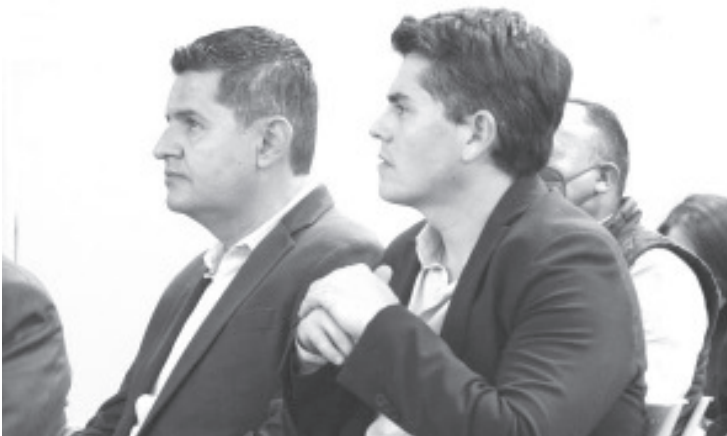
Inicialmente, el plan, tendrá que ser aprobado por el Ayuntamiento en Sesión de Cabildo y posteriormente las instancias federales y estatales tendrán que validarlo.

“Con esta acción heredaremos un Zitácuaro más próspero y en desarrollo para las futuras generaciones”, dijo el alcalde durante la exposición. Remarcó que su administración invierte en este proyecto que consolidará al municipio como una ciudad ordenada y con bases justas para un crecimiento integral de las diferentes demarcaciones locales