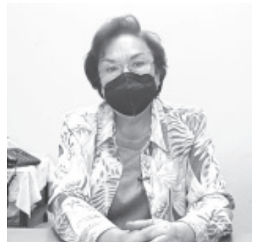
Invitó a todas las personas que tienen un negocio, a resistir, y seguir dentro de la formalidad, ya que de no hacerlo después será peor porque el SAT ya tiene conocimiento.

Agregó que la autoridad ha tratado de dar cursos para ayudarlos a bajar recursos, pero para acceder son muchos requisitos, entre ellos el seguro social que para muchos es imposible, ya que si no tienen para comer, menos para tener seguridad social.