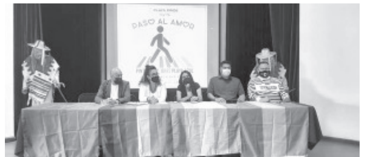
A través del evento esperan una afluencia de 2 mil personas, una derrama económica cercana al millón de pesos, y beneficios directos e indirectos para 600 familias.