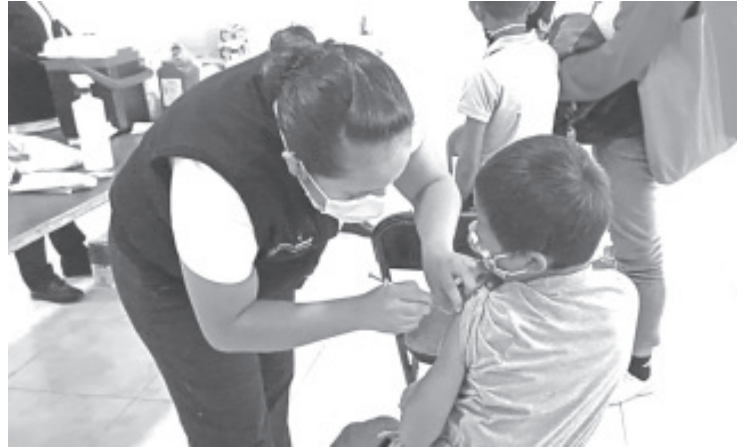
Quedaron pendientes de recibir laa dosis aproximadamente 300 menores, los cuales recibieron una ficha para que después se les aplique de forma segura.