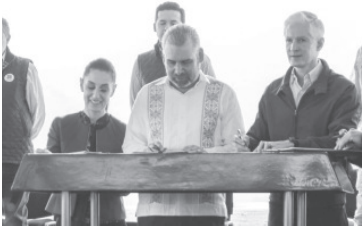
Alfredo Ramírez Bedolla, dejó claro que con la firma de este convenio quedó demostrado que la política del buen vecino funciona y da buenos resultados.

- Gobernadores de Michoacán, Estado de México y la jefa de gobierno de la ciudad de México, formalizan proyecto con firma de convenio