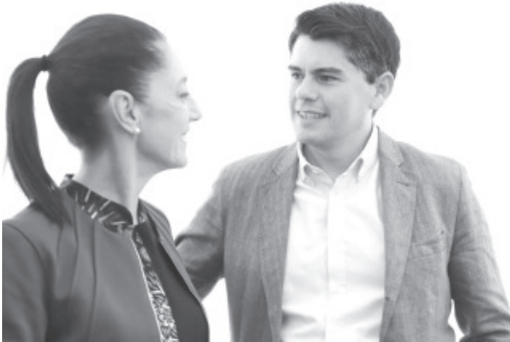
Refrendó, el presidente municipal, que este acto de justicia va de la mano con las acciones en materia ambiental y sustentable que implementa el Ayuntamiento.