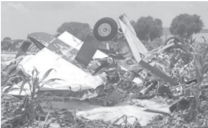
El Aeropuerto Intercontinental de Querétaro, informó que se trató de una aeronave privada, Piper PA31, que despegó de sus instalaciones y confirmó el accidente.

Al momento no han trascendido los nombres de las víctimas del accidente ni las causas del mismo.