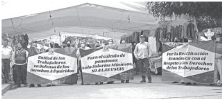
"La empresa Teléfonos de México quiere pasar por encima de nosotros como personal capacitado, quintándonos el derecho a la jubilación, que es un acuerdo pactado por más de 30 años".