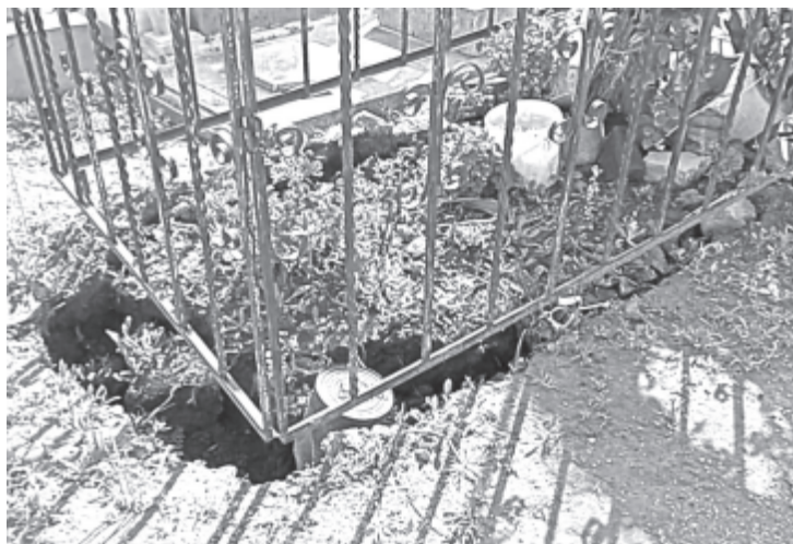
Se han gestionado camiones de tierra para rellenar los espacios vacíos, pero es necesario que los propietarios de las tumbas afectadas se hagan responsables.

Además, agregó que se han hecho las solicitudes correspondientes a la subdirección de Medio Ambiente, para que hagan las podas necesarias a los árboles, a fin de evitar daños que se generen durante la temporada de lluvias