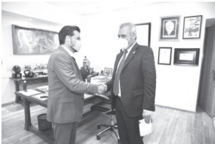
Ramírez Bedolla reiteró que todos los sectores productivos y públicos de Michoacán, se encuentran listos para recibir a los cerca de 10 mil empleados que serán trasladados en diferentes etapas.

Ciudad de México, 12 de julio del 2022.- El gobernador Alfredo Ramírez Bedolla y el director general del Instituto Mexicano del Seguro Social (IMSS), Zoé Robledo, encabezaron una reunión de trabajo con el cuerpo directivo para avanzar en el proyecto de descentralización de las oficinas nacionales del Instituto y nuevos hospitales regionales en Michoacán.