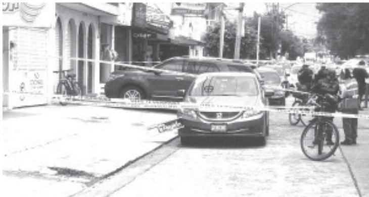
El hombre fue encontrado inerte en el asiento del piloto de un vehículo Honda Civic, color gris, el cual estaba a la altura de la colonia Chapultepec Sur.

Los uniformados acordonaron el área y pidieron la intervención de la Fiscalía General del Estado (FGE), cuyos especialistas de la Unidad de Atención Inmediata se encargaron de las averiguaciones respectivas y trasladaron el cadáver a la morgue para la práctica de la necropsia de rigor.