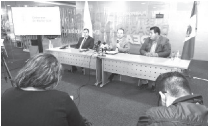
En breve será lanzada la convocatoria pública para definir a los conciliadores, quienes deberán tener amplia experiencia en el tema laboral.

Precisó que en Morelia operará en el edificio ubicado en la avenida Lázaro Cárdenas, frente a la Sedeco; en Uruapan estará en la Ciudad Administrativa (edificio de Gobierno), en tanto que en Zamora lo hará en el Centro Regional de las Artes de Michoacán (CRAM) planta baja con acceso independiente.