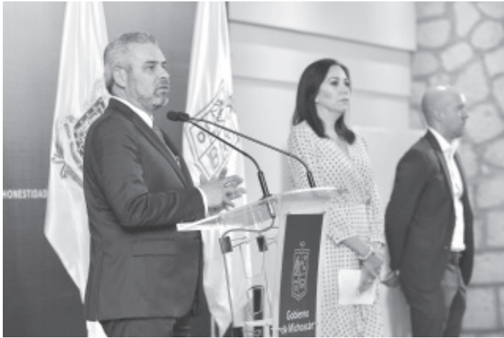
La propuesta de refinanciar o reestructurar la deuda pública del estado, entregada al Congreso local, será para garantizar la solvencia financiera y evitar posibles crisis al cierre del 2022 y en próximos años.

Morelia, Michoacán, 11 de julio del 2022.- Sin la contratación de nueva deuda estatal, el gobernador Alfredo Ramírez