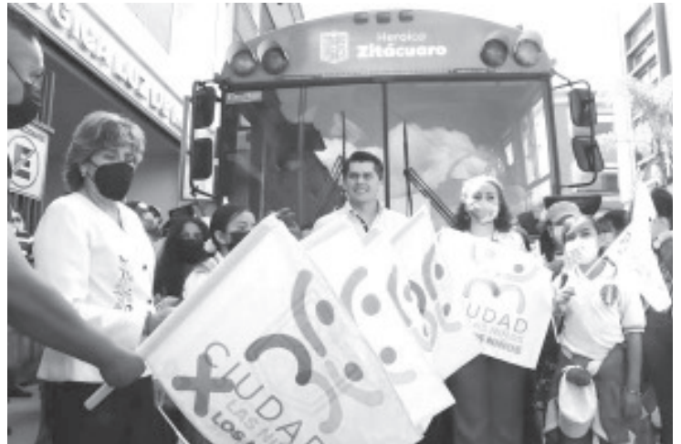
Se visitarán lugares como El Pinocho, La Casona de la Estación, El Cerrito de la Independencia, La Mora del Cañonazo, el Museo de la Suprema Junta Nacional Americana, próximo a ser una realidad.

"C o m o #CiudadPorLasNiñasYLosNiños estamos comprometidos a crear esquemas que fortalezcan el desarrollo humano y la formación educativa de la niñez y juventud zitacuarenses", destacó el edil. Agregó que la finalidad de esta labor, es que las y los menores conozcan la importancia que tiene Zitácuaro, por los acontecimientos en los que ha participado a lo largo del tiempo.