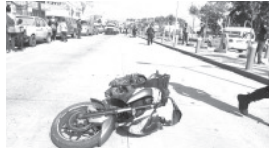
El conductor de esta moto perdió la vida, al parecer la conducía a alta velocidad, tras impactarse con los bolardos y después contra una camioneta.

Extra oficialmente y por versión de un testigo presencial, se dijo que, "el joven viajaba a exceso de velocidad, perdió el control de la motocicleta y choco con los bolardos para después pegarle al de la camioneta rojo con blanco".