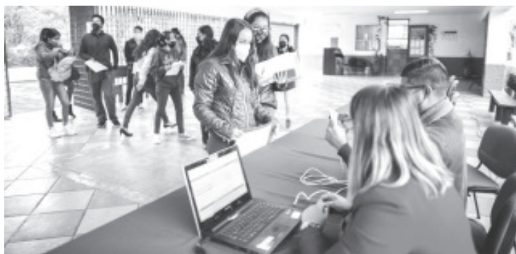
La oferta académica incluye cinco licenciaturas, 9 maestrías y un doctorado, que se pueden cursar en modalidad directa con clases de lunes a jueves o semirresidencial con clases viernes y sábado.

Mientras que las maestrías son: Pedagogía, Cultura física, Ciencias naturales, Psicología de la educación con perspectiva psicoanalítica, Psicogenética, Dificultades en el aprendizaje, Sociología de la educación, Administración educativa, así como el doctorado en Educación.