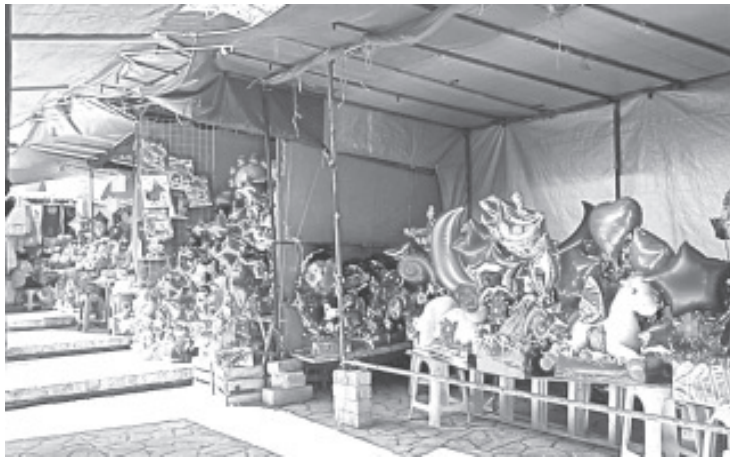
"Si viene gente, pero es más para preguntar, no para comprar, otros solo vienen a ver, a veces toman foto de los arreglos pero solo eso".

Invitó a la población de Zitácuaro y la región a acudir a este lugar, aquí puede encontrar todo tipo de arreglos, desde aquellos con flores hasta los que son de globos con algún regalo. Además los precios son accesibles y hay para todas las economías.