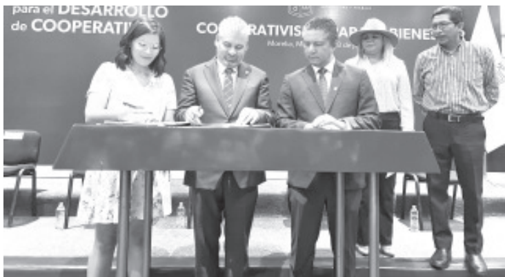
El objetivo de Pideco es “crear y desarrollar cooperativas en el estado, a través de la conjunción de recursos y capacidades de las instituciones involucradas.

Instituto Nacional de Economía Solidaria (INAES), a fin de promover una economía social en la que las personas y sus necesidades sean los más importante.