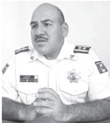
Ante cualquier hecho de este tipo, el funcionario solicitó a los ciudadanos comunicarse de inmediato al número de emergencia 911 o acercarse a cualquier elemento de la corporación.