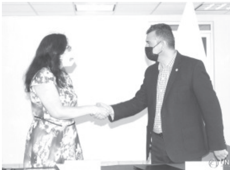
El rector de la UNIVIM, manifestó su total disposición para trabajar en conjunto por la mejora del municipio de Zitácuaro, y cada uno del estado de Michoacán.

En la marcha, también se estará apoyando a los alumnos que pertenecen a la institución zitacuarensis que tengan alguna discapacidad, todo ello, gracias a las herramientas con las que cuenta la UNIVIM tras haber sido nombrada como la primera universidad incluyente.