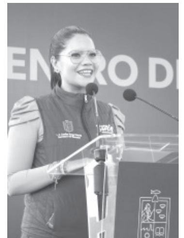
Rangel Gracida señaló que estos centros tienen como objetivo coadyuvar al mejoramiento de las condiciones de vida de las y los michoacanos.

Agregó que se cuenta con la participación de diversas dependencias y entidades del gobierno estatal y se estima atender a aproximadamente 200 personas por centro mensualmente a través de diversos ejes: salud, economía, fomento a la educación, cultura, sustentabilidad ambiental, deporte e inclusión.