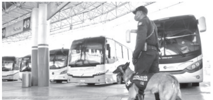
Este despliegue operativo se extenderá en una segunda etapa a los municipios de Zamora, Uruapan y Apatzingán, para posteriormente, replicarse en todo el territorio estatal.

Con acciones firmes, la SSP no bajará la guardia por preservar el orden público y garantizar la seguridad de la población. Ante cualquier acción delictiva, es necesario reportarla a las líneas de emergencias 911 y 089.