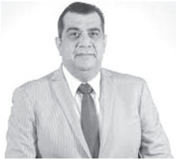
La inmunidad inducida por la vacuna sigue siendo eficaz ante esta nueva variante, por lo que la SSM hace un llamado a quienes no se han vacunado a que se protejan.

Morelia, Michoacán, 7 de julio de 2022.-* Ante el incremento de casos de Covid-19 a nivel nacional, la Secretaría de Salud de Michoacán (SSM) hace un llamado a la población para continuar con las medidas básicas de prevención, el uso correcto de cubrebocas en espacios cerrados, sana distancia, lavado frecuente de manos con agua y jabón, uso de gel antibacteriano y ventilación de espacios.