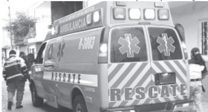
Familiares de la occisa indicaron que localizaron a la menor colgada con una cuerda, que a su vez estaba atada a una ventana.

De las correspondientes diligencias se hicieron cargo los agentes y peritos de la Unidad Especializada en la Escena del Crimen, siendo iniciada la respectiva carpeta de investigación.