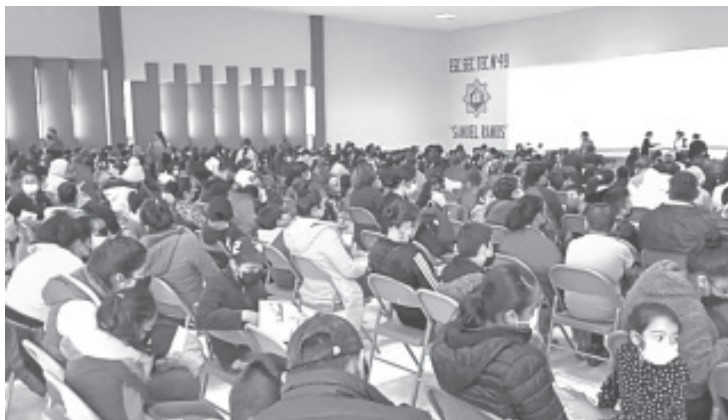
13 mil dosis de la vacuna pfizer se aplicarán durante jueves, viernes, sábado y lunes a niños de 5 a 11 años de edad.

Este mismo día, también comenzó la vacunación a menores con comorbilidades en la clínica del ISSSTE.