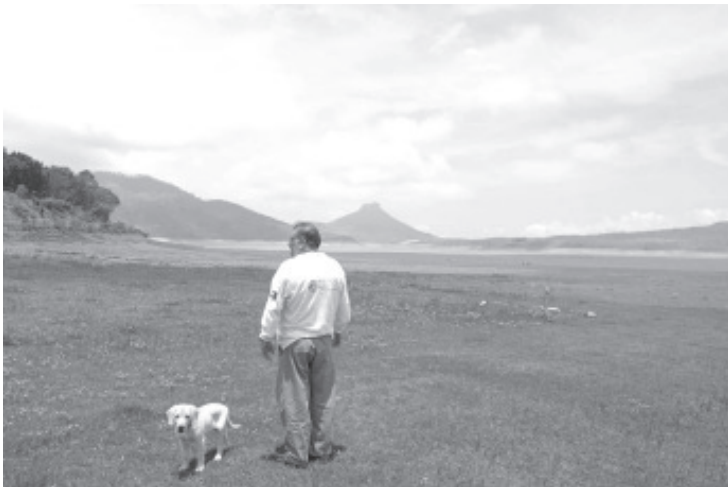
Aunque en las últimas dos semanas se han registrado precipitaciones pluviales importantes, no se han visto reflejadas en una recuperación de este cuerpo de agua.

Pescadores y campesinos se encuentran preocupados por la situación actual, por ahora no hay problemas porque las plantas se riegan con el agua de lluvia, pero los problemas se presentarían en la próxima temporada de estiaje.