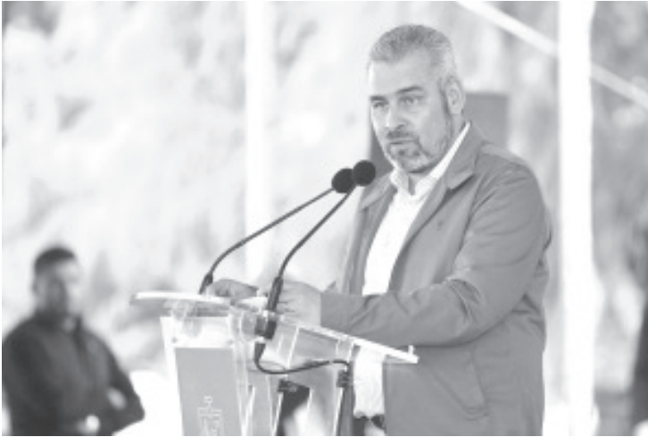
El mandatario celebró que la decisión de los diputados locales fuera unánime a favor de los derechos indígenas y del pleno ejercicio de su autonomía.

-Seguiremos coordinados con las comunidades indígenas en materia de seguridad: Bedolla