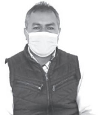
Participaron 7 empresas con poco más de 75 vacantes, entre las que estuvieron disponibles: ventas, empleados de piso, de mostrador, cajeros, promotores de crédito, entre otros.

En este lugar, quienes acuden pueden encontrar textiles de lana, artículos de ocoshal, alfarería, dulces tradicionales, medicina alternativa, cobre, joyería tradicional, madera, entre otros.