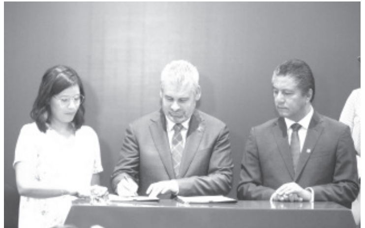
El gobernador resaltó que el mejor camino para superar los efectos adversos de la situación mundial es enfocarse en el fortalecimiento de la economía local.

Rocío Beamonte abundó que en el consentimiento expreso escrito puede señalarse que la donación se hace exclusivamente en favor de ciertas personas o instituciones.