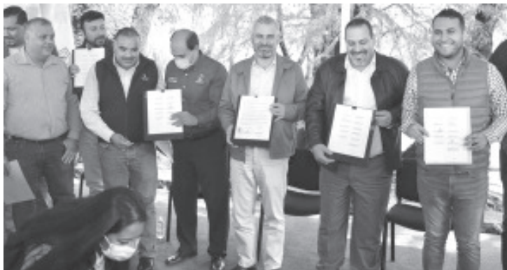
En total, el Gobierno de Michoacán invertirá 800 millones de pesos en este proyecto para preservar y sanear la cuenca del Duero durante este sexenio.

Finalmente, el gobernador anunció la construcción del primer Museo del Agua en Michoacán, que estará ubicado en las inmediaciones del Parque Nacional del Lago de Camécuaro, al ser un referente de ecoturismo y de enseñanza para la preservación de las fuentes de agua con las que cuenta Michoacán.