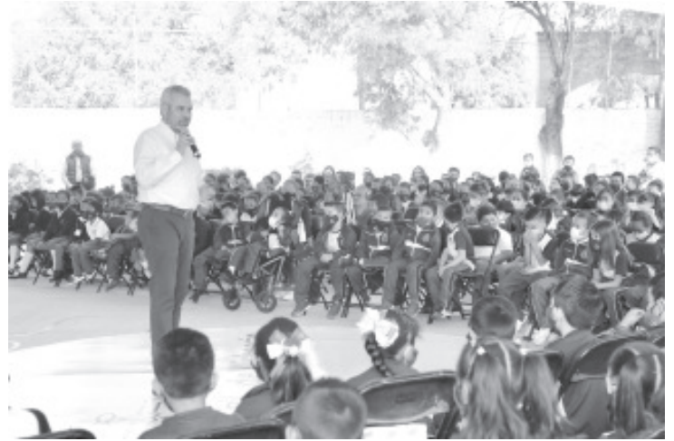
La meta es que 11 mil escuelas puedan contar con este servicio, desde el arranque del programa en mayo y hasta la fecha, ya se han instalado más de mil antenas con el apoyo de la CFE.

“Los estudios de la Organización de Naciones Unidas nos dicen que para el año 2050 habrá más del doble de personas mayores de 60 años, que niños menores de cinco años; además, las personas de 60 años o más superarán en número a los adolescentes y jóvenes de edades comprendidas entre los 15 y los 24 años”, apuntó.