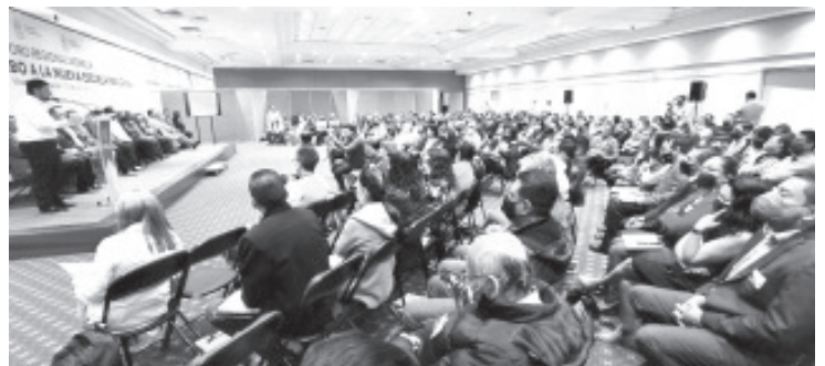
Docentes, directivos y especialistas michoacanos trazarán el camino para regionalizar la Nueva Escuela Mexicana, para lo cual se lleva a cabo un análisis de las leyes educativas.

Mientras que los marcos curriculares de los años 2011 al 2021 tenían un modelo basado en competencias, contemplando en el 2017 una arista humanista, en el 2022 el modelo se dirige completamente a un esquema socioconstructivista humanista, es decir basado no en competir sino en educar para ser feliz y abonar en el desarrollo de un mejor entorno, trabajando con los valores y capacidades humanas.