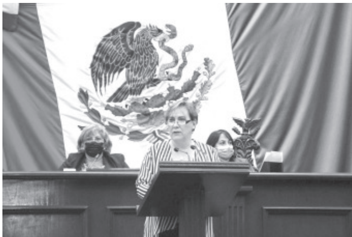
Michoacán debe sumarse al Plan para la Década del Envejecimiento Saludable, a fin de dar a los adultos mayores un marco normativo acorde a sus necesidades.