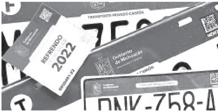
Los solicitantes, únicamente deberán presentar identificación oficial, la tarjeta de circulación y el juego de placas anteriores.

Morelia, Michoacán, 30 de junio de 2022.- Con el objetivo de agilizar el proceso de canje de placas y de tarjetas de circulación, la Secretaría de Finanzas y Administración (SFA), simplificó los trámites en todos sus módulos y oficinas recaudadoras.