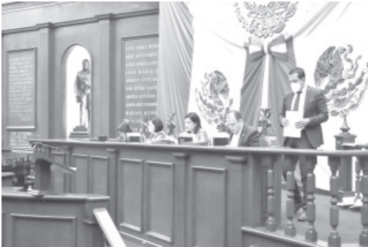
La propuesta destaca que la obsolescencia programada es la práctica de acortar artificialmente la vida útil de los artículos, con la finalidad de influir en las decisiones de compra del consumidor.

Morelia, Michoacán, 30 de junio de 2022.- En sesión ordinaria, las y los diputados de la 75 Legislatura aprobaron propuesta de acuerdo para que se presente al Congreso de la Unión, una iniciativa ciudadana con proyecto de decreto, para reformar la Ley Federal de Protección al Consumidor en el rubro de la obsolescencia programada. El dictamen presentado por la Comisión de Puntos Constitucionales, refiere que la propuesta ciudadana que le fue turnada para su análisis, tiene por objeto definir la