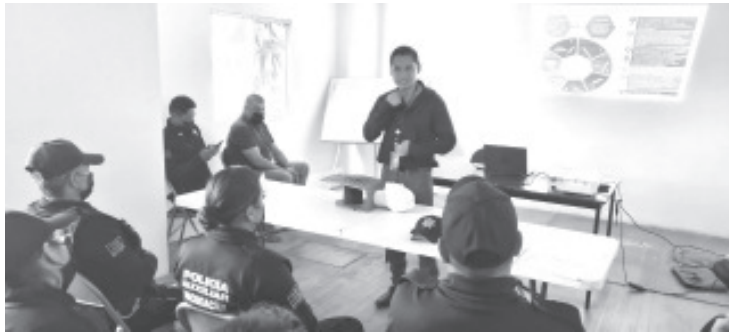
En esta actividad se les dotó de herramientas necesarias a los elementos para brindar atención en primeros auxilios en caso de emergencias suscitadas durante sus servicios.