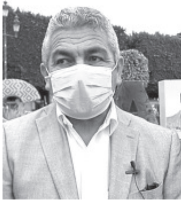
Solicitó a las autoridades educativas que les brinden las facilidades para subir los datos de los alumnos, y que sean tomados en cuenta, pero no hay respuesta.

- Durante clases a distancia no mandaron trabajos ni mantuvieron contacto con sus maestros