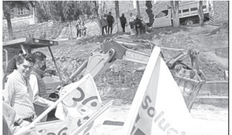
Construir una alberca significa tener una visión de progreso y desarrollo, significa pensar en el desarrollo humano de niños, jóvenes y adolescentes.