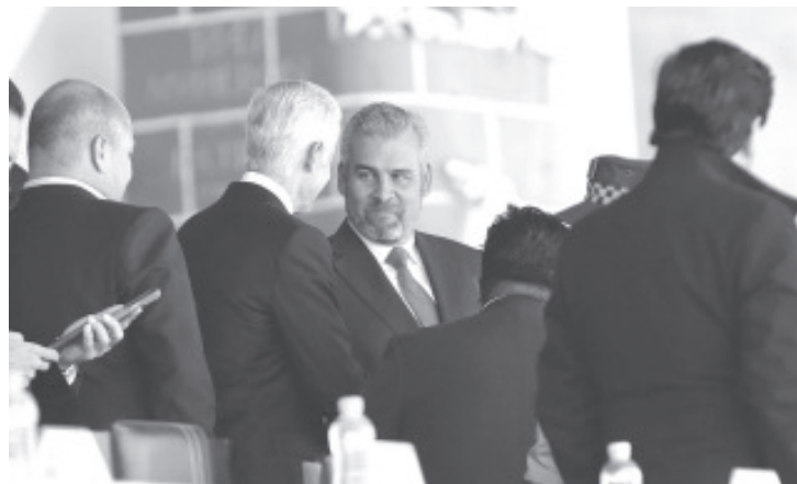
El primer mandatario federal destacó la necesidad de reformar la Constitución Política para que la Guardia Nacional quede adscrita a la Sedena.