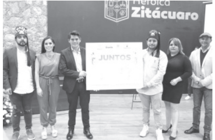
Las y los menores de 0 meses hasta los 17 años de edad y 11 meses de edad, tendrán acceso gratuito a la atención médica tales como: sindactilia, labio y paladar hendido, pie equinóvaro y luxación congénita de cadera.