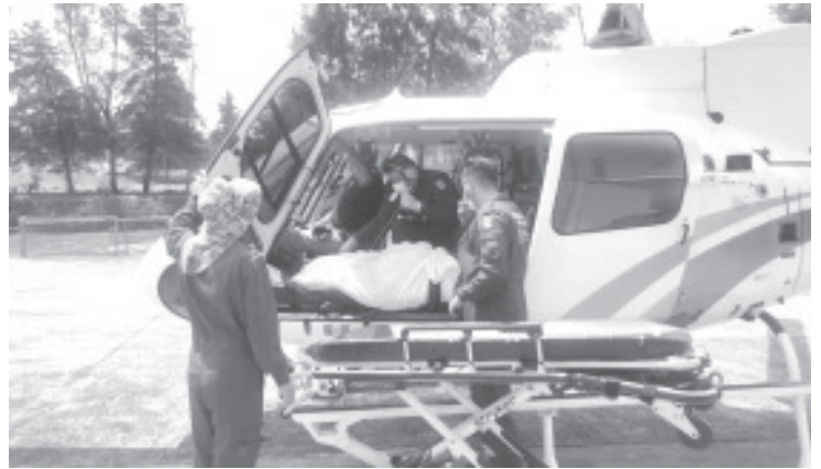
Tras un viaje exitoso y sin complicaciones, la paciente fue recibida por personal médico para su atención, así como su tratamiento inmediato y oportuno.

En caso de requerir, las aeronaves pertenecientes a esta institución están disponibles al servicio de las y los michoacanos y pueden solicitarse ante la línea telefónica de emergencias 911.