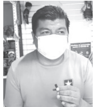
Los infractores, son ajenos al mercado y han entrado en la madrugada, cuando se abre el mercado y es cuando hay muy poca gente.

Desgraciadamente, expuso que el costo de cada cámara es muy alto, y hasta ahora sólo han cooperado los locatarios de la Unión Melchor Ocampo, las demás uniones no lo han hecho y esto hace más difícil recaudar el dinero que se requiere. "El cable y la instalación es caro, pero