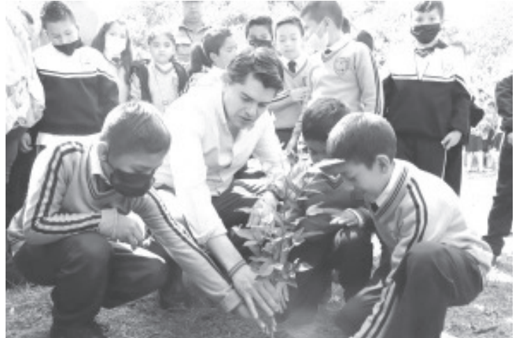
Refirió que la época de lluvias es el mejor momento para reforestar, por lo mismo, pone en marcha la campaña de plantación urbana.

"Con la plantación, coadyuvamos a mitigar los impactos medioambientales y continuar hacia un municipio altamente sustentable", declaró el edil. Cabe resaltar que gracias a la colaboración de asociaciones civiles, instituciones, los tres niveles de gobierno y la participación ciudadana, este año se llevará a cabo la reforestación más grande de los últimos 20 años en Zitácuaro.