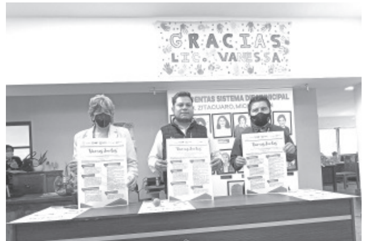
El programa es posible gracias a un convenio que se tiene con la línea de autobuses Excelencia Plus, y consiste en hacerles el descuento del 50%.

La entrega de las credenciales a los beneficiarios se realizará el próximo 16 de julio, en el estacionamiento del DIF Municipal.