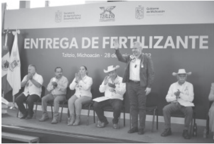
Este año vamos a distribuir 25 mil 800 toneladas de fertilizante en todo el estado, que es más que el entregado durante los últimos 4 años del gobierno anterior.

Tzitzio, Michoacán, 28 de junio del 2022.- Con la determinación de fomentar la autosuficiencia y la transición a la agricultura orgánica, el gobernador Alfredo Ramírez Bedolla, entregó 72 toneladas de fertilizantes a productores de Tzitzio como parte de las acciones complementarias al programa Agrosano.