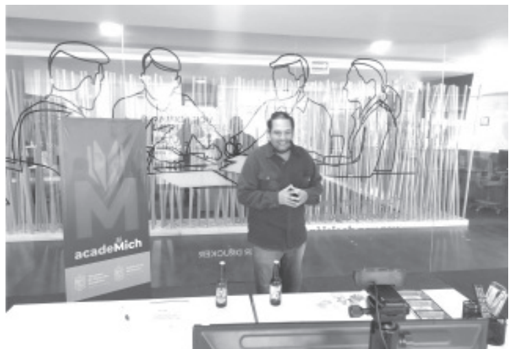
En Michoacán hay alrededor de 20 productores de la bebida, por lo que la entidad se ubica entre los 10 primeros productores a nivel nacional.

Quienes deseen consultar esta interesante charla, pueden hacerlo en el siguiente enlace: https://www.facebook.com/watch/live/?ref=notif&v=4913591252086194&notif_id=1656345631231416&notif_t=live_video