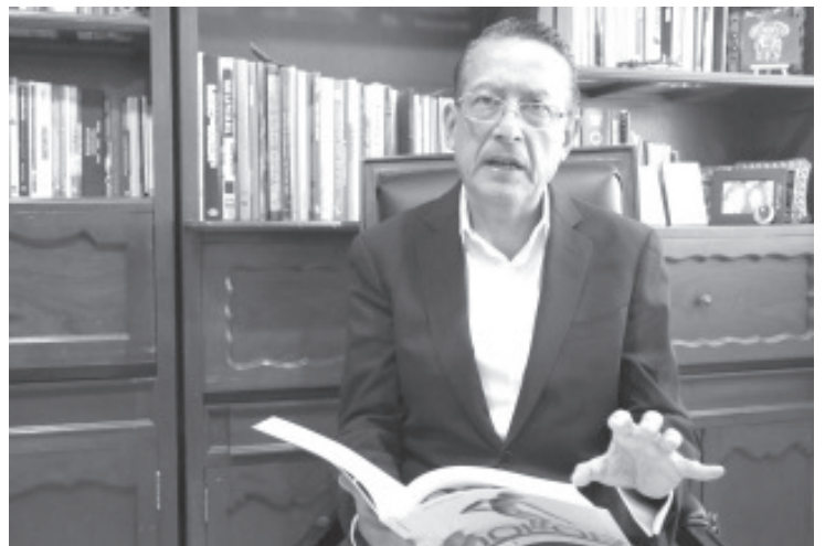
Durante lo peor de la pandemia, en 2020, se reportaron 1 mil 150 suicidios de niñas y niños en México, que es una cifra récord. La tasa de suicidios en este grupo aumentó 12 % entre 2019 y 2020.

En México, el suicidio en la niñez y juventud es un problema de salud muy serio, al que debiera darse una mayor atención, finalizó el Dr. Gutiérrez Farías.