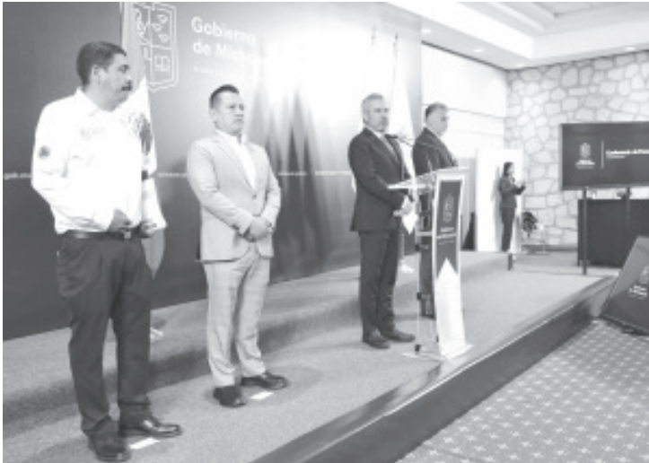
Se mantiene una coordinación estrecha y permanente con autoridades de los tres órdenes de gobierno para brindar a la población, apoyo en caso de ser necesario, principalmente por deslaves e inundaciones.

Morelia, Michoacán, 27 de junio del 2022.- De acuerdo al pronóstico del Servicio Meteorológico Nacional que indica la probabilidad de la presencia de 14 a 19 fenómenos meteorológicos en esta temporada de lluvias y huracanes en el Océano Pacífico, la Coordinación Estatal de Protección Civil (PC) informó que se mantiene un monitoreo permanente de las presas, con la finalidad de actuar en consecuencia en caso de ser necesario.