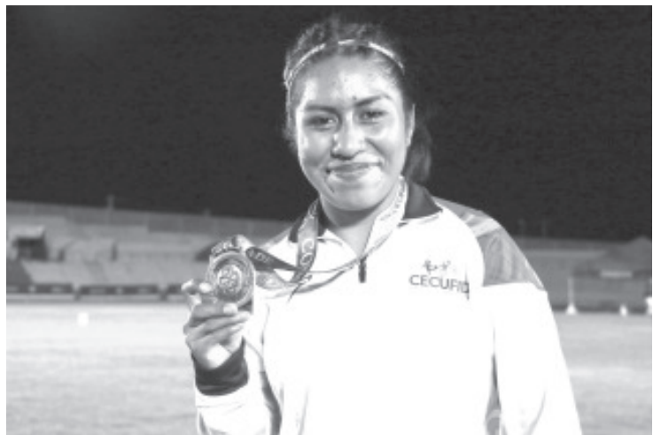
La delegación presente en la máxima fiesta del deporte amateur en nuestro país, registra 16 preseas de oro, 13 de plata y 25 de bronce.

Durante la tarde-noche de este martes, las actividades de la delegación michoacana continuarán con los representativos femeniles en Juvenil Menor, Mayor y Juvenil de voleibol de playa, quienes buscarán las medallas en La Paz, Baja California Sur, en los encuentros finales del certamen.