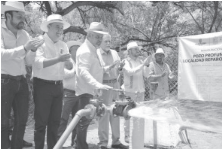
Ramírez Bedolla inauguró en la localidad Reparo de Luna, un pozo profundo en el que fueron invertidos 3 millones 228 mil 628 pesos para abastecer de agua a los habitantes de la región.

-La Huacana, Michoacán, 26 de junio del 2022.-* El gobernador Alfredo Ramírez Bedolla inauguró en la localidad Reparo de Luna, un pozo profundo de agua en el que fueron invertidos 3 millones 228 mil 628 pesos para abastecer del vital líquido a los habitantes de esta región.