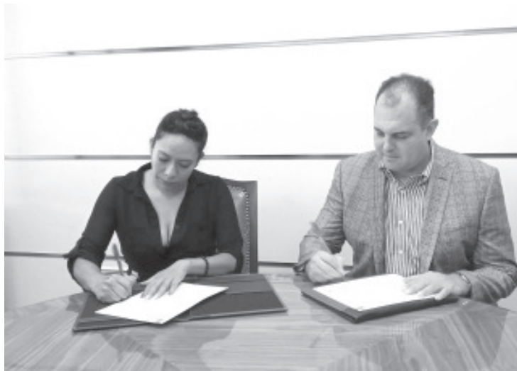
El Ombudsperson michoacano y la Presidenta del Colegio, establecieron el compromiso para fortalecer los servicios que ofrece el organismo y que requieren de la orientación y del análisis clínico.

Las acciones estarán enfocadas a atender temas de la rama de la psicología a través de actividades de capacitación, conferencias, programas de desarrollo, asesorías, programas de educación continua, consultorías; además de apoyo en peritajes psicológicos.