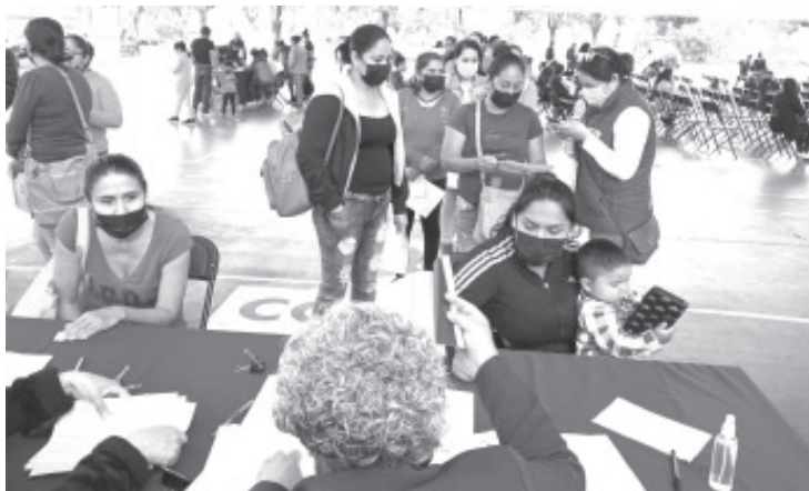
La dependencia estatal realizó la dispersión de recursos por el orden de los 2 millones 96 mil pesos, para un total de 299 apoyos, correspondientes al mes de junio.

“Con la implementación de este programa social, el Gobierno del Estado que encabeza Alfredo Ramírez Bedolla, da respuesta a una de las peticiones más sentidas de la población michoacana”, finalizó.