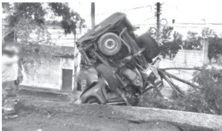
Entre los muertos hay dos adultos y dos menores de edad. Hasta el lugar arribaron paramédicos y bomberos locales, así como elementos de la Policía.

Una vez confirmado el deceso de las víctimas, el área fue acordonada y se solicitó la intervención de la Fiscalía General del Estado (FGE), a efecto de emprender las investigaciones correspondientes. Hasta el momento la identidad de los difuntos es desconocida.