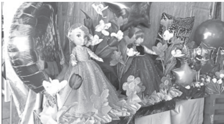
Se pueden encontrar regalos y arreglos de globos que son los más demandados, así como de flores; para que sean más llamativos cada uno lleva un juguete o un artículo para los graduados.