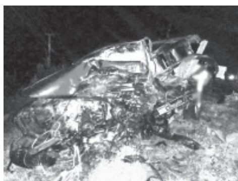
El vehículo Sentra, aparentemente intentaba evadir un retén de la GN y en su huida impactó contra la Sonora, dentro de este vehículo se localizaron 3 armas largas, dos AR-15 y una AK-47.

En el percance resultaron heridas tres personas más, mismas que viajaban en la