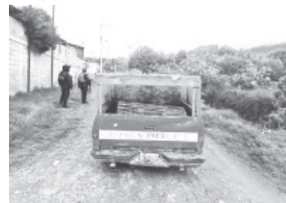
Los dos tripulantes del sexo masculino no lograron comprobar la legal procedencia de la materia prima forestal, por lo que se procedió al aseguramiento.

Derivado de la revisión, los dos tripulantes del sexo masculino no lograron comprobar la legal procedencia de la materia prima forestal, por lo que se procedió al aseguramiento y puesta a disposición de la autoridad