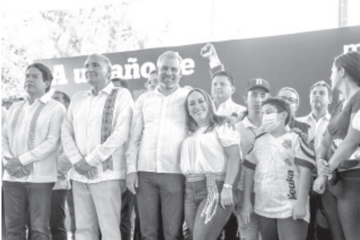
Hoy somos un gobierno diferente, municipalista, que entregará este año mil millones de pesos del Fondo de Aportaciones Estatales para la Infraestructura de los Servicios Públicos Municipales.

Morelia, Michoacán, 25 de junio de 2022.-* A un año de la victoria del pueblo michoacano, el gobernador Alfredo Ramírez Bedolla destacó que se trabaja con honestidad, sin discriminación, y en defensa de los más necesitados, por lo que "se acabó la era de los gobiernos que han traicionado al pueblo".