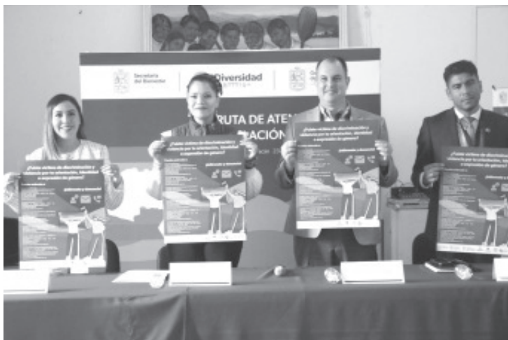
Dijo Carolina Rangel Gracida, que para el gobierno de Alfredo Ramírez Bedolla, combatir la discriminación y violencia hacia la población LGBTTTIQ+ es una prioridad.

“La discriminación y violencia hacia la Población LGBTTTIQ+ sigue generando dificultades para el desarrollo personal, social y cultural de las personas que la integran, afectando y vulnerando sus derechos, exponiéndose continuamente a actitudes LGBTfóbicas”, concluyó.