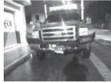
Los subieron a una camioneta Silverado y los llevaron a un camino de terracería, donde los despojaron de sus celulares, carteras, así como de 600 mil pesos.

Tras esto, el empistolado fue cercado por