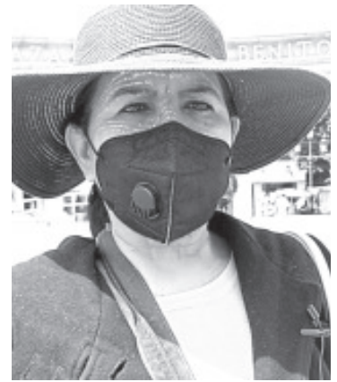
Madre de familia, señaló que acudió directamente a Servicios Regionales Educativos y ahí le confirmaron que los alumnos segundos y terceros no están inscritos.

“En Regionales nos dijeron que ya se está trabajando para atender el problema y no nos queda más que esperar, ojalá se resuelva porque no se me hace justo que pierdan este año por la negligencia de esta persona, creo