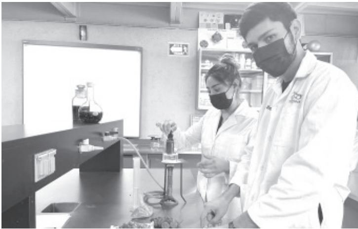
Esta carrera mantiene el 70 por ciento de práctica y 30 por ciento teoría, y su duración es de dos años, en un sistema cuatrimestral, sin pagos mensuales.

El examen de admisión es el 30 de julio de 2022 en línea a las 9:00 de la mañana o 3:00 de la tarde. El registro se hace en línea en https://ut-morelia.edu.mx/ o en FB, Universidad Tecnológica de Morelia.