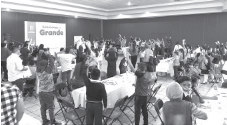
El objetivo de estos foros regionales es recuperar información de voz propia de niñas y niños de entre 6 y 11 años de edad a través de juegos lúdicos.

Zitácuaro, Michoacán, 23 de junio de 2022.- Con la finalidad de incentivar la participación infantil y así obtener información para la conformación del plan sectorial en materia de niñas, niños y adolescentes, se llevó a cabo este día, un foro regional en esta cabecera municipal.