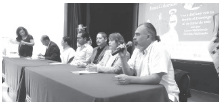
El proyecto consiste en presentar un mosaico de baile integrado por más de mil personas en el Centro Histórico de Morelia, en un espacio simbólico de 480 metros lineales sobre la Avenida Madero.