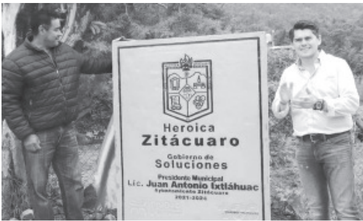
La obra realizada por el #GobiernoDeSoluciones también contempló la instalación del alumbrado público, construcción de banquetas y guarniciones.

- En beneficio de 1,200 habitantes, el alcalde entregó la pavimentación del camino de acceso a la comunidad de Seis Palos, en Chichimequillas de Escobedo.