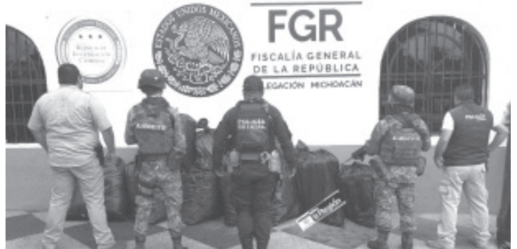
En la tenencia de Aputzio de Juárez, los elementos se encontraban en un patrullaje de vigilancia en la zona, cuando visualizaron varias bolsas plásticas apiladas.

Con estas acciones la SSP sigue trabajando para garantizar la seguridad y el bienestar de la ciudadanía, donde también pone a su disposición los números de emergencia 911 y 089, para dar atención a sus denuncias y actuar en caso de necesitarlo.