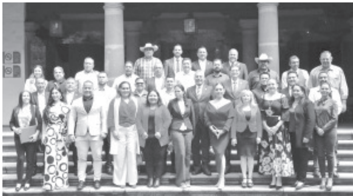
Ramírez Bedolla destacó que este programa tiene como objetivo incrementar las capacidades de seguridad y coordinación para disminuir indicadores delictivos en Michoacán.

—Son 532 millones de pesos los asignados a través de este programa, de una bolsa total de 758 millones para ejercerse este año—