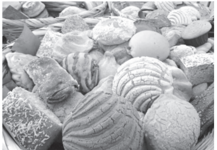
Estimó que las ventas en el pan ha bajado un 60%, ya que si antes una familia compraba 10 piezas de pan, ahora solo compran 4.

Por este sentido, Padilla García invitó a la población a ser conscientes, ya que piensan que suben sin razón el pan y no es así, todo el desorden en los precios ha sido generado por el alza indiscriminada en los insumos.