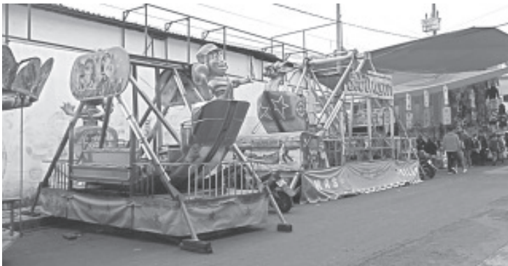
En este lugar pueden encontrar productos para todas las economías, se trata de tener precios justos, pues se sabe de la situación difícil que viven las familias.

Agregó que en esta feria, quienes acudan pueden encontrar juegos mecánicos, brincolines, puestos de antojitos mexicanos, juegos de canicas y de globos; así como diversión sana y familiar que es lo que se ocupa en estos momentos para retomar la convivencia social