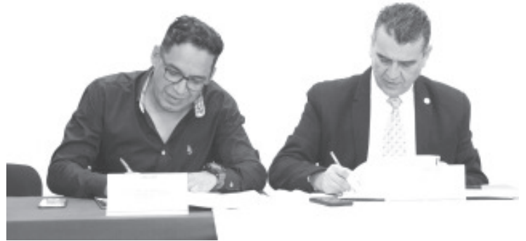
Conalep signó convenio de colaboración con la Univim, para otorgar descuentos en inscripciones y reinscripciones en todos los programas académicos de diplomados, especialidades, maestrías y doctorado.

Además, se trabajará de manera interinstitucional para realizar congresos, conferencias, seminarios, talleres, y demás actividades que promuevan la educación académica y la calidad educativa.