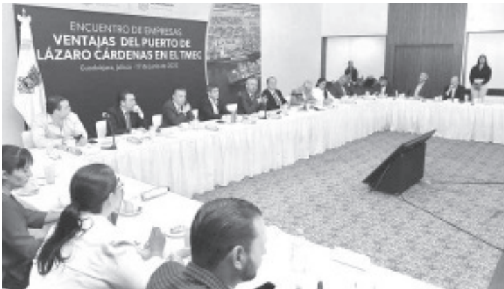
Los empresarios conocieron el amplio potencial para la inversión que existe en Michoacán, principalmente por la infraestructura ferroviaria que une a Estados Unidos y Canadá con México.

-Asegura que el puerto es seguro y con gran potencial para la inversión