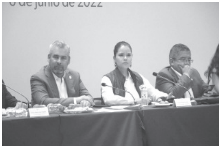
El Gobierno de Michoacán, por conducto de la Secretaría del Bienestar Sedebi, avanza en la recuperación del tejido social con el programa Barrio Bienestar.

"Barrio Bienestar, no es una estrategia de seguridad pública, es social y de bienestar para la población, con enfoque social para la recuperación de valores y del tejido social", concluyó la funcionaria estatal.