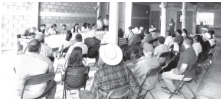
Participaron 27 líderes sociales y representantes legales de cooperativas donde se expusieron sus principales problemáticas y necesidades, ofreciéndoles.

Además de guayaba, también asistieron productores de chile, durazno, flores, fertilizante orgánico y químico, dulces y aguacate. Entre ellos, quienes se dedican a la cría de rana toro, ganado, pescado, gallinas y muebles con maderas recicladas.