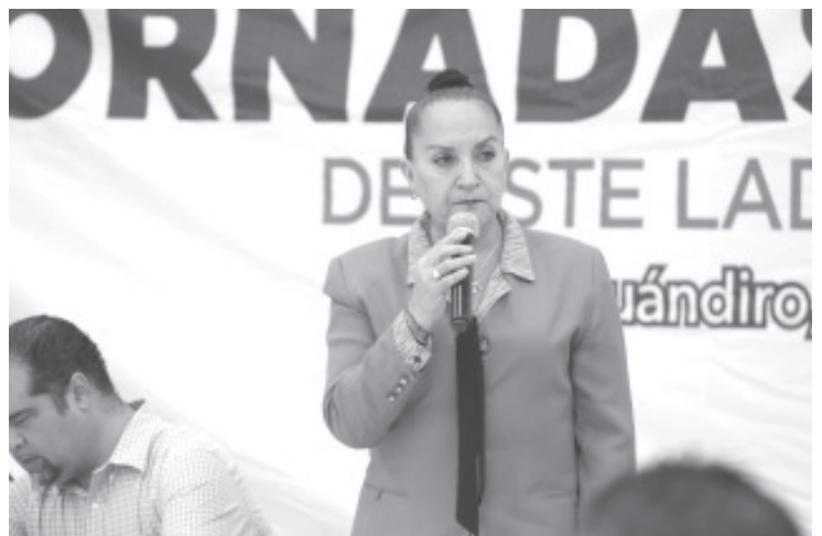
Antes de querer despojar a los trabajadores de su fuente laboral, los diputados deberían predicar con el ejemplo, acudiendo de manera puntual a las Sesiones de Pleno.

“Primero que la Junta aclare cuentas, y que cese la postura de acoso y persecución que pretende sobre los trabajadores para distraer la atención sobre los cuestionamientos de las y los diputados que pesan sobre ella por su falta de transparencia”, recalcó.