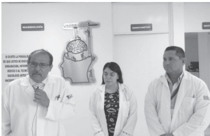
En los últimos años, el cáncer de mama en cifras, ha superado al cáncer cervicouterino; Michoacán ocupa el lugar 10 en fallecimientos por esta enfermedad.

H. Zitácuaro Michoacán, 15 de junio de 2022.- Por: Guadalupe Solache Rebollo. El Hospital Regional de Zitácuaro inició el día de hoy una campaña permanente de mastografías, para mujeres de 40 a 69 años de edad. El objetivo es detectar a tiempo el cáncer de mama, ya que esta enfermedad es curable si se atiende a tiempo.