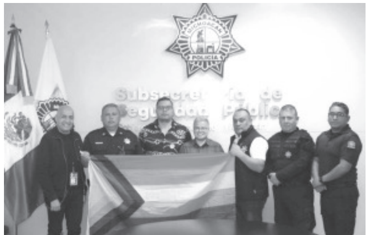
Con un aproximado de 20 mil asistentes, además de caravana de automóviles y vehículos alegóricos, Policía Michoacán y la Dirección de Tránsito y Movilidad coadyuvarán en las tareas para resguardar la zona Centro.

El respeto a la plena libertad de expresión a la manifestación es fundamental para esta institución. La SSP pone a disposición de la sociedad las líneas telefónicas de emergencias 911 y 089.