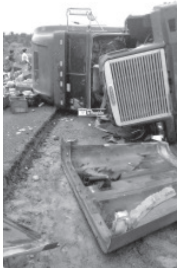
La autopista Siglo XXI fue escenario de tres accidentes uno, de los cuales tuvo dos víctimas mortales, un tráiler chocó contra un auto y en este fallecieron dos personas.

También se notificó del accidente mortal al personal del Ministerio Público para que comenzar las investigaciones correspondientes.