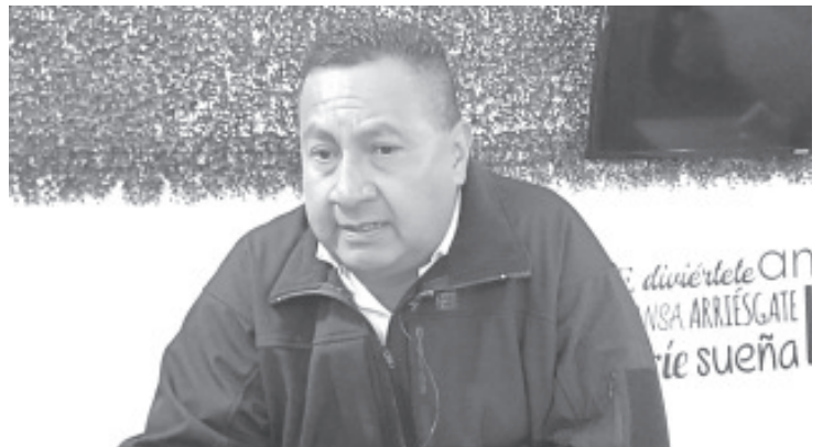
En promedio, al día ocurren 3 accidentes de este tipo; en fin de semana dicha cifra se incrementa ya que es cuando más jóvenes andan a bordo de sus motocicletas.