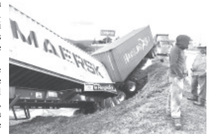
El conductor perdió el control del volante, el vehículo salió de forma intempestiva del asfalto y terminó parcialmente volcado tras caer a un desnivel.

Se apreció que el tractocamión es uno de la marca Kenworth, cabina blanca y doble semirremolque. Unos oficiales de vialidad se encargaron del peritaje respectivo y al final una grúa retiró el transporte siniestrado.