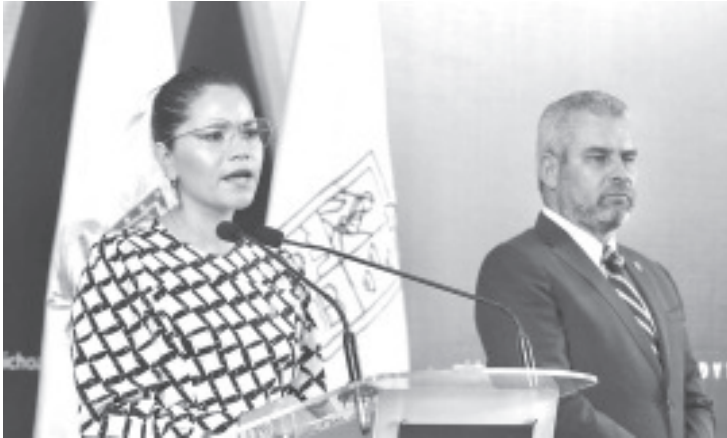
Las familias beneficiarias, son de 75 municipios, lo que representa el 66% del territorio del estado, siendo los municipios con más presencia: Morelia 19%, Uruapan 7%, Hidalgo 7% y Zitácuaro 4%.

Morelia, Michoacán, 13 de junio de 2022.- * A través del programa Bienestar para las Familias Cuidadoras de Niñas y Niños con Cáncer, la Secretaría del Bienestar (Sedebi) del Gobierno de Michoacán ha entregado un total de mil 827 apoyos en beneficio de 314 familias.