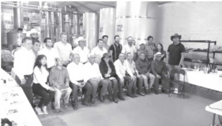
Existe preocupación por la plantación sin control del agave en el país ni regulación, mayormente en los municipios que no tienen denominación de origen.

El consumo de agave en el 2021, creció a nivel mundial un 20%, mientras la plantación de agave creció un 300%, por lo que se está sustituyendo las plantaciones en superficie que anteriormente se tenía cultivos básicos como maíz, sorgo y trigo.