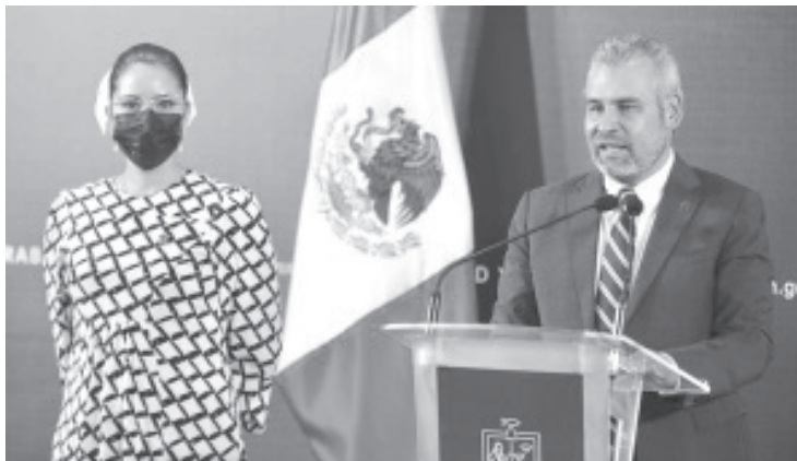
La persona adulta auxiliar deberá presentar: identificación oficial, acta de nacimiento, Clave Única de Registro de Población (CURP), comprobante de domicilio.