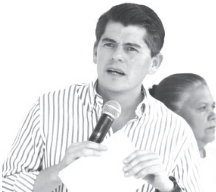
Ixtláhuac celebró que se invertirán 300 millones de pesos para la tecnificación de sistemas de riego y de agua potable en beneficio de Zitácuaro y 17 comunidades del oriente.