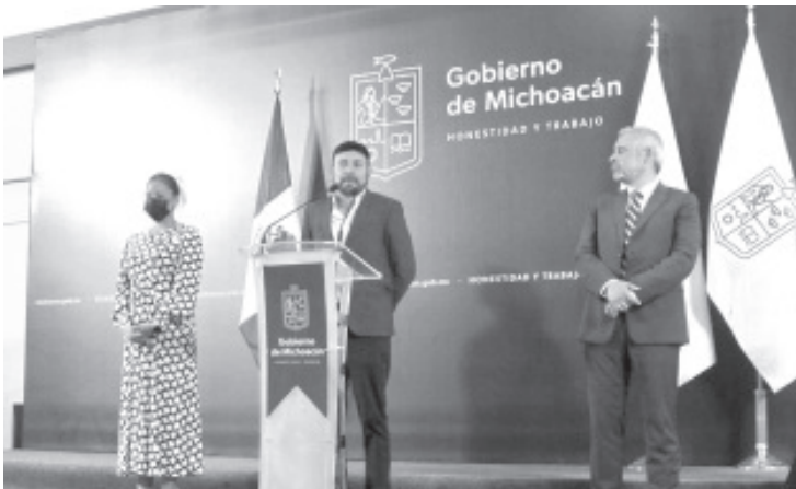
En la primera etapa, se rehabilitará el canal principal de la zona de riego, así como la Planta de Tratamiento de Aguas Residuales de Zitácuaro y la proyección de otras dos en Tuxpan y Jungapeo.