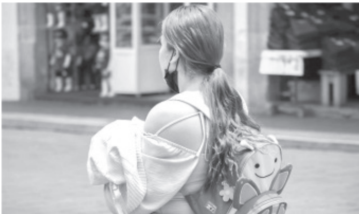
Del total de mujeres atendidas de enero a mayo, 14 mujeres sobrevivientes de violencia feminicida fueron ingresadas al Refugio Eréndira, así como 16 hijas e hijos de las mismas.

Por su parte, Sosa Alanís exhortó a la ciudadanía a visibilizar la violencia contra las mujeres: “se precisa de un trabajo coordinado con las y los ciudadanos de forma permanente para prevenir, sancionar y erradicar las violencias contra las mujeres, para que estas se visibilicen e identifiquen, de tal modo que las víctimas busquen el apoyo necesario en las instancias creadas para tal fin”, finalizó.