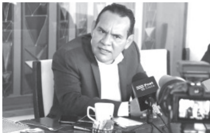
Las autoridades municipales cuenta con más de dos semanas para entregar al Congreso el referido informe, y dar cumplimiento con ello al mandato de Ley.

“Estas disposiciones de fondo son herramientas que fortalecen el orden y la transparencia en el manejo de los recursos, por lo que las autoridades deben tener claro que su cumplimiento les permite el fortalecimiento de sus haciendas municipales”, refirió.