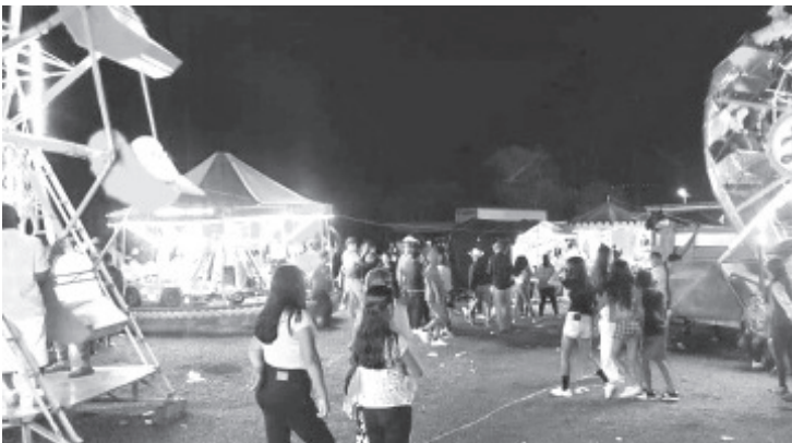
Este año la primera feria que se realizó fue en la colonia El Moral, le siguió la Santísima Trinidad y próximamente se tendrá la de San Juan el 24 de junio.

Muñoz Jiménez, resaltó que este tipo de comercio representa mucha tradición, y es una forma además de reactivar la economía del municipio; son de menor impacto, tienen menor riesgo porque no generan muchas concentraciones, aunado a que la mayoría de la población ya está vacunada.