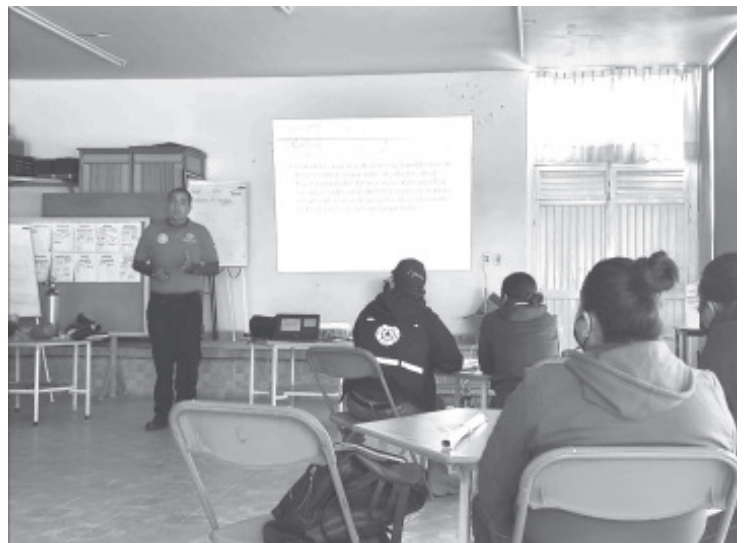
Los requisitos son: tener mínimo 17 años, disponibilidad de horario y de practicar para adquirir las habilidades necesarias.

Destacó que el cupo será limitado, por lo que quienes estén interesados en ser parte del curso, deberán registrarse en sus instalaciones o a los números 7151888380, 7151041373 y 7861434566, también en la página de Facebook.