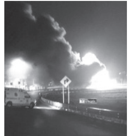
Un cuerpo femenino fue encontrado dentro de los restos calcinados de una pipa incendiada, tras un accidente en la autopista a Guadalajara, tramo Pátzcuaro-Cuitzeo.

restos humanos a la morgue. Se espera que en las próximas horas la persona finada sea reconocida y reclamada por sus deudos.