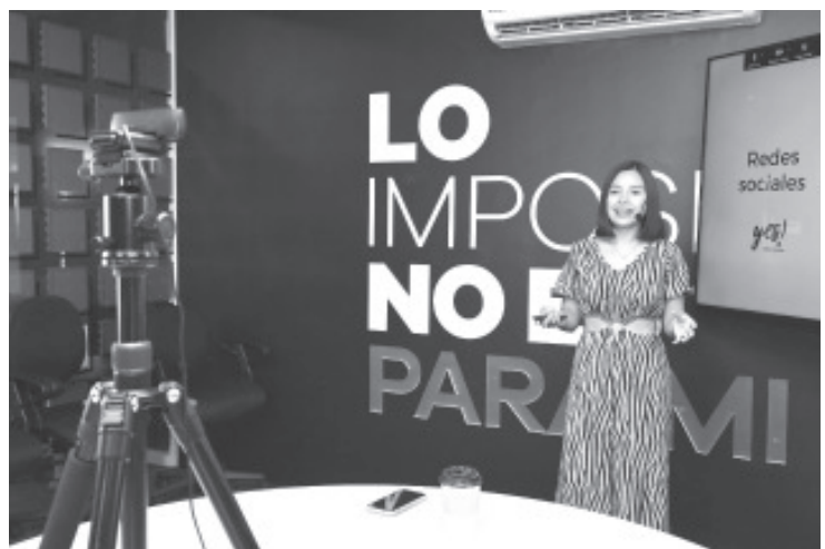
En el año 2021, el 91 por ciento de los consumidores mexicanos ya había interactuado con un negocio a través de canales digitales.

Esta capacitación se impartió a través de la cuenta de Facebook de Espacio Emprendedor, en la que puede ser consultada sin costo alguno, en el enlace https://www.facebook.com/espacioemprendedor.mx/videos/690768705314097 .