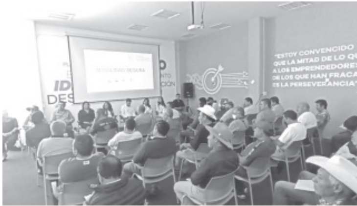
Este curso se tiene que dar por ley, ya que los transportistas son servidores públicos, asimismo por representar la mejora del servicio.

H. Zitácuaro Michoacán, 07 de junio de 2022.- Por: Guadalupe Solache Rebollo. Para garantizar seguridad a sus pasajeros y al mismo tiempo mejorar el sector, líderes del transporte recibieron capacitación por parte de la COCOTRA y el ICATMI a través del curso 'Viaja Seguro'. Este curso arrancó en Zitácuaro y se pretende llevar a todo el estado.