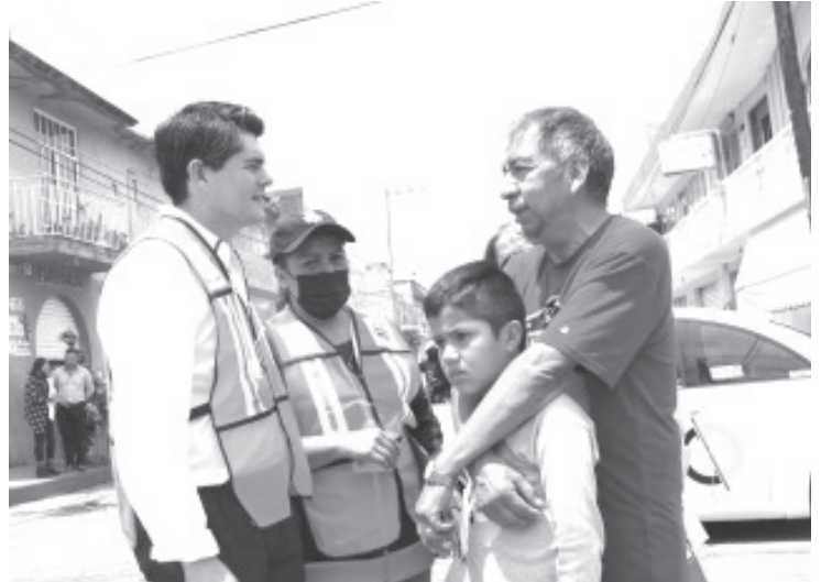
El programa involucra a padres de familia, corporaciones de Tránsito y Vialidad y a las escuelas para evitar accidentes y haya accesos y salidas más seguras.