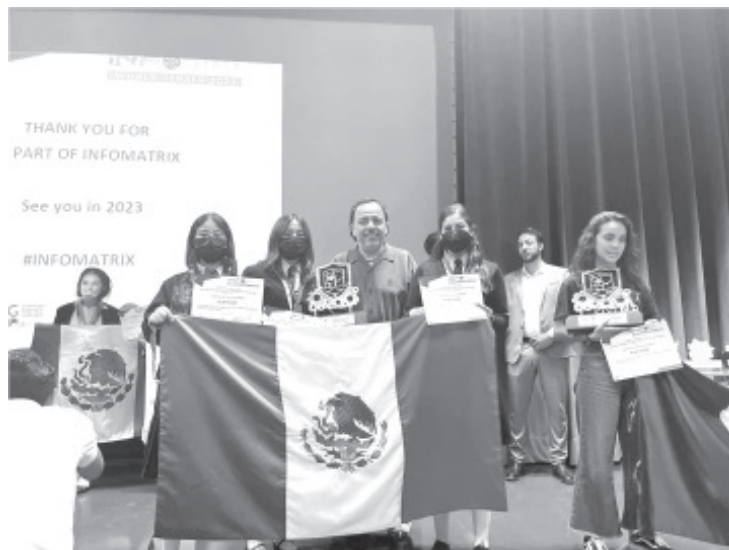
Una vez más los estudiantes ponen en alto el nombre del subsistema de Michoacán y de México, dejando de manifiesto que en el Cecytem se trabaja con grandes asesores y docentes.