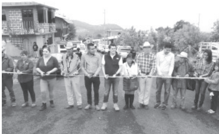
"Hicimos esta obra como parte de una de las demandas más sentidas de la población que durante años fue solicitada y hoy se hace realidad gracias a nuestro #GobiernoDeSoluciones".

Aseguró seguir trabajando en conjunto con los habitantes de esta región donde se consolidará el primer Parador Turístico de la Mariposa Monarca.