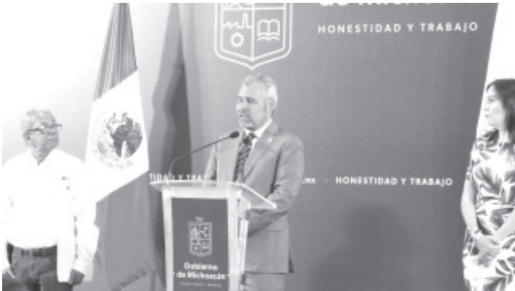
Ramírez Bedolla también reiteró que lo hizo con su propio recurso, a diferencia de los que realizaba el ex gobernador, Silvano Aureoles Conejo, con la Alianza Federalista.

Finalmente informó que durante su visita en ambos estados avisó a los gobernadores en señal de buena voluntad debido a que prioriza política del buen vecino y buscar acuerdos con otros mandatarios.