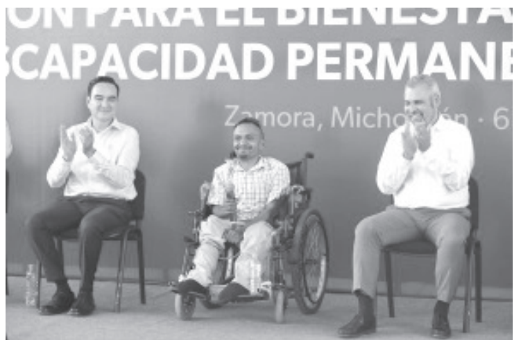
Son 2 mil 800 pesos bimestrales el apoyo que se entregará a las personas con discapacidad de 30 a 64 años de edad, señaló el gobernador Ramírez Bedolla.