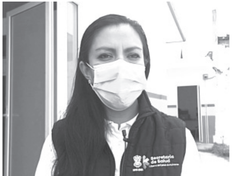
Para lograr que cada vez sean mas los que estén en regla, se les convocó a los responsables para que recibieran un curso de capacitación del personal de COEPRIS.

Comentó que este curso de capacitación fue voluntario, y se espera concientizar a los responsables de estos Centros para que regularicen su situación. También agregó que durante la pandemia, personal del Centro Nacional de Adicciones recorrió varios lugares y los que tenían anomalías cerraron, ya que no quisieron mejorar las condiciones, esta ocasión se espera una mejor respuesta.