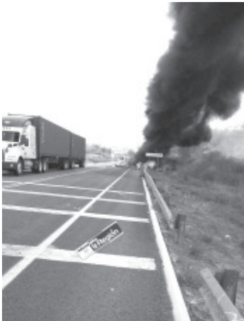
El aparatoso accidente tuvo lugar en las inmediaciones del kilómetro 276, en el tramo carretero Lázaro Cárdenas - Arteaga, donde la pesada unidad terminó ardiendo en llamas.

La circulación se encuentra parcialmente cerrada, por lo que se exhorta a los automovilistas que transiten por la zona a extremar precauciones.