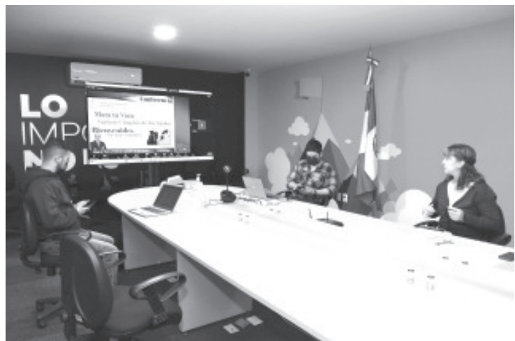
La capacitación se ha vuelto una exigencia para la actividad inmobiliaria, pues estar a la vanguardia genera muchos beneficios tanto al profesional inmobiliario como a sus clientes.

La Sedeco acerca a los asesores inmobiliarios cursos de actualización y superación personal que les permitan contar con las herramientas necesarias para enfrentarse a un mercado con alto índice de competitividad.