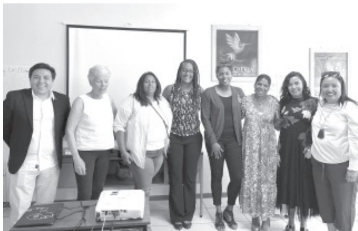
La SEE en coordinación con otras dependencias, realiza el 1er. Intercambio Educativo Binacional entre Indianápolis y Michoacán, dirigido a docentes en programas de intercambio.

Para finalizar, se realizará una visita a Paracho con autoridades municipales y educativas el miércoles 8 de junio abarcando desde su hora de salida a las 8:00 am hasta el arribo a Morelia a las 5 de la tarde, aproximadamente.