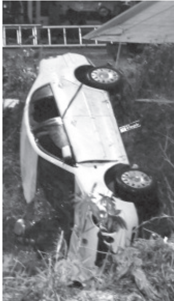
Un hombre murió al caer su auto al canal de aguas negras en el municipio de Tarímbaro.

Luego de recuperar el referido coche, el cadáver fue extraído del interior y llevado a la morgue para la práctica de la necropsia de ley. El difunto permanece como no identificado y su media filiación no fue proporcionada.